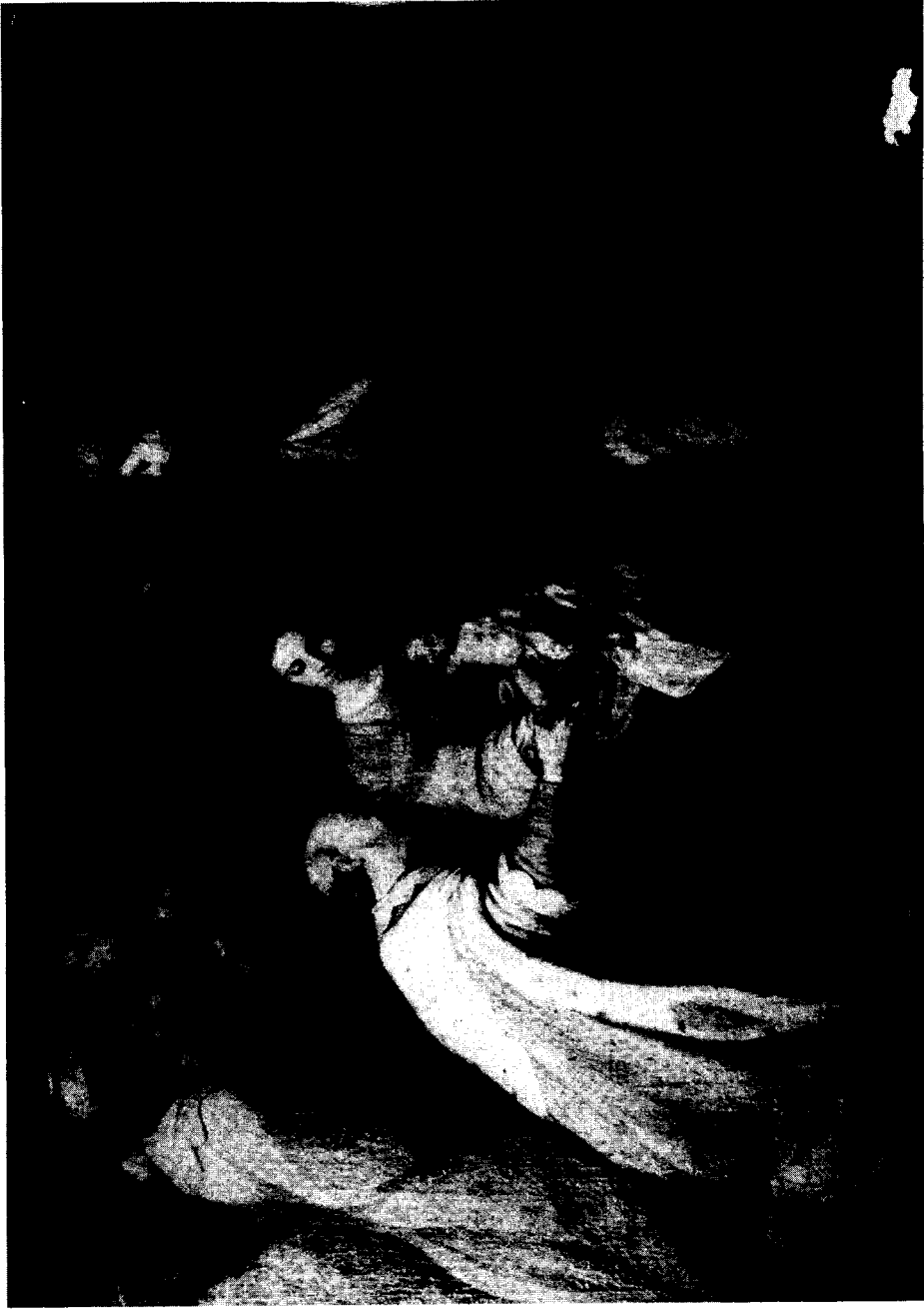
2.-Jerónimo de Bobadilla. Adoración de los Magos. Colección particular. Málaga.