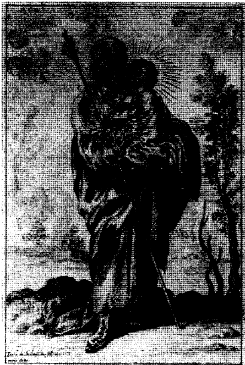
Jerónimo de Bobadilla. San José con el Niño. Dibujo a tinta y aguada. Museo de Hamburgo.