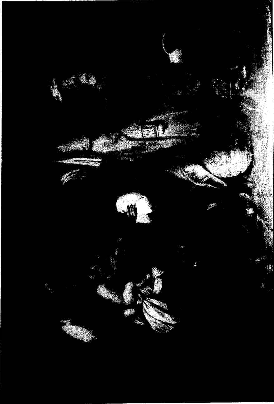
1.-Jerónimo de Bobadilla. Adoración de los Reyes. Colección particular. Málaga.