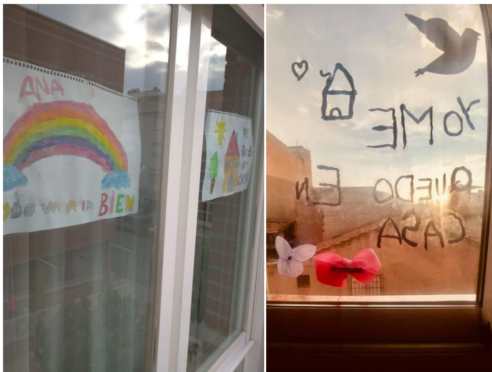
Figuras 4 y 5. Ventana de Y. y S. Barriomar.

puedes pagar la luz y el agua, costear el wifi o tener un ordenador son lujos. Mientras la situación de confinamiento los transforma de necesarios a imprescindibles.