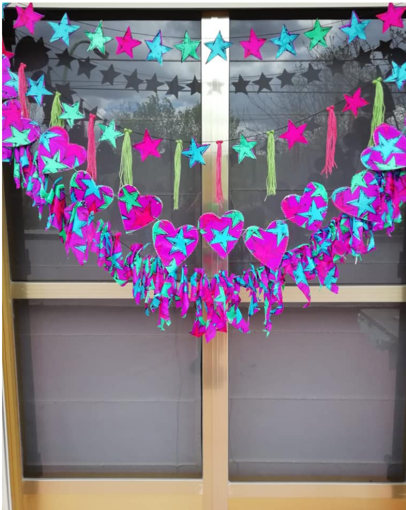
Figura 1. Ventana de Mari Cruz Santos. Méntrida (Toledo) (Marzo, 2020)

presamos con nuestros balcones. ( https://www.facebook.com/vestirlosbalcones ) e Vestirlosbalcones (@vestirlosbalcones) • Fotos y videos de Instagram.