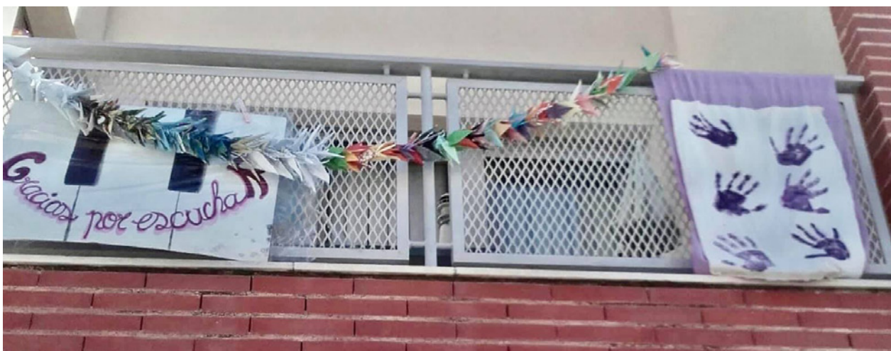
Figura 2. Balcón de Rosa Arenas y sus hijos. (Marzo, 2020)