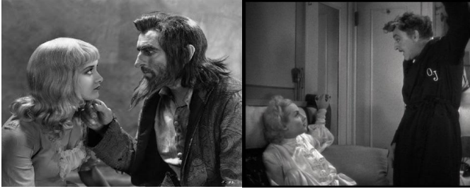
Fot. 1. A la izquierda, John Barrymore como Svengali (Archie Mayo, 1931); a la derecha, como Oscar Jaffe en La comedia de la vida (Howard Hawks, 1934).