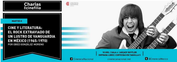
Imagen 8: Charlas de Cinefilia, Cineteca Nacional México, 2016.