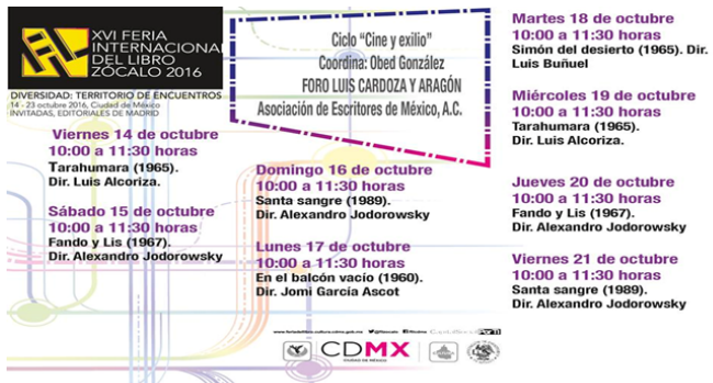
Imagen 6: Promocional Ciclo de cine. Feria Internacional del Libro en el Zócalo, 2016