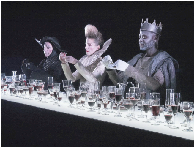
Imagen extraída de una grabación de la representación como ejemplo de la puesta en escena.