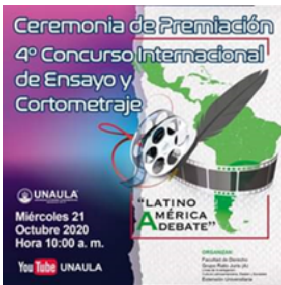
Imagen 4: Premiación. Universidad Autónoma Latinoamericana de Medellín, 2020, en Colombia.