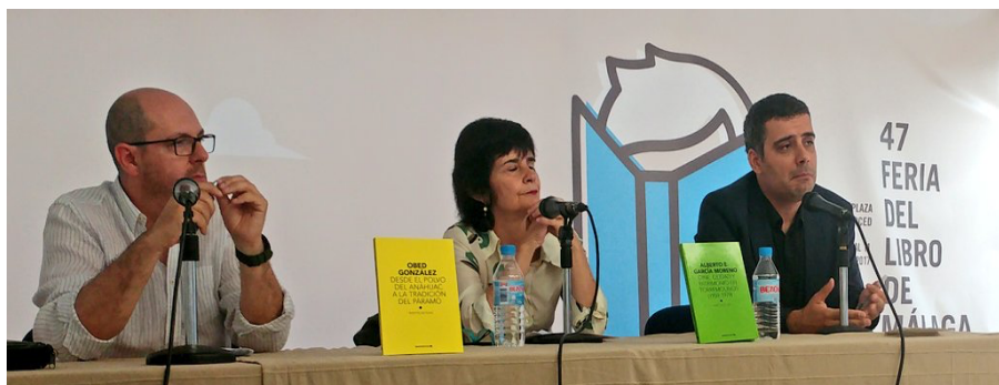
Imagen 3: Presentación del libro producto del proyecto en la 47 FERIA del Libro de Málaga 2017, en España.