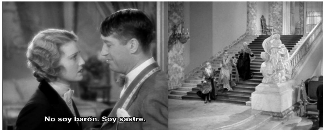
Fot. 3. Secuencia de Ámame esta noche ( Love Me Tonight , Rouben Mamoulian, 1932) en que Maurice confiesa su verdadera identidad.