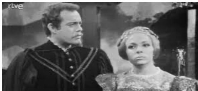
Fotograma correspondiente a la retransmisión de la adaptación de El caballero de Olmedo , del 29 de octubre de 1968.