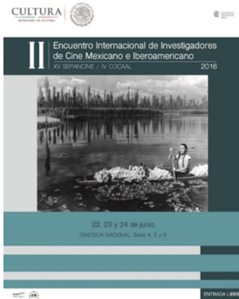
Imagen 7: Encuentro Internacional de Investigadores de Cine Mexicano e Iberoamericano, 2016.