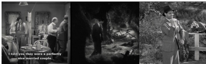
Fot. 4. Sucedió una noche (Frank Capra, 1934). Momentos de «humor trascendental», según Cavell.