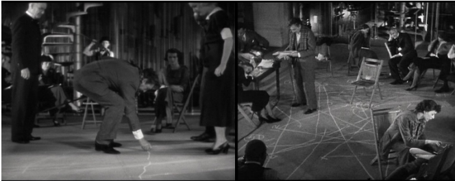
Fot. 2. Las rutas ( tracks ) trazadas por Jaffe en el suelo para Mary Jo (izquierda) se convierten en el laberinto cerebral del director (derecha), una metáfora visual que funciona a modo de prolepsis del viaje vital que experimenta la protagonista en La comedia de la vida (Howard Hawks, 1934).