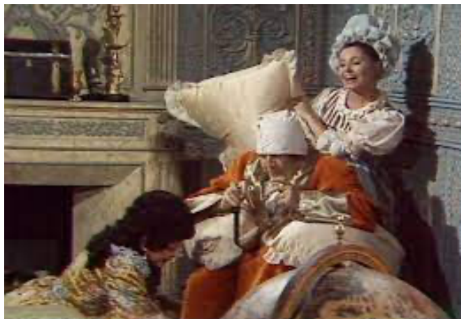
Fotograma correspondiente a la retransmisión de la adaptación de El enfermo imaginario , del 21 de octubre de 1979.