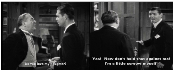
Fot. 5. Peter Warne (Clark Gable) admite su locura en Sucedió una noche (Frank Capra, 1934).