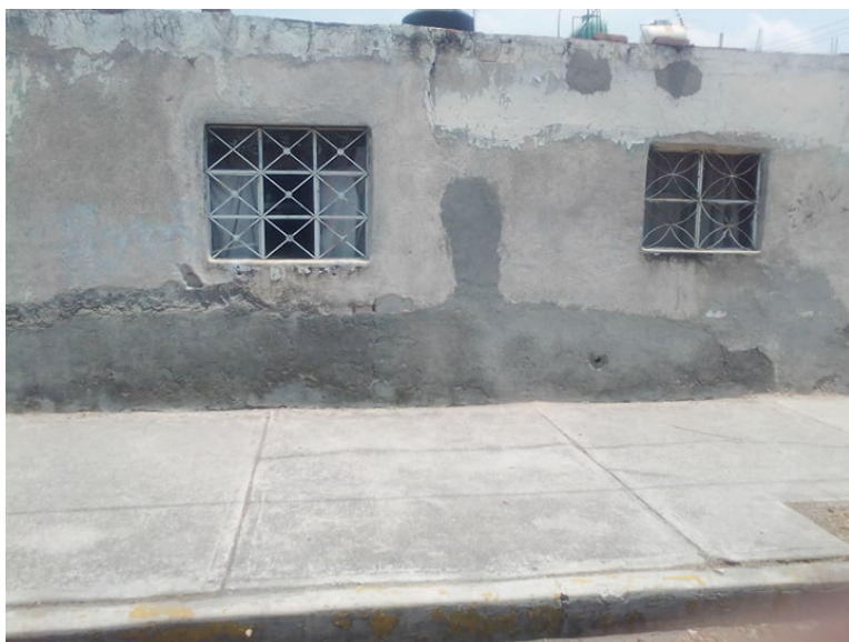
Imagen 2: Calle donde se tomó la escena de la fotografía anterior en la actualidad. Mayo, 2020