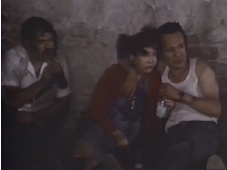
Imagen 1: Captura de pantalla: Cameo de indigente nombrado El capitán o El Superman de la colonia . Aviación civil en la delegación Venustiano Carranza del Distrito Federal junto con el director de cine Marcelino Aupart en la película Ardor de juventud , 1987. Cine marginal y de resistencia