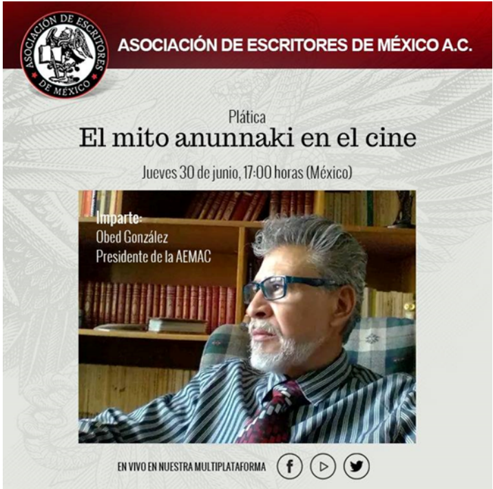
Imagen 5: Plática sobre el Mito anunnaki en el cine, 2022.