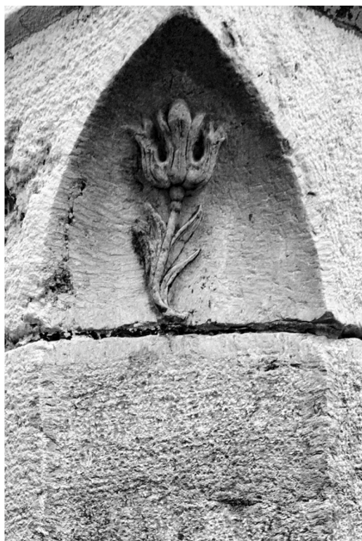
En la esquina de la calle Arco de la Cabeza con calle Gordón, una preciosa ¿flor de lis? realizada en piedra para adornar el guardaesquina.