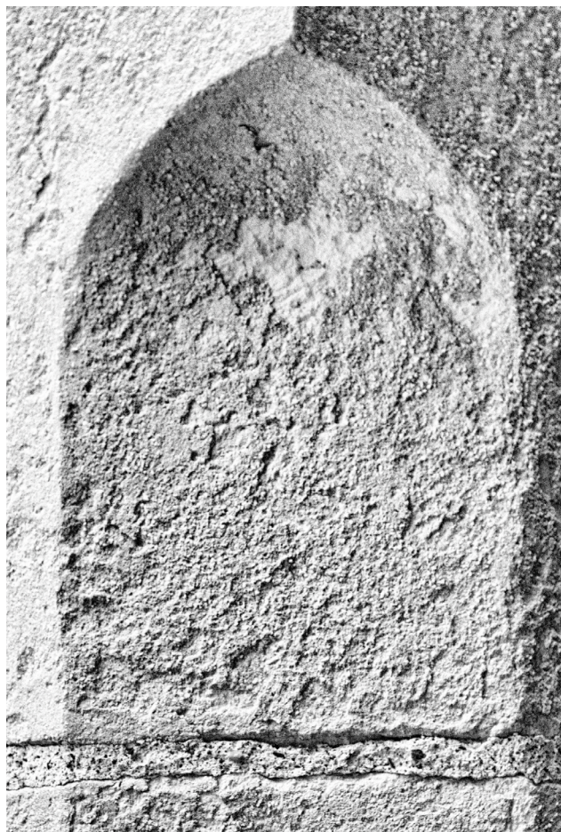
En la misma plazuela de San Juan de Dios, un guardaesquina sin adorno.