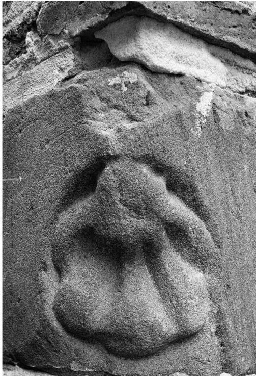
Este guardaesquina, que parece representar una concha de peregrino, se encuentra en la parte trasera de la iglesia de la Concepción, en la esquina de la calle Francisco de Rioja con la plaza de las Flores.