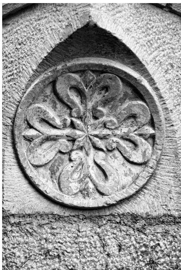
En calle Andres Pérez esquina a Arco de la Cabeza, encontramos en el chaflán el escudo de los dominicos. Hasta el año 2013 la iglesia formaba parte del convento de clausura de la Aurora y Divina Providencia de las Reverendas Madres Dominicas, que lo construyeron en 1787.