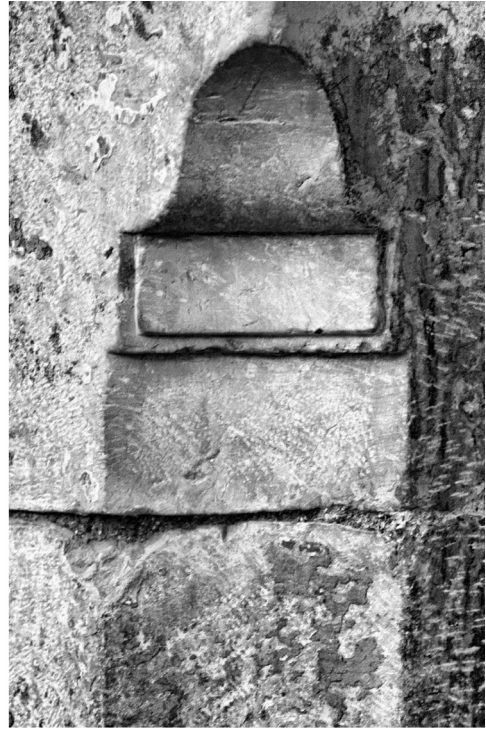
Esquina Andrés Pérez y plaza de los Mártires. Guardaesquina rematado con una pequeña cartela y gola.