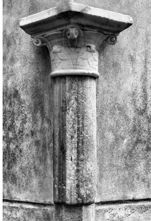
En calle Compañía, frente a la calle Salvago, se encuentra el Museo Thyssen, anteriormente Palacio de Villalón, una residencia nobiliaria de finales del siglo XV y comienzos del XVI reformada y ampliada en el XVIII por la familia Villalón, de la que toma el nombre. En su esquina con la calle Mártires podemos ver este bonito e impresionante guardacantón, formado por una ménsula y un pilar de ángulo.