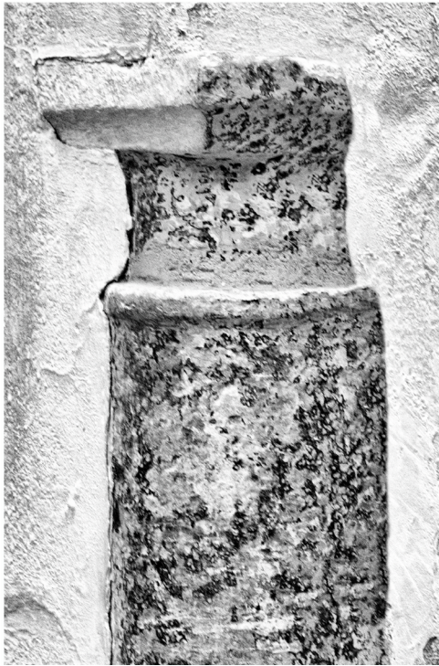
Calle Andrés Pérez esquina a calle Pozos Dulces. Guardaesquina semienterrado en la obra, aparentemente un pequeño capitel. A pesar de los restos de pintura que aún se perciben, parece que es de mármol.