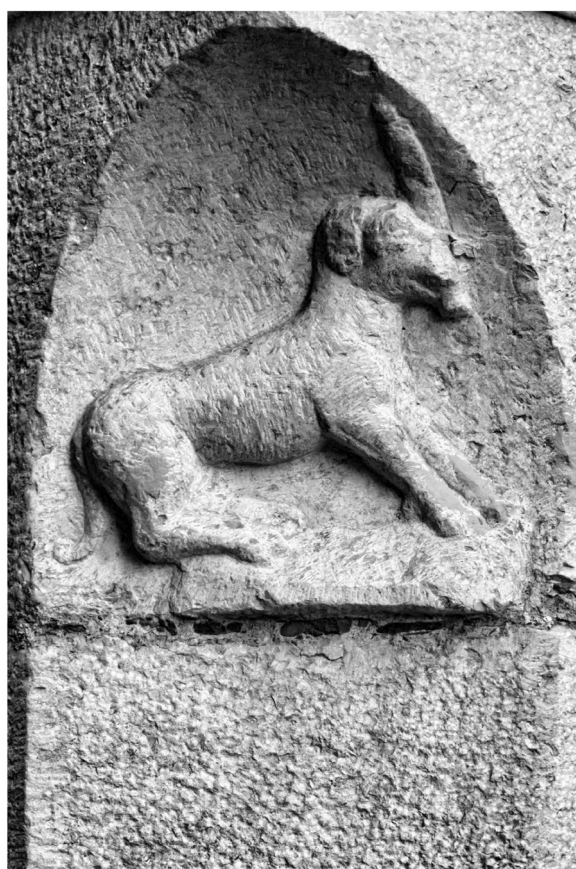
En el otro chaflán de la fachada de la iglesia de las Dominicas de la Divina Providencia podemos ver el perro con la antorcha en la boca, símbolo que va unido a la figura de santo Domingo.