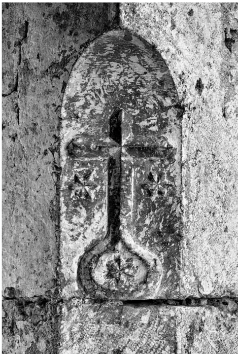
Otra enseña carmelita en la calle Compañía esquina con la calle Fajardo.