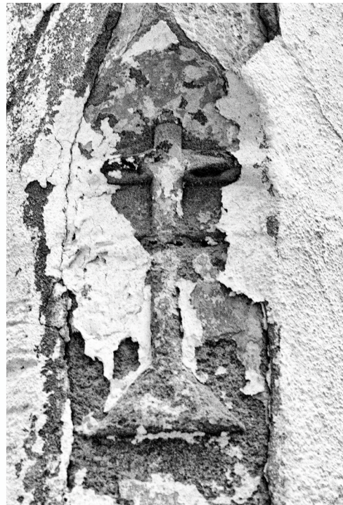
En los números 17, 19 y 21 de Pozos Dulces se ubicó La Casa del Niño Jesús desde el año 1911 hasta su cierre, en 2008. Fue una institución de labor asistencial iniciada por voluntarios y jesuitas malagueños. En una de sus esquinas podemos ver este guardacantón, símbolo de la orden.