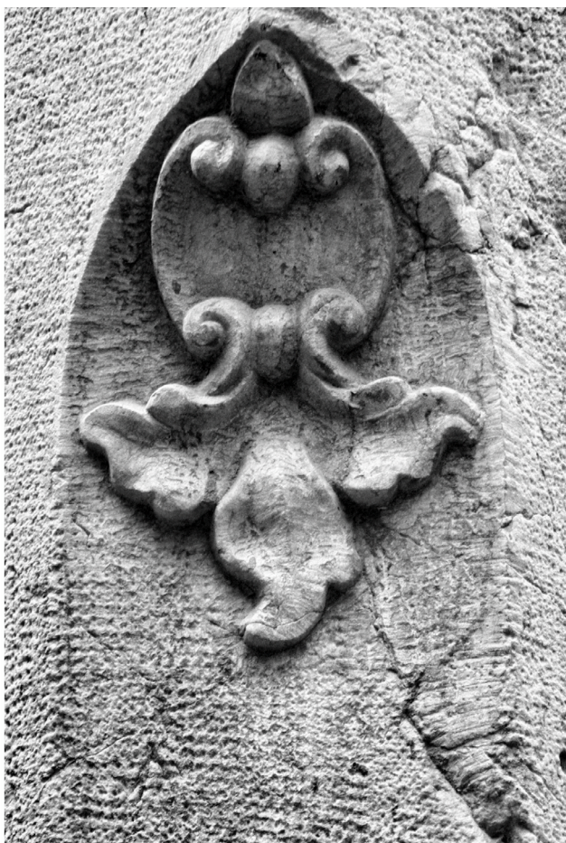
El mismo edificio de la familia Solesio, esquina con la calle Tomás de Cózar. El adorno es una pequeña representación floral.