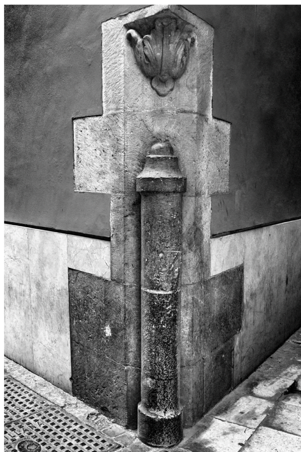
Un curioso guardaesquina en la parte alta de la calle Granada, esquina a San José. Se diría que la imagen de este elemento es un cañón puesto de pie con la boca hacia el suelo y rematado en la parte superior con un adorno de hojas de acanto.