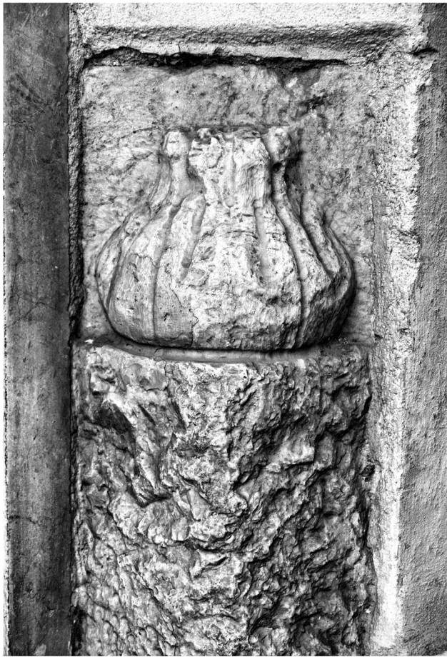
Situado en la Alameda Principal esquina a la calle Pedro de Mena, se encuentra este guardaesquina; hay uno a cada lado de la entrada de la calle. De los dos, este es el único que se conserva en piedra; el otro, aunque se conserva bien, tiene varias capas de pintura.