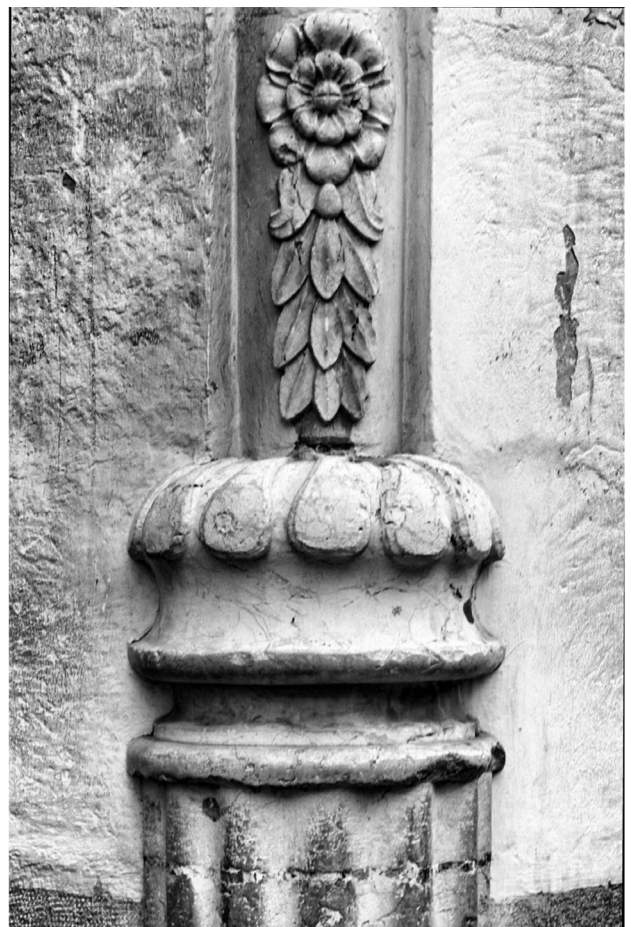
Edificio con entrada por el núm. 20 de la calle Puerta del Mar, con fachada a la Alameda Principal y a la calle Panaderos, construido por la familia Ugarte-Barrientos en 1776. En una segunda época perteneció a la familia Álvarez Net. Posteriormente fue el Hotel Regina. En la actualidad es la sede de Edipsa. El edificio contiguo que conforma la manzana alojó la Delegación Provincial de la Once hasta su traslado a la calle Cuarteles. Tiene guardacantones en las cuatro esquinas de la manzana; este es un pilar de ángulo rematado con un motivo floral.