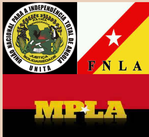
Las tres fuerzas políticas que luchaban por la independencia en Angola y al mismo tiempo mantenían un fuerte enfrentamiento entre sí.

En cuanto a las negociaciones de pacificación e independencia en las antiguas colonias, se prolongarían por un año, con inevitables tensiones y lamentablemente algunos muertos todavía. Especial dificultad tuvieron en Angola, pues mientras en Guiné-Bissau y Mozambique había un solo interlocutor independentista en ambos casos, en Angola serán tres las fuerzas enfrentadas entre sí: Movimento Popular de Libertação de Angola (MPLA), apoyados por diversos países africanos, Cuba y la Unión Soviética; Frente Nacional de Libertação de Angola (FNLA), herederos de la UPA, apoyados por EE. UU., Zaire, China y Corea del Norte; y União Nacional para a Independência Total de Angola (UNITA), con apoyo de Sudáfrica y EE. UU. Ello dará lugar a una prolongada y sangrienta guerra interna que perdura hasta 2002 (Belo, 2022). Lamentablemente, los otros países descolonizados tampoco se librarían de enfrentamientos internos.