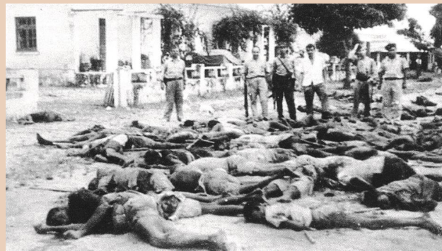
Masacres de la UPA.

La lucha por la independencia la inició la União do Povo Angolano (UPA) en el norte de Angola, comandada por Holden Roberto. Sería el 3 de enero de 1961, en la Baixa de Cassange –territorio del norte de Angola– donde se produjo una revuelta de campesinos negros empleados en las plantaciones algodoneras, de cultivo e instalación obligatoria para los trabajadores, sobre terrenos asignados por la compañía explotadora luso-belga. Protestaban por las duras condiciones de trabajo y