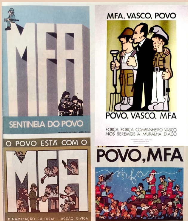
Propaganda con la que el MFA proclama su alianza con el povo («pueblo»).

de los votos), las fuerzas estaban divididas en dos bloques claramente diferenciados, con predominio de socialistas y comunistas. Pero el PS enseguida se sentirá investido de la legitimidad popular para dirigir el proceso político del país, en tanto que el PCP subraya que las elecciones eran solamente para realizar el proceso constituyente –redactar la Carta Magna– y que esas elecciones no podían suplantarse a la revolución en marcha.