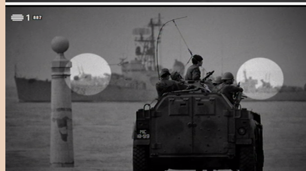
Fragata Almirante Gago Coutinho frente al Terreiro de Paço, el 25 de abril de 1974.

poder absoluto do capital monopolista; conquista das liberdades democráticas» y «o objetivo final da conquista do socialismo, o qual é indispensável para a construção de uma sociedade justa e digna» 8 .