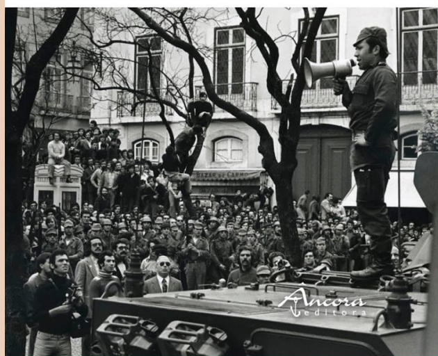
Cubierta de la autobiografía de Salgueiro Maia.

El referente opositor militar que suponen el general Humberto Delgado y el capitão Henrique Galvão se hace cada vez más contundente y el 11 de noviembre de 1962 difunden un comunicado en el que afirman: «No que se refere à questão do colonialismo português, a nossa política é de negociações imediatas entre o governo português e os movimentos de libertação africanos para o autogoverno» (Pezarat Correia, 2017: 159). Una posición que no se generalizará en el interior del ejército de momento, pues aún está muy arraigada entre sus filas la idea de un Portugal do Minho até Timor , pese a que el número de tropas enviadas aumenta cada año al tiempo que crece la cantidad de muertos y heridos en los conflictos. Unos conflictos asimétricos de guerra de guerrillas, en los que los combatientes independentistas cuentan con el factor sorpresa, las emboscadas, el conocimiento exhaustivo del terreno, la complicidad de los nativos, la