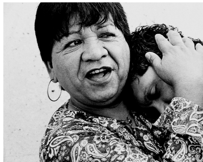
Todo sobre mi madre.