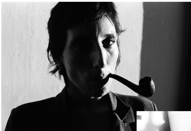
La noche de los poetas.