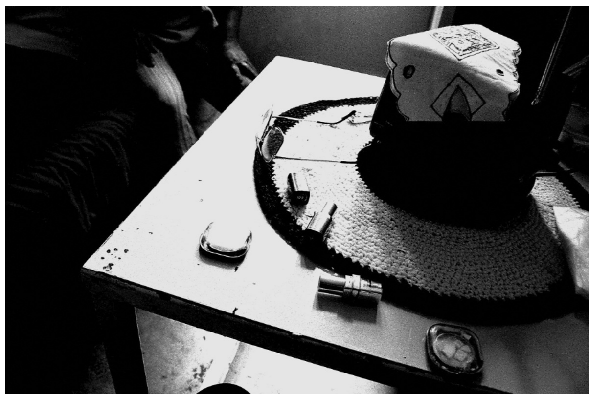
Detalles tan pequeños de las dos.