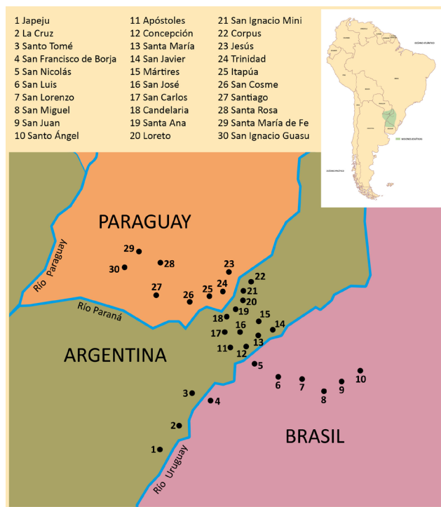
Mapa de localización de la provincia jesuítica de la Paraquaria. Su extenso territorio abarcaba regiones hoy ubicadas dentro de las fronteras de Argentina, Brasil y Paraguay. Aunque la Orden de Jesús también extendería sus dominios hacia el norte del Paraguay y territorios hoy bolivianos.

vo aporte poblacional europeo –como sucedió en otras regiones americanas–, toda la provincia se habría apagado lánguidamente con el correr de los años. En tales condiciones, la presencia de las órdenes religiosas y especialmente la de los jesuitas sirvió para mantener viva la llama y rescatar otros valores en la relación con la tierra y sus usuarios originales, los nativos. Para explicación de este fenómeno, podría apelarse a un simple detalle: la progresiva declinación estadística de la población indígena en su contacto con las fuerzas colonizadoras europeas en cualquier otro enclave de América. Mientras tanto, como visible contraste, en las reducciones jesuíticas del Paraguay la población de originarios conoció prolongados períodos de crecimiento demográfico.