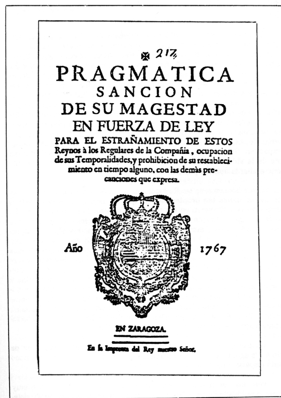
Orden de expulsión publicada en Zaragoza en 1767. Esta expulsión sucedía a las que se habían producido en Portugal (1759) y Francia (1762).

exclusividad, la importación de artículos extranjeros, negocio en el que se sustraían a todo impuesto.