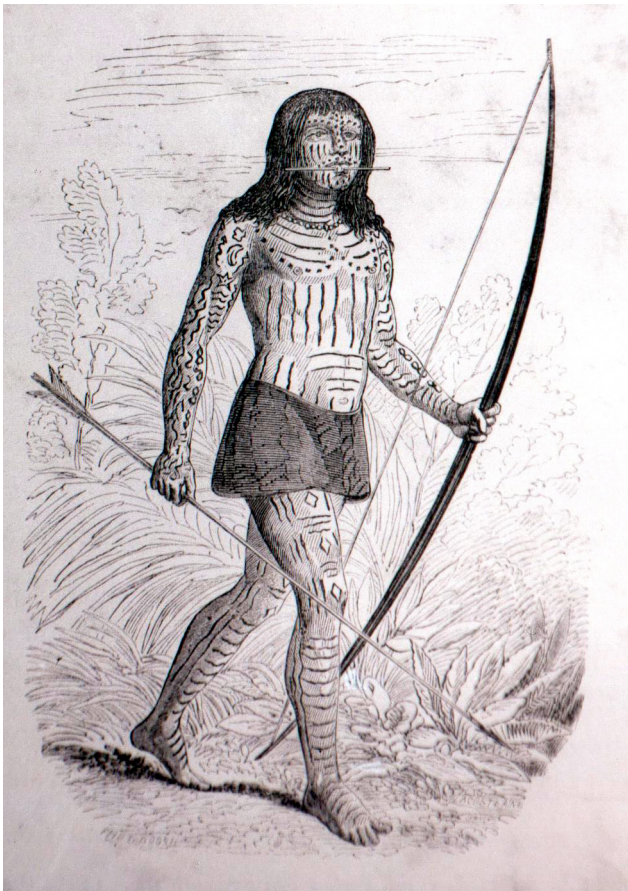
Nativo ataviado según la visión de los primeros cronistas de la conquista. Salvo por el taparrabos, el dibujo contiene algunas de las características de su real indumentaria: especialmente, la pintura corporal y el tembetá –hueso colgado de los labios–. En cambio, faltan los abalorios de plumas y sus instrumentos de combate.

aceptar el ritmo de la naturaleza, los indios consideraban, conforme a ese mismo orden, el que los hombres cazaran, pescaran y talaran los árboles para desmontar la futura roza y que las mujeres amamantaran hijos, cocinaran los alimentos, cuidaran de los cultivos y acompañaran a sus maridos en las expediciones, cargadas de sus armas y provisiones. Unos y otras habían nacido para ocuparse de menesteres distintos y así como esta diferencia era reconocida y espontáneamente aceptada, lo era también la que separaba a las distintas generaciones y confería particular deferencia a los ancianos, depositarios de la memoria y de la experiencia del grupo.