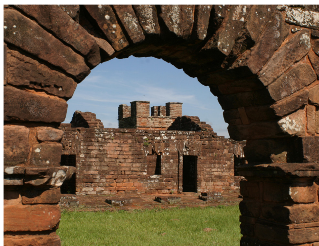
Ruinas de la reducción de Trinidad. Detalle de arco «abovedado» y línea de pilares tallados en una sola pieza de piedra. La antigua reducción se encuentra próxima a un poblado del mismo nombre, en el sur de Paraguay.

Esta desnudez y su vinculación con el pecado, según el concepto cristiano católico, fue el conflicto más grave que debían resolver los misioneros. Consideraban que la eliminación de aquel foco de «perdición y lujuria» representaría «el primer signo de humanidad entre los bárbaros» (Haubert, 1991, p. 121). Vinculado con este mismo fenómeno, los religiosos también debían afrontar los habituales ofrecimientos en las comunidades originarias, pues los visitantes debían corresponder a sus gestos de amistad aceptando desposar a alguna de sus hijas o hermanas. El código de reciprocidad determinaba que el extranjero fuera retenido y obligado a brindar —él también y de por vida— sus propios favores. No bastaba con que el jesuita se limitara a solicitar el auxilio y la protección de algún cacique. Si deseaba quedarse, debía confirmarlo esposando a las mujeres que le fueran ofrecidas (Haubert, 1991, p. 121).