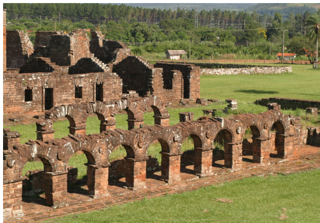
Ruinas de la reducción de Trinidad (Paraguay). Destaca la prominencia del enclave en relación al terreno circundante.

to de los rituales y la «mecánica» de trabajo en las misiones, muchos de ellos se rebelaron tomando posesión del papel de los sacerdotes. Unos cuantos hasta se atribuyeron poderes divinos... y se autodenominaron «hombres dioses» (Haubert, 1991, p. 165). Uno de ellos fue el cacique Miguel Atiguaje, poderoso y respetado cacique de San Ignacio que fue nombrado por los mismos sacerdotes capitán general de la reducción. Sin embargo, aunque ya convertido, este cacique no aceptó que le retiraran las concubinas. Molesto, proclamaba que los religiosos «son alcahuetes de las indias fugitivas». Amenazado con los castigos del infierno pero sin que las amenazas se concretaran, Atiguaje se consagró a sí mismo sacerdote y oficiaba el culto en su propia cabaña.