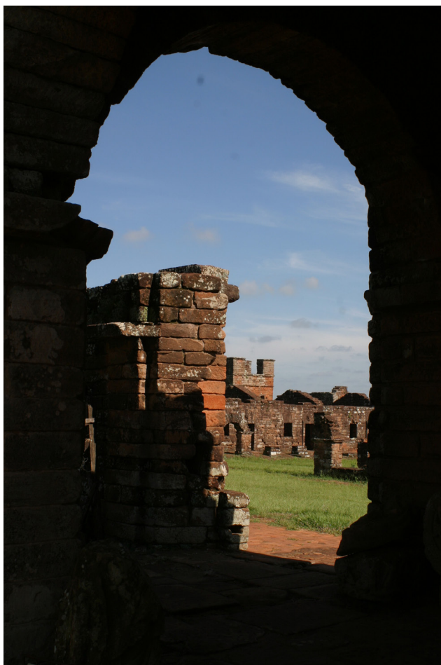
Ruinas de la reducción de Trinidad (Paraguay). Vista del interior a través de un arco de piedra.

tados producían una honda impresión a los nativos y, tanto como la escultura, la pintura fue un factor importante para otorgar a los templos el «ambiente» adecuado para la devoción. Solo en la iglesia de San Ignacio se contaban no menos de 1.400 pinturas, pues todo el techo y las paredes del templo estaban cubiertos de óleos. También sobresalieron en esta actividad los indígenas. El más conocido fue el trabajo de J. M. Kabiju, «autor de una tela que representa a Nuestra Señora, con rasgos de la escuela flamenca que hicieron dudar a críticos europeos sobre su procedencia guaraní» (Cardozo, s. f., p. 140).