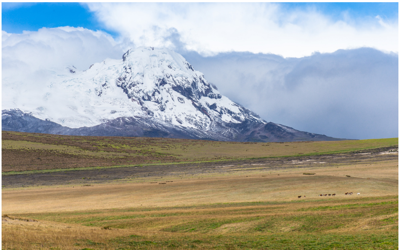
El volcán Antisana es uno más de los tantos volcanes activos de Ecuador. Se encuentra cubierto por glaciares, aunque el volumen de estos se ha reducido en más de un 35 % en las últimas décadas.