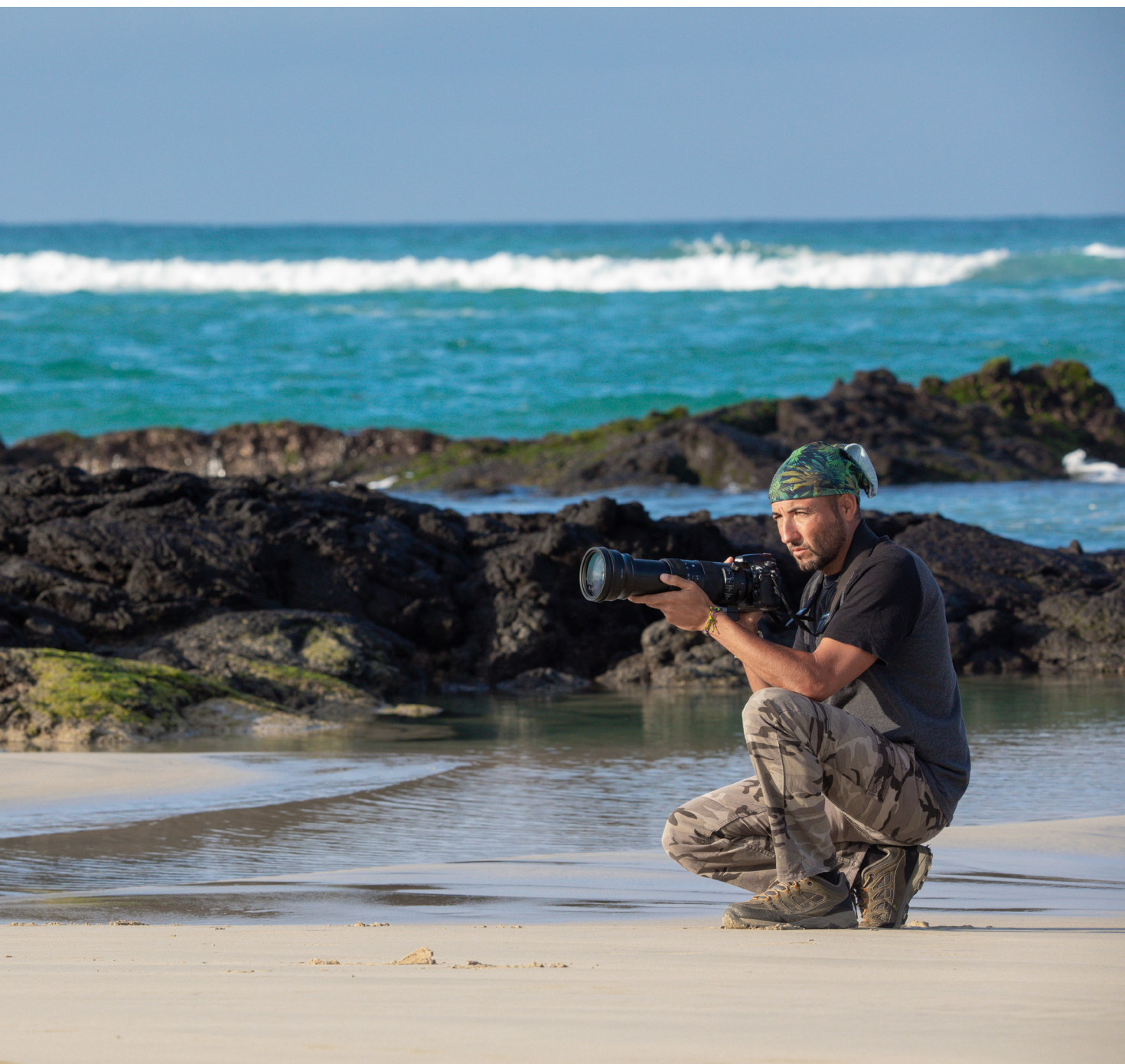
Las playas de Puerto Villamil (en las islas Galápagos) son un paraíso de arenas blancas y aguas turquesas. Ideales tanto para darse un baño o tomar el sol como para la observación de fauna silvestre (lobos marinos, iguanas marinas o piqueros de patas azules, entre otros).