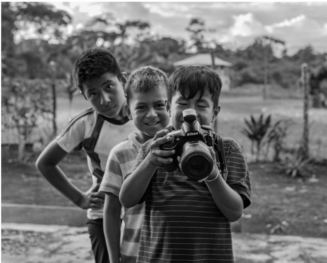
«De mayor quiero ser como el que aprieta el botón», nos decía el chico cofán que sostiene la cámara, quien probablemente no sabía que lo que deseaba era ser fotógrafo. El grupo étnico de los cofanes lucha por preservar sus costumbres mientras envía a los niños más pequeños a estudiar fuera de sus aldeas, con la intención de garantizarles un futuro «mejor».