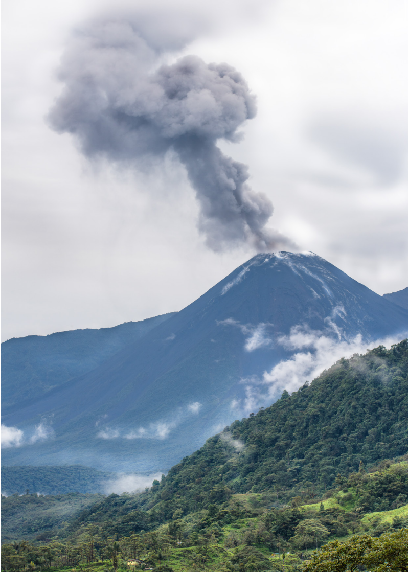
El Reventador es uno de los volcanes más activos del arco volcánico ecuatoriano. Su última erupción tuvo lugar en diciembre de 2017, cuando incluso emitió gases y lava, pero no llegó a suponer ninguna amenaza para las comunidades cercanas.