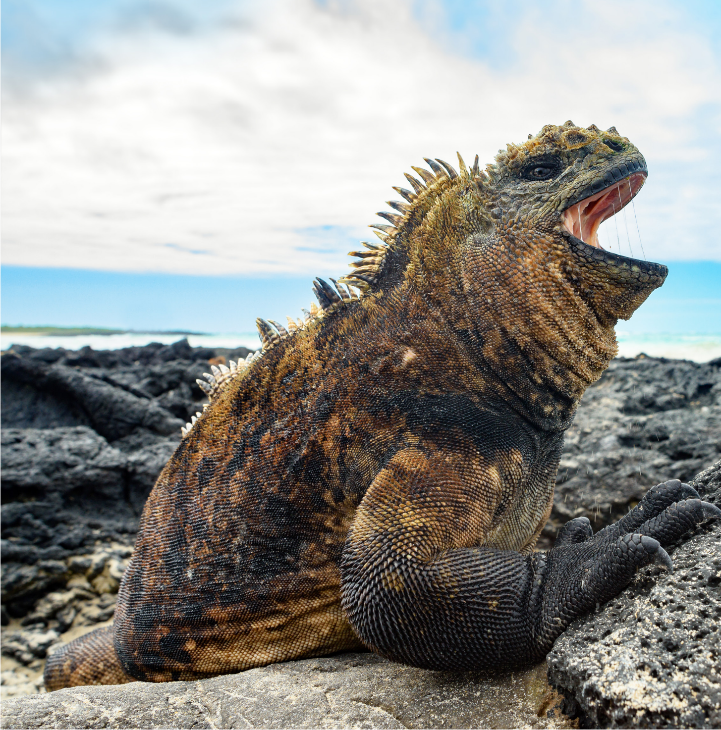
La iguana marina (Amblyrhynchus cristatus), endémica de las islas Galápagos, es el único reptil que basa su dieta en algas marinas.