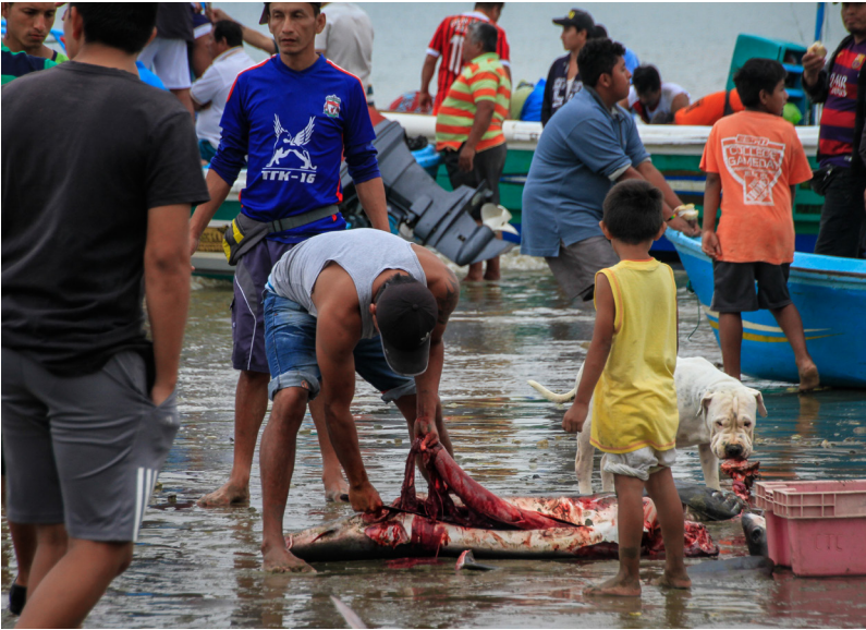
Puerto López es uno de los destinos más turísticos de Ecuador. A pesar de ello, una estampa llamativa y muy clásica se sigue produciendo cada mañana en sus playas, cuando los pescadores desembarcan todo tipo de capturas. Entre ellas, sorprende encontrar especies cuya pesca prohíbe la legislación del país, como son los tiburones.