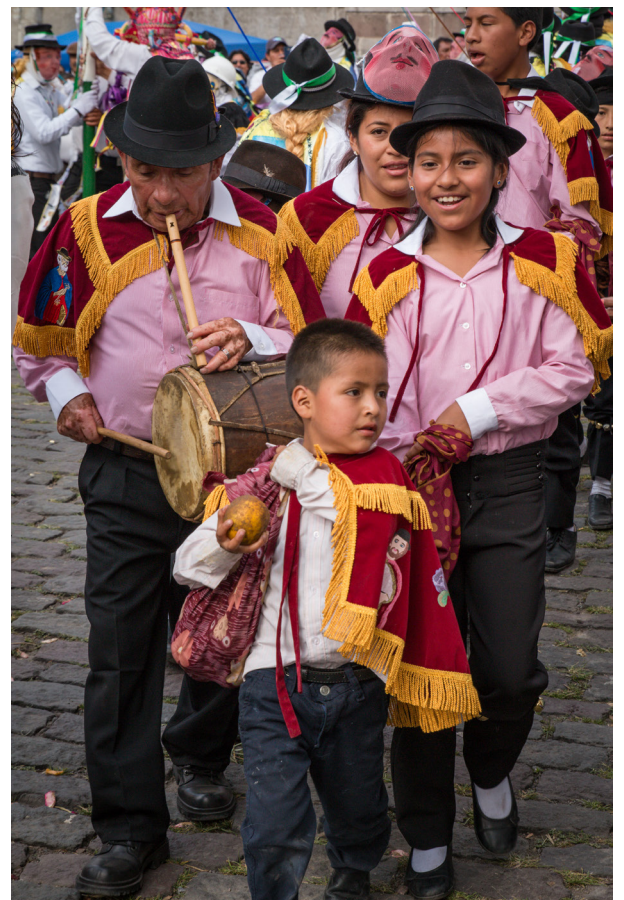
En Ecuador son innumerables las fiestas que muestran su interculturalidad combinando creencias indígenas y mestizas conservadas en la región andina. Este es el caso de la conmemoración religiosa del Corpus Christi y la Llegada del Inti Raymi en honor a Inti, el dios sol.