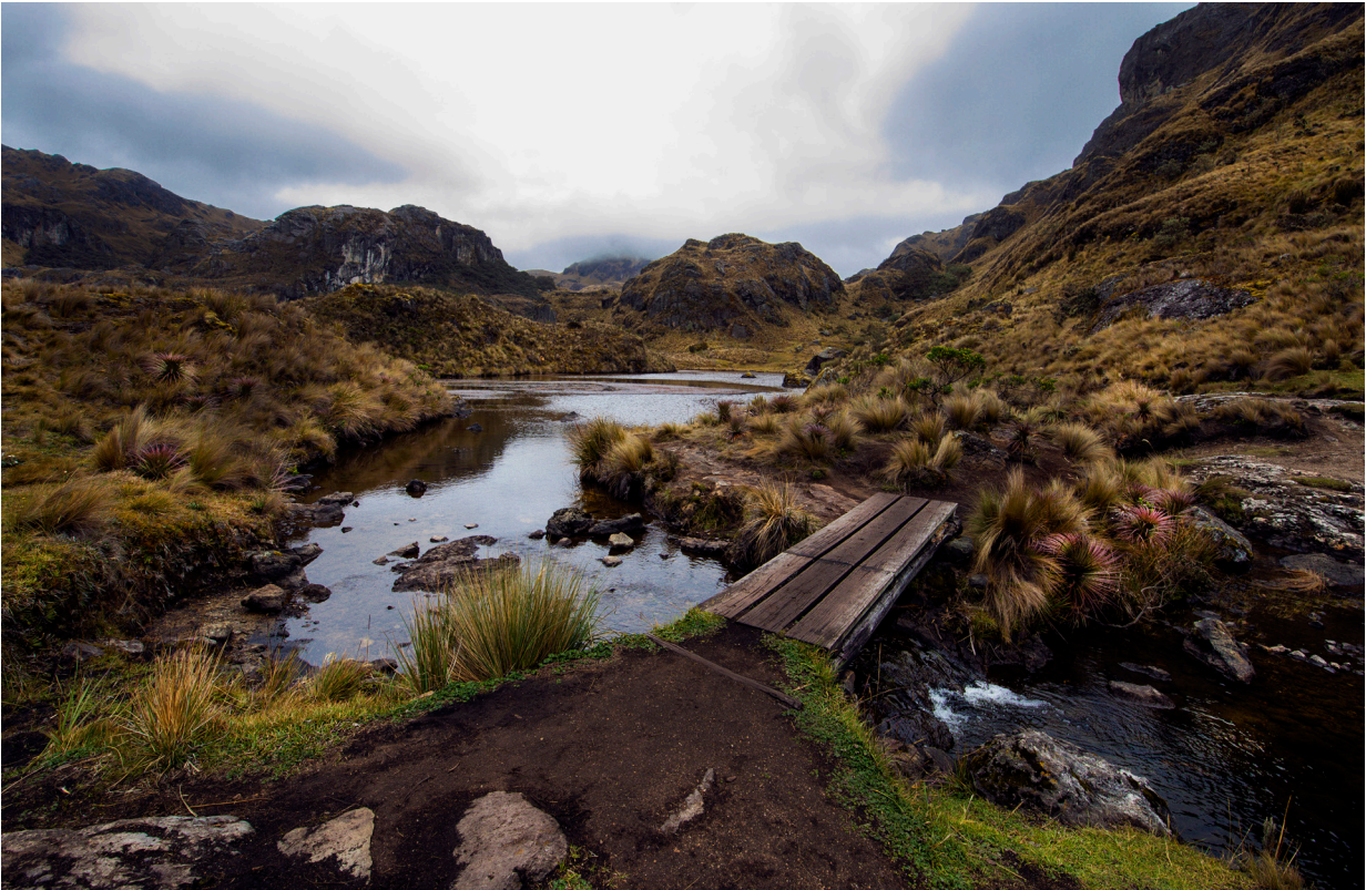
El Parque Nacional Cajas se ubica a gran altitud en la provincia de Azuay, al sur de Ecuador. Se caracteriza por sus extensas y particulares altiplanicies, donde se acumula agua en grandes cantidades –se calculan alrededor de 786 cuerpos de agua.