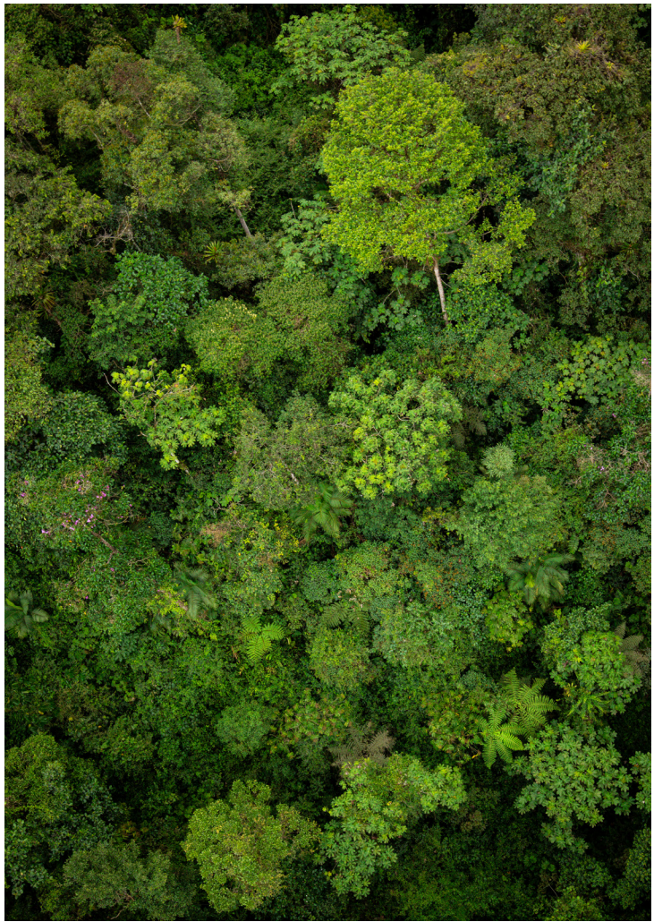
Vista aérea del verde y húmedo bosque nublado de Mindo.