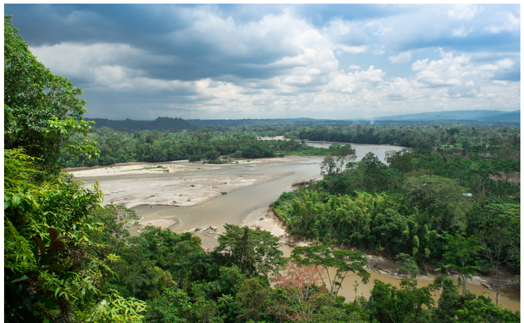
El río Napo nace en los glaciares del volcán Cotopaxi y es uno de los afluentes más importantes del río Amazonas.