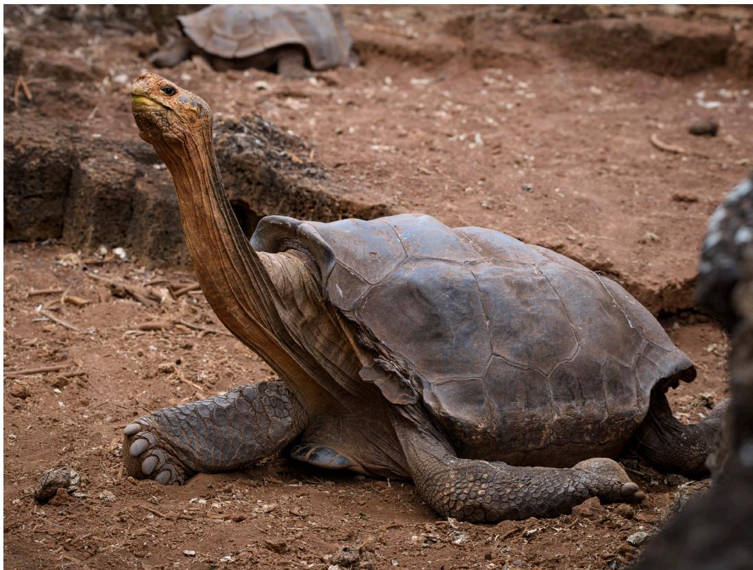
Diego es el macho de tortuga gigante de la Española ( Chelonoidis hoodensis ) que salvó a su especie.