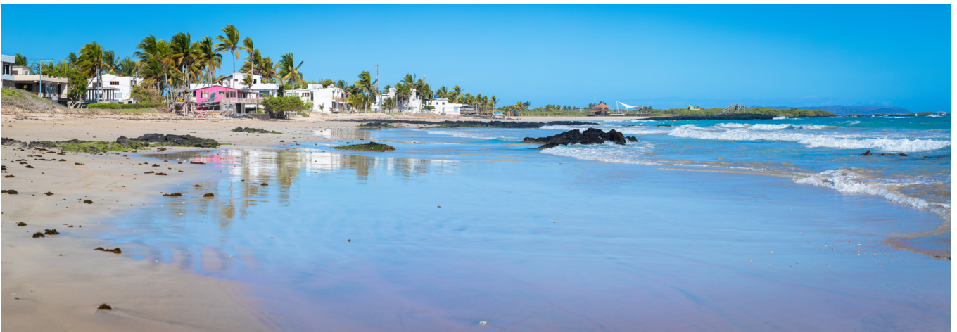
Puerto Villamil es el único núcleo poblacional de la mayor de las islas Galápagos, Isabela. La práctica totalidad de la isla se haya virgen e inaccesible, pero cada metro visitable hace honor al sobrenombre de las Islas Encantadas.