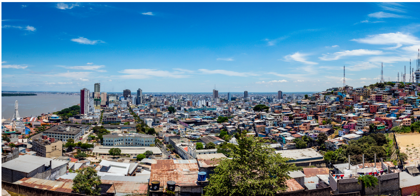
Una panorámica de la ciudad de Guayaquil (la segunda ciudad más poblada de Ecuador) nos muestra su enorme contraste arquitectónico, fiel reflejo de la sociedad ecuatoriana.