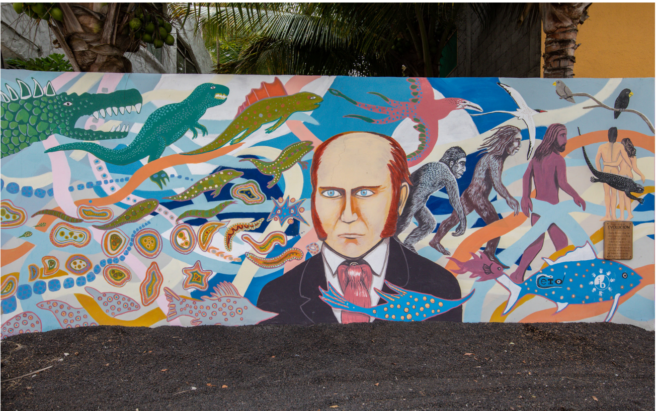
Mural de la evolución, en isla Isabela (Galápagos). Charles Darwin viajó en 1835 a las islas Galápagos, donde, inspirado por la observación de las distintas especies de pinzones e iguanas, desarrolló la teoría de la evolución.