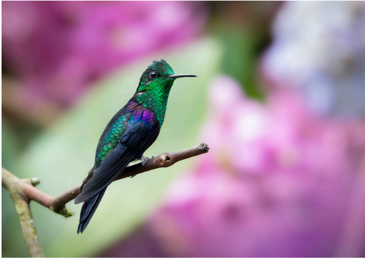
Macho de zafiro coroniverde (Thalurania fannyi), una de las aproximadamente ciento treinta especies de colibrí que habitan en Ecuador.