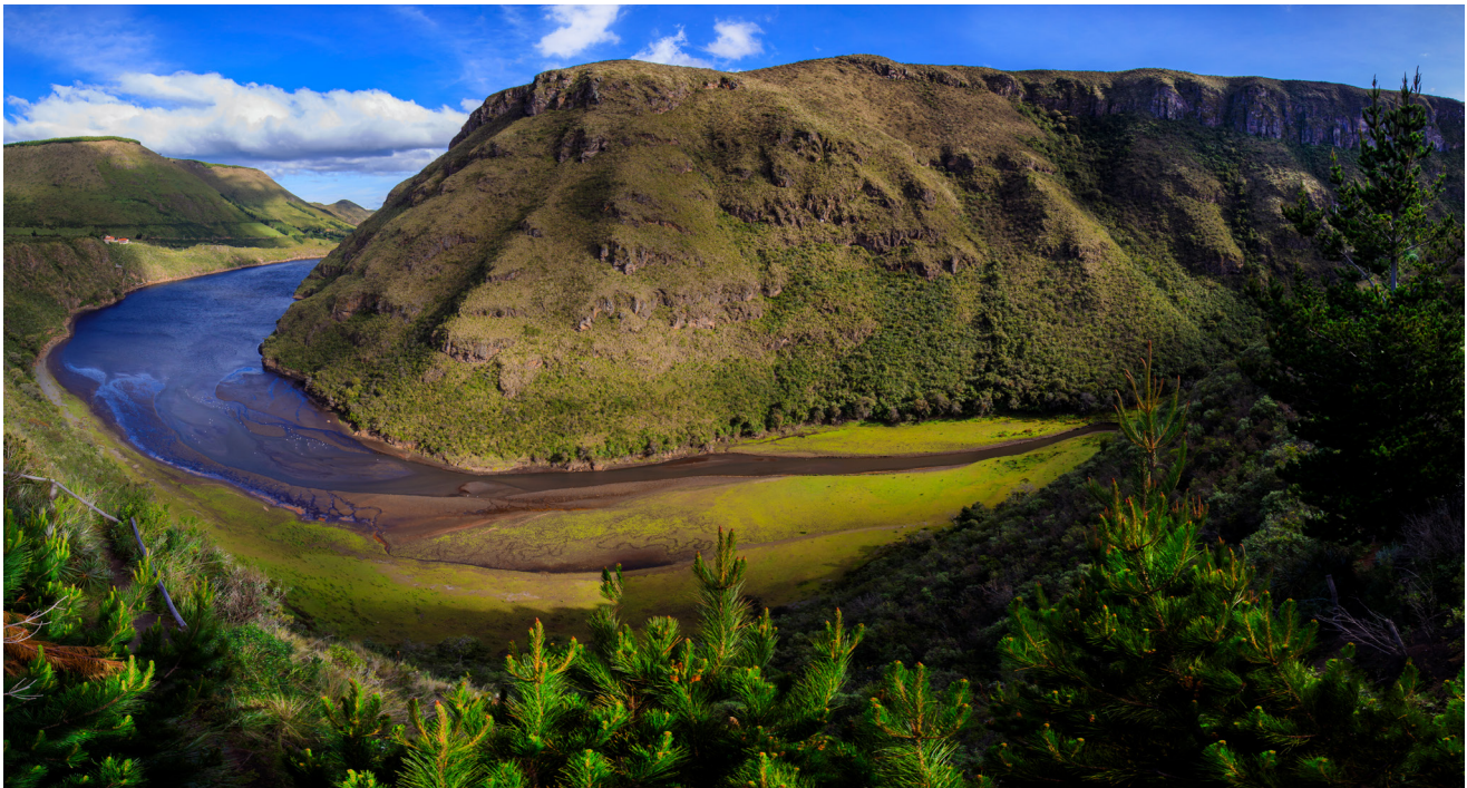
Laguna de Secas es uno de los principales atractivos para los turistas, especialmente para los andinistas y amantes de la naturaleza, pues, además de encontrarse en la ruta hacia la Reserva Ecológica Antisana, a menudo se puede observar el imponente cóndor andino sobrevolando este cañón.