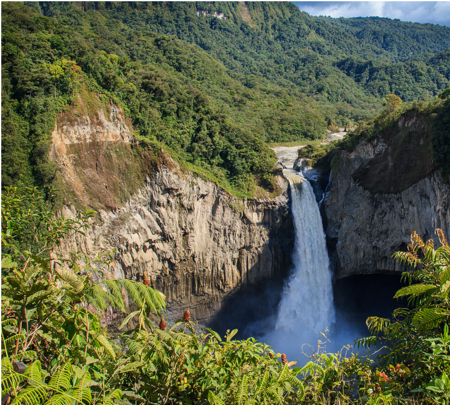
La cascada de San Rafael es la más alta de Ecuador, con casi 150 metros de caída.