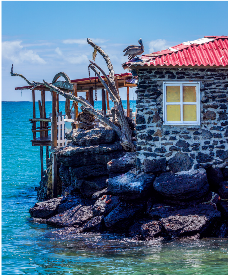
Las islas Galápagos muestran pintorescos rincones, como el que tomó prestado este pelicano pardo.