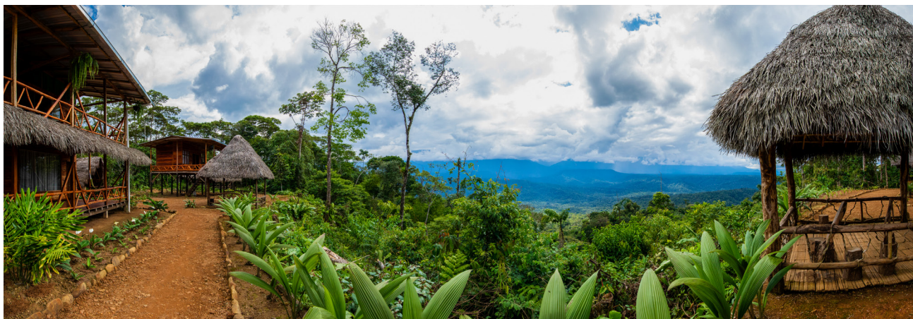
Las construcciones en zonas selváticas de Ecuador se realizan aprovechando los recursos a mano, como las cañas guadúa, madera y hojas de palmera.