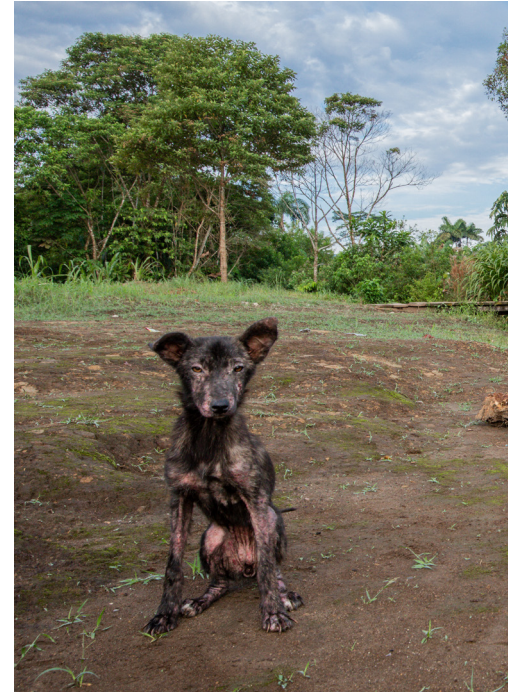
Las comunidades que habitan en el interior de la selva conviven con perros asilvestrados que, aunque son considerados uno más, sobreviven a duras penas a enfermedades e infecciones parasitarias.