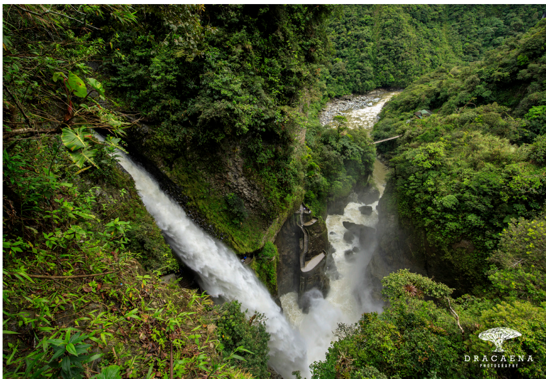
La cascada de río Verde –más conocida como Pailón del Diablo por la forma de las rocas, que aparentan el rostro del demonio– es uno de los destinos favoritos de los turistas.