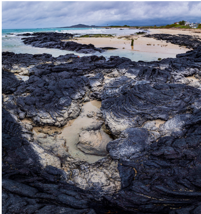
Las frecuentes erupciones de los volcanes de las islas Galápagos tuvieron como consecuencia que la lava alcanzara las costas. Hoy en día, su color negro contrasta con las claras arenas.