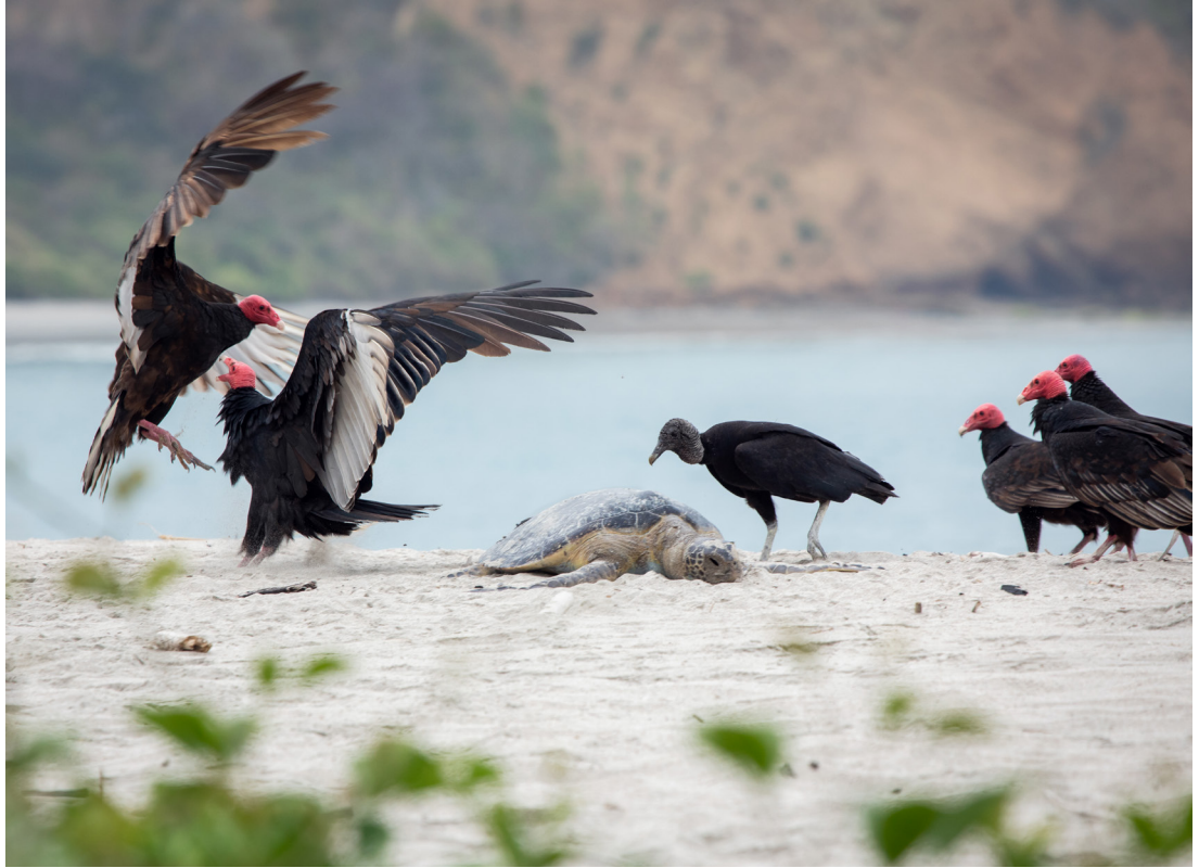
El cadáver de una tortuga marina sirve de festín a zopilotes negros y cabecirrojos en la turística playa de los Frailes, situada en el Parque Nacional Machalilla, de Manabí.