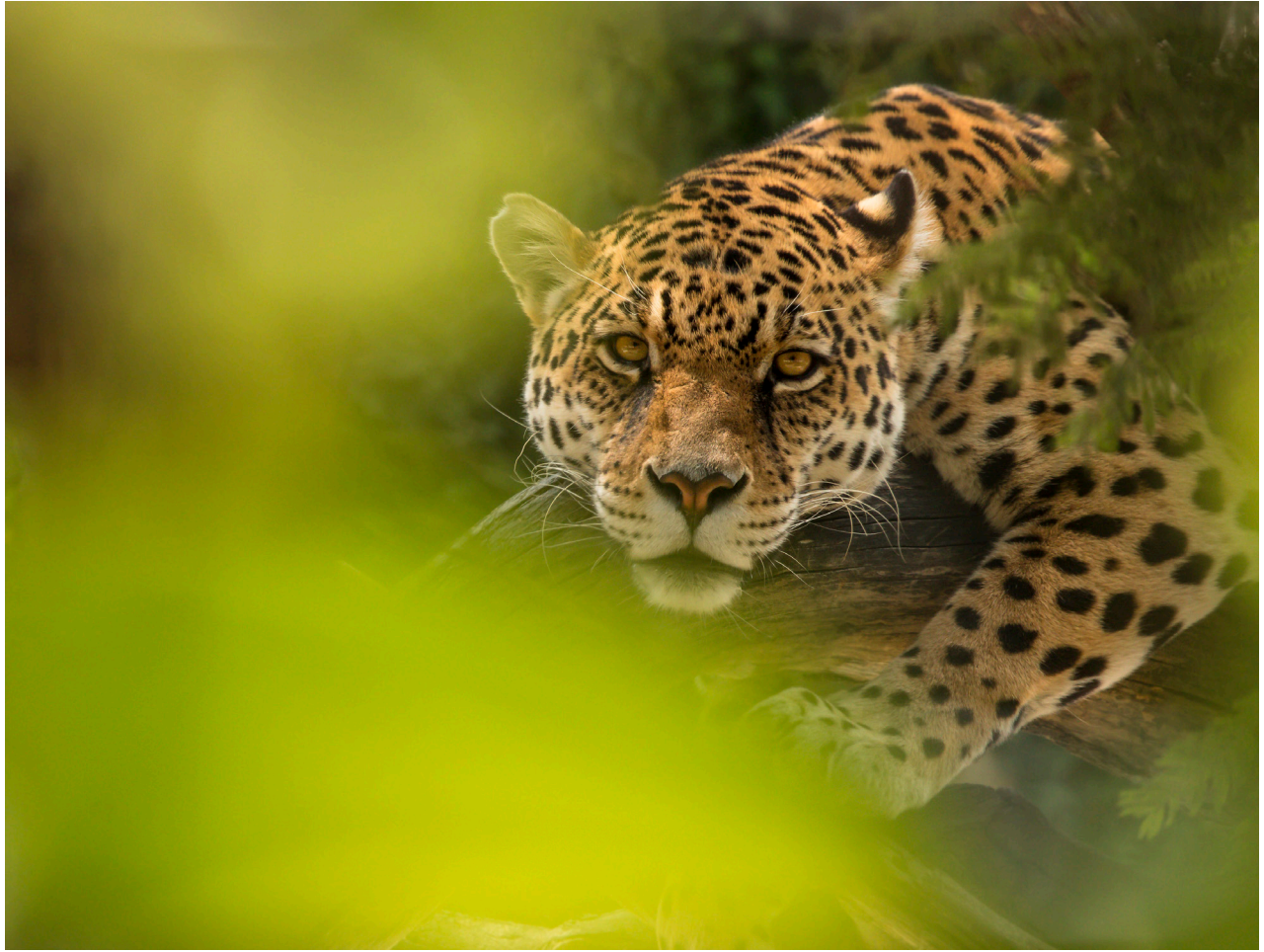
El jaguar (Panthera onca) –uno de los felinos más poderosos del planeta– se encuentra en las selvas de Ecuador.