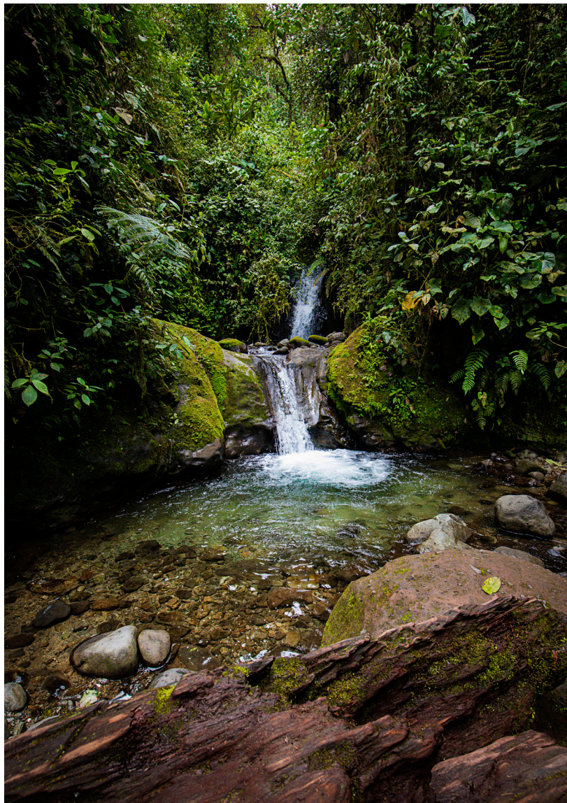
Una de las quince cascadas que se localizan en Mindo a lo largo de la ruta de las cascadas de la Reserva Ecológica Nambillo.