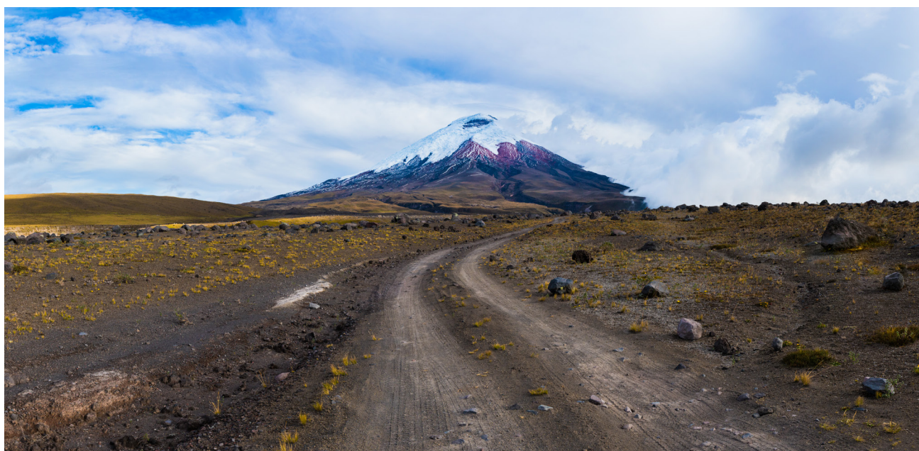
El volcán Cotopaxi es el segundo más alto de Ecuador, con casi 5.900 metros sobre el nivel del mar, y uno de los volcanes activos más altos del mundo. En su última erupción, en 2015, arrojó cenizas y humo, por lo que se declaró «alerta amarilla» en el país.