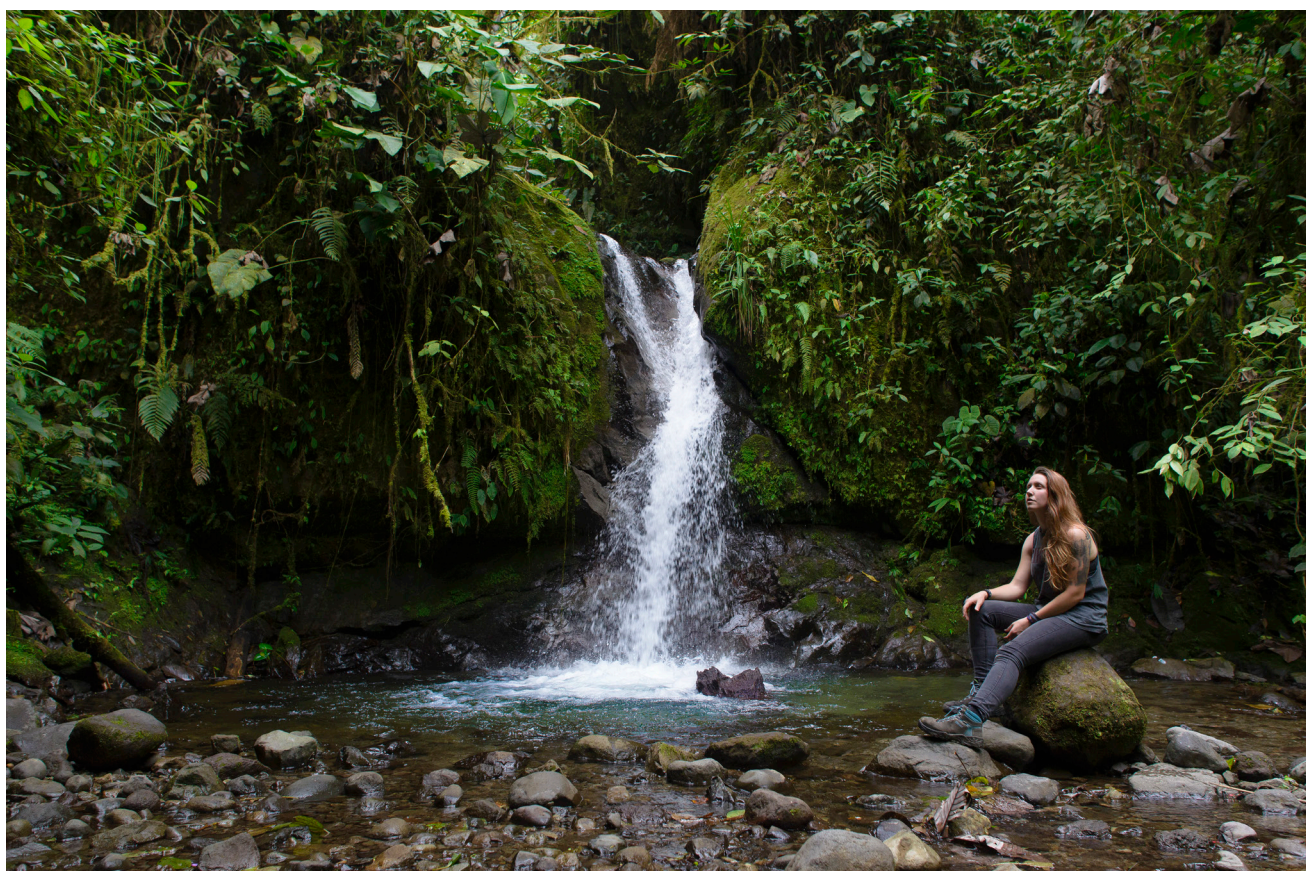
En Mindo se encuentra la Reserva Ecológica Nambillo, donde se pueden contemplar hasta quince cascadas.