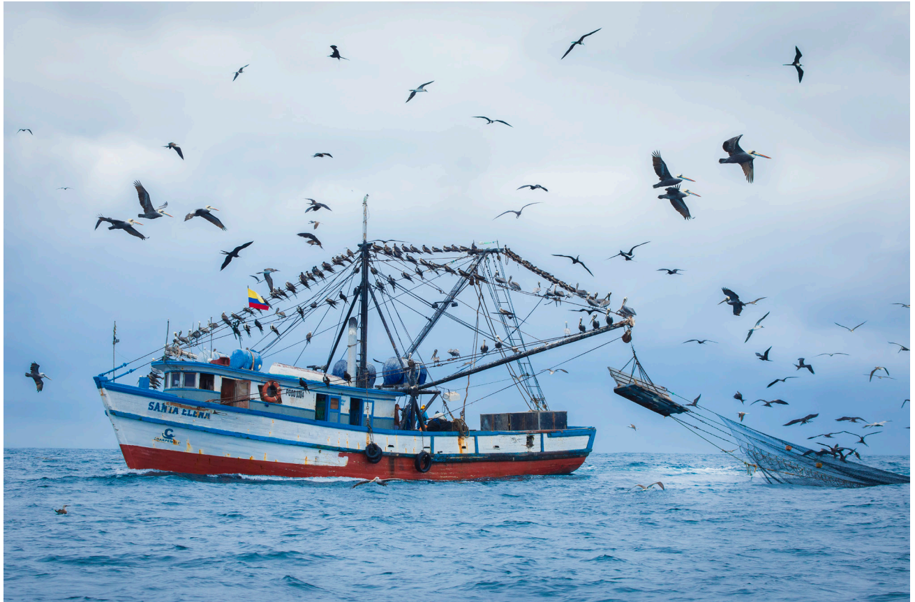
Cientos de pelícanos pardos, Fregatas magnificens y otras aves acuáticas se alimentan de los peces capturados por este barco pesquero en Puerto López.