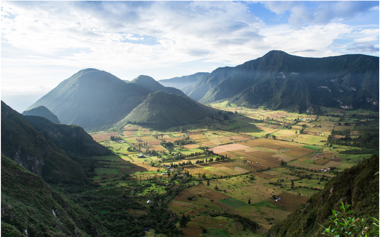
El cráter del Pululahua es de los pocos habitados –probablemente el único– en un volcán activo. Los primeros habitantes se asentaron allí en agradecimiento a su humedad y sus tierras fértiles. Hoy en día, la agricultura y la ganadería siguen siendo el principal medio de vida.