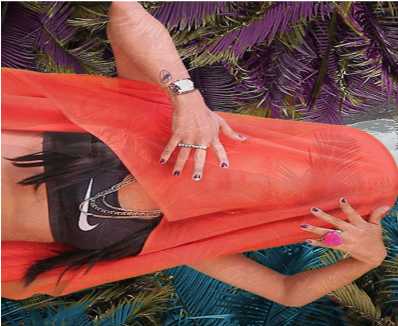
Fotogramas de Echoes of a Tumbling Throne («Odas al fin de los tiempos» #8: COOERPOH A COOERPOH.