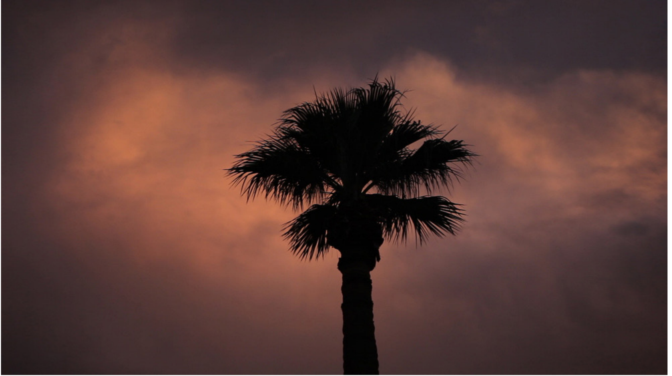
Fotograma de SIN AGUA i. expectation crowned by its own desire.