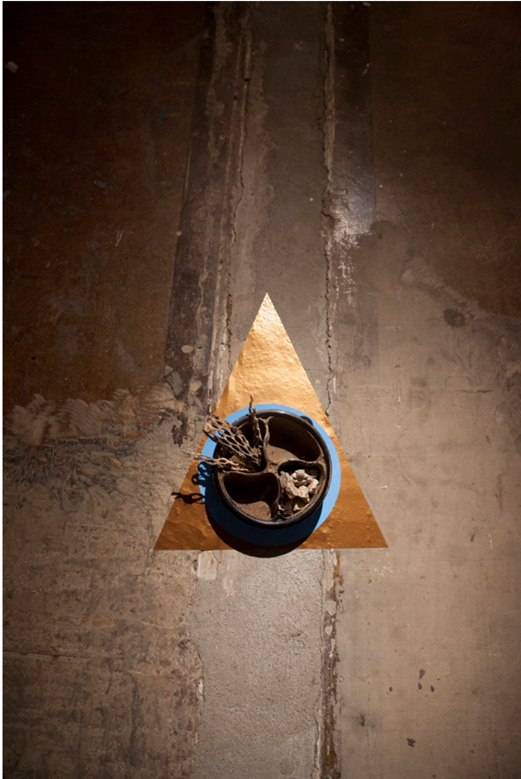
«A Region of Singular Loneliness».