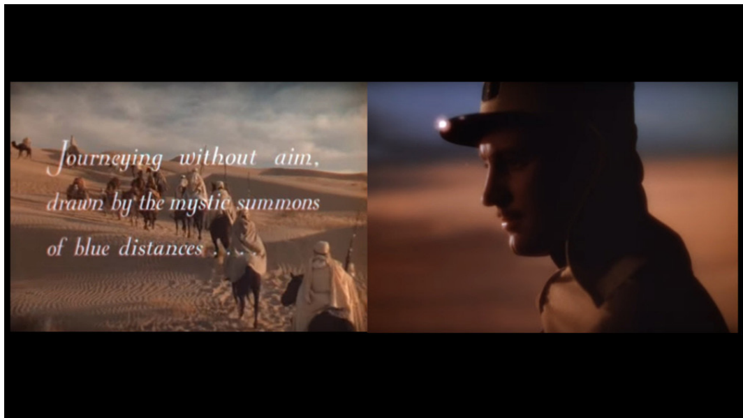
Fotograma de SIN AGUA i. expectation crowned by its own desire.