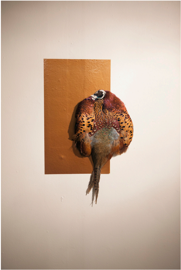
«A Region of Singular Loneliness».