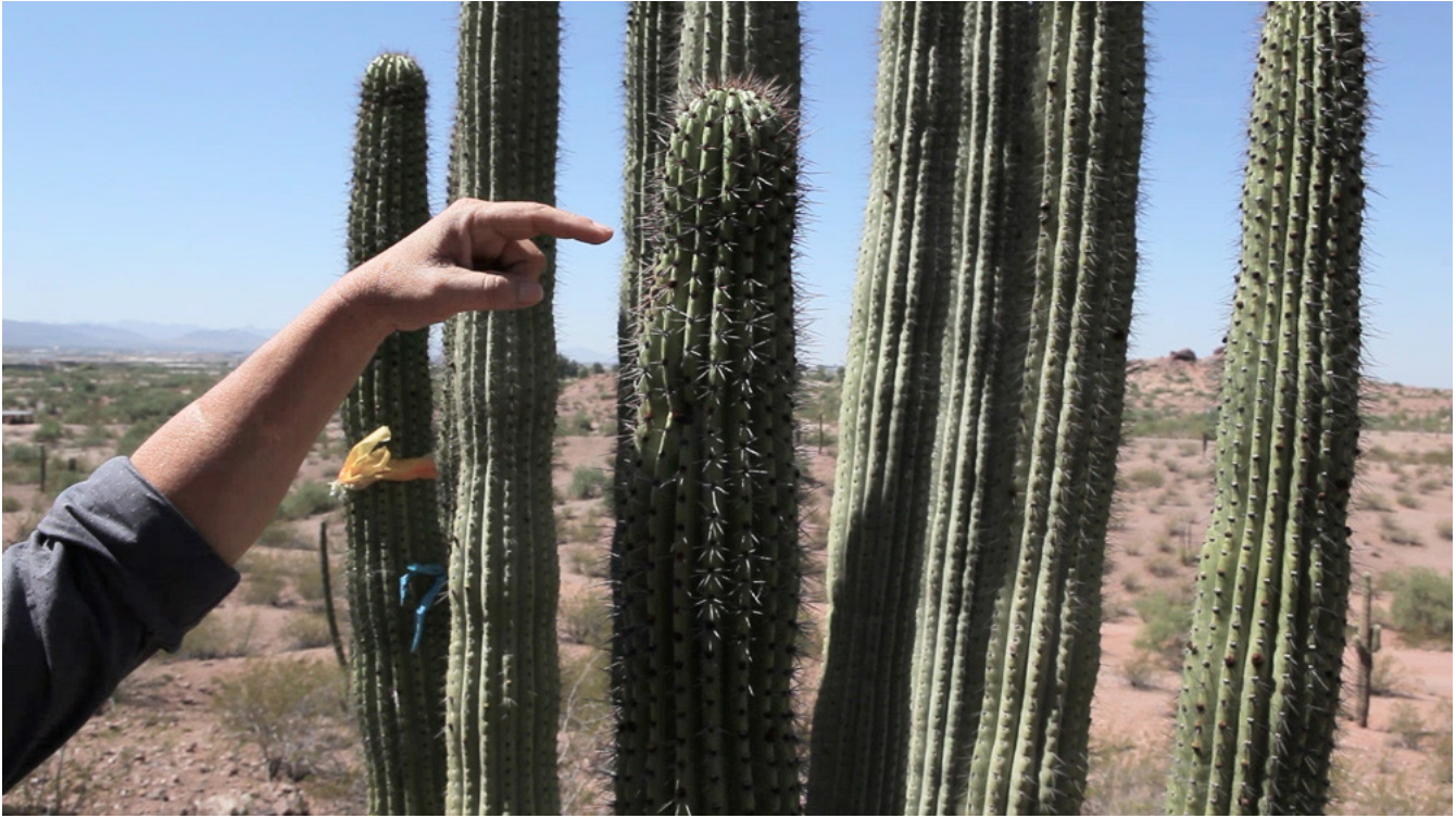
Fotograma de SIN AGUA i. expectation crowned by its own desire.