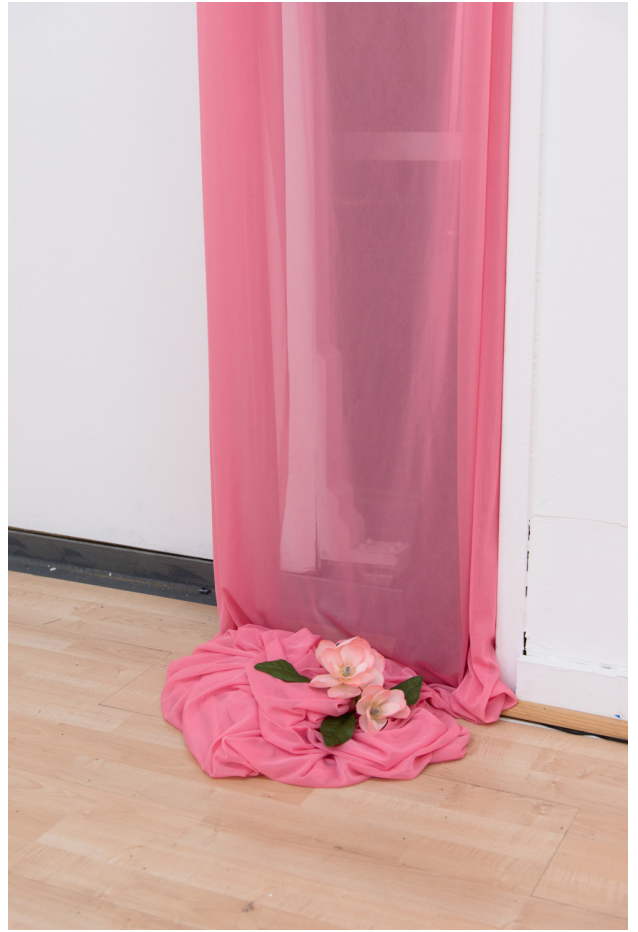
«All That She Wants».