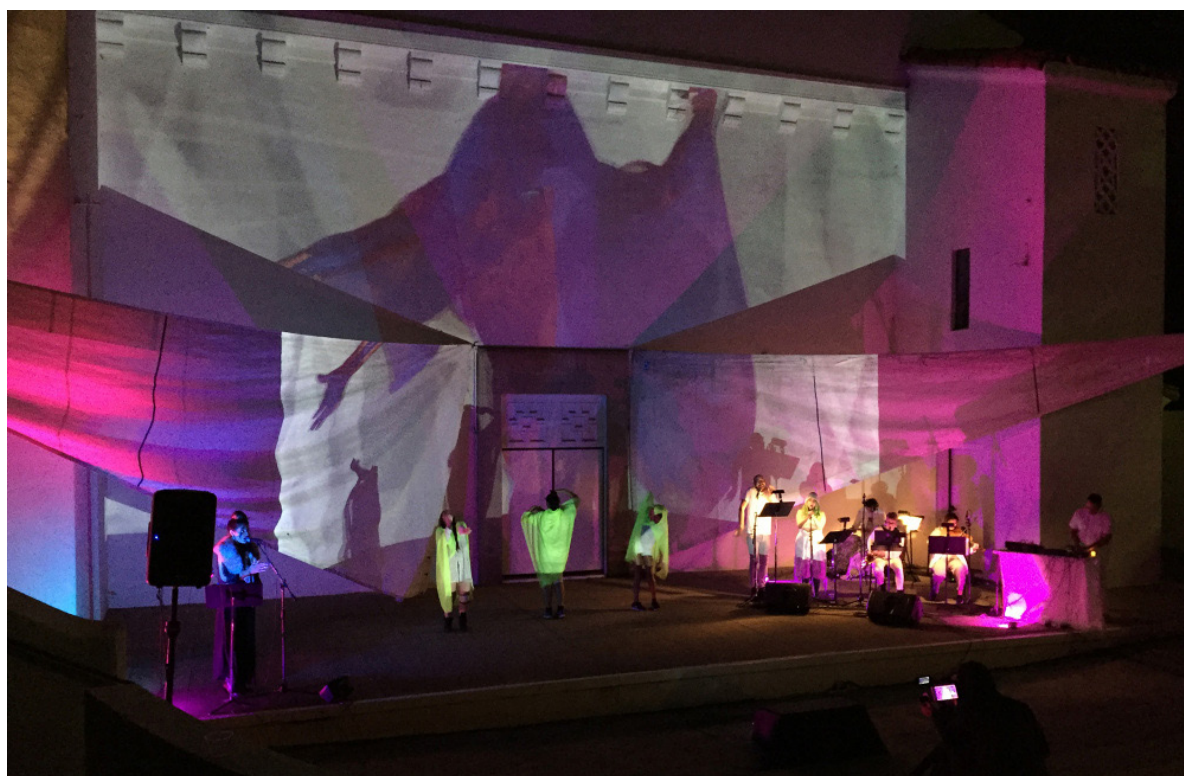
BILONGO LILA: Nobody Dies in a Foretold War.