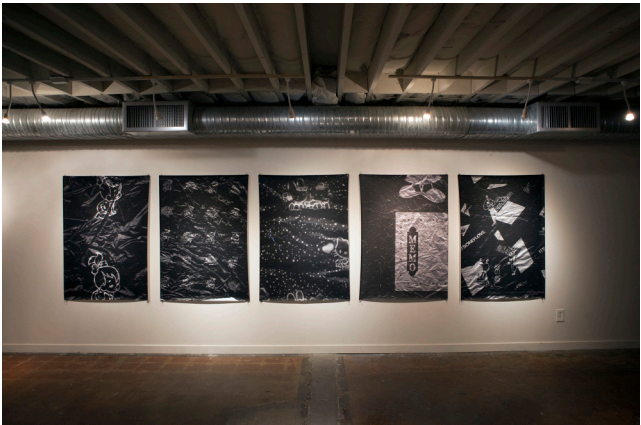
«A Region of Singular Loneliness».