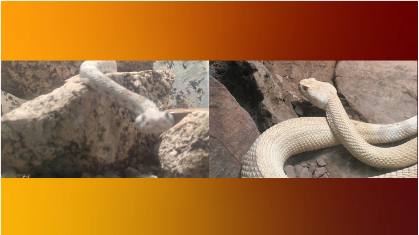
Fotograma de SIN AGUA i. expectation crowned by its own desire.