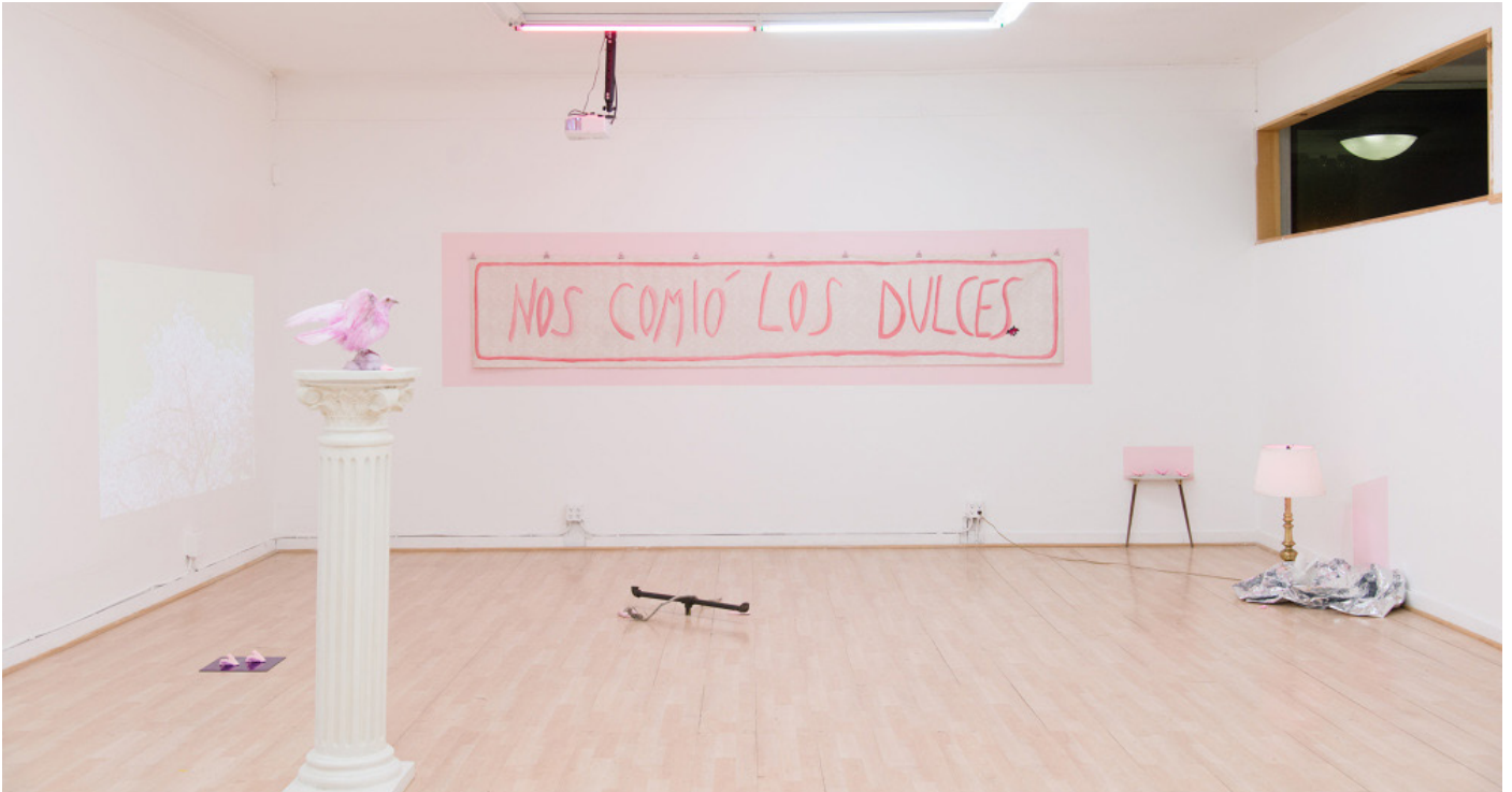
Foto de exhibición The Gentle Voice that Talks to You Won't Talk Forever.