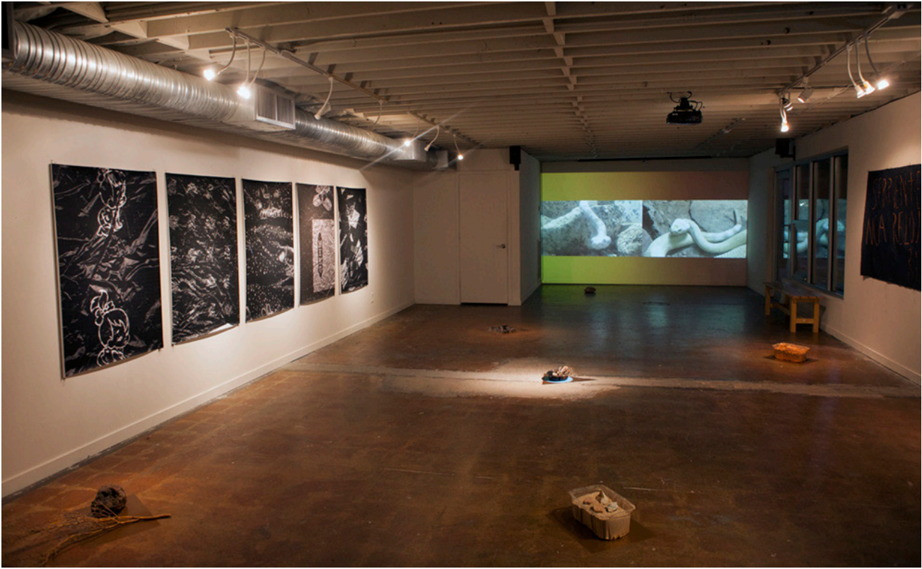
Foto de exhibición Where Thieves Go After Death.