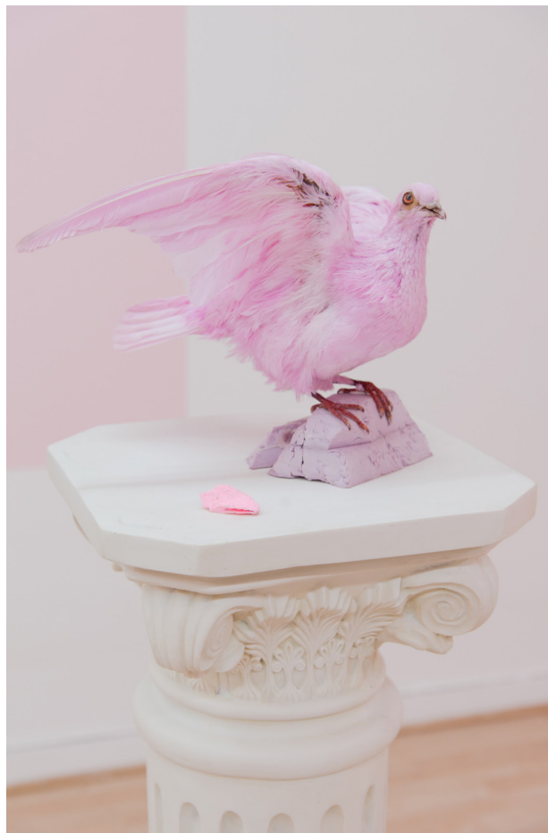
«Dame la mano, paloma, para subir a tu nido».