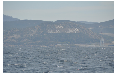
Panorámica de Marruecos.