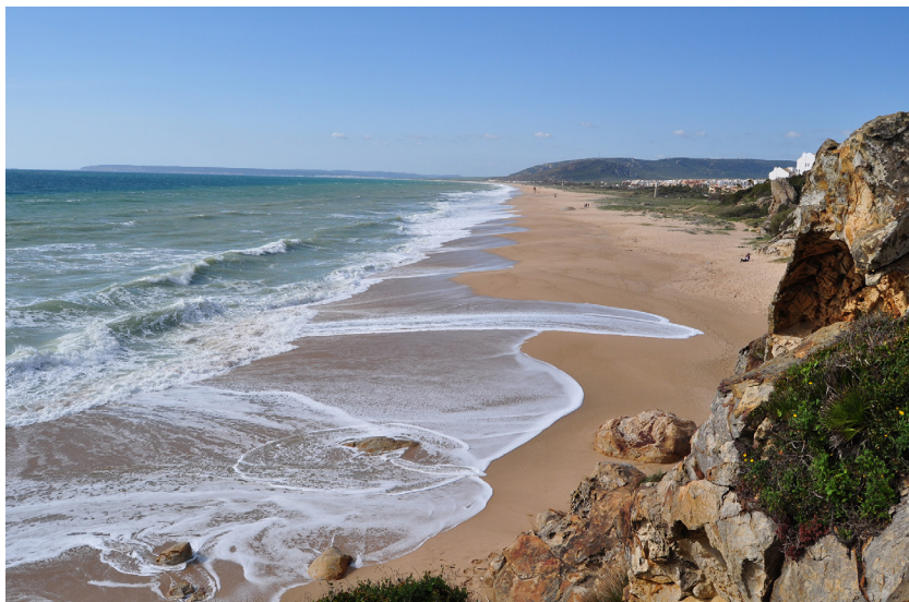
Playa de Atlanterra, Zahara de los Atunes.