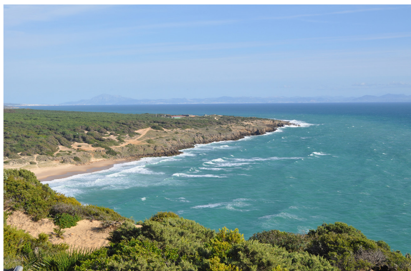
Playa de Camarinal, Zahara de los Atunes.