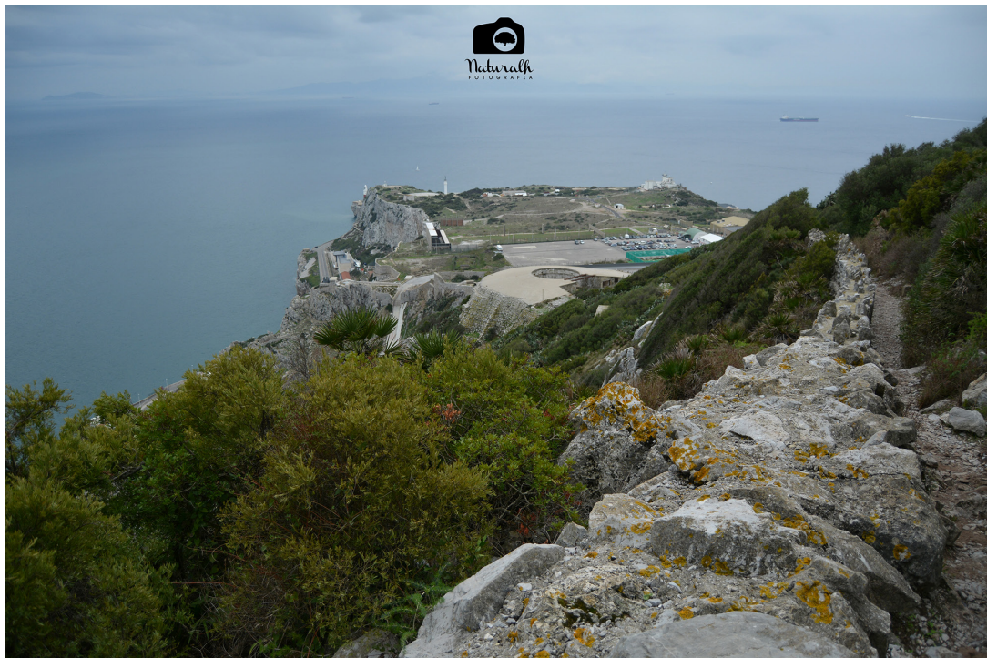
Peñón de Gibraltar.