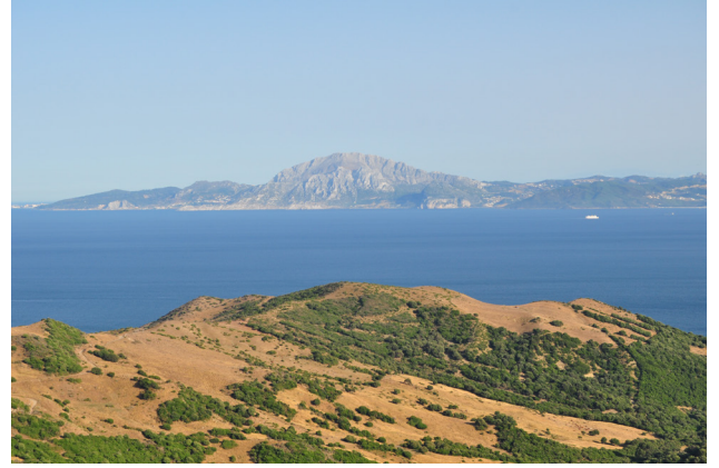
Mirador del Estrecho, Algeciras.