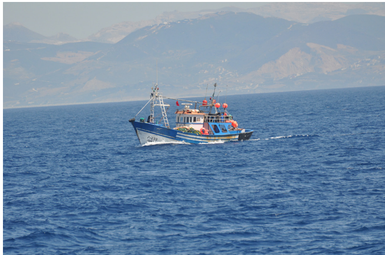
Pesqueros marroquíes en aguas del Estrecho.