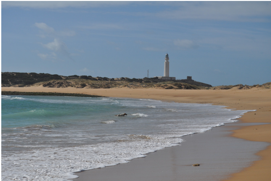
Atardecer en Trafalgar.