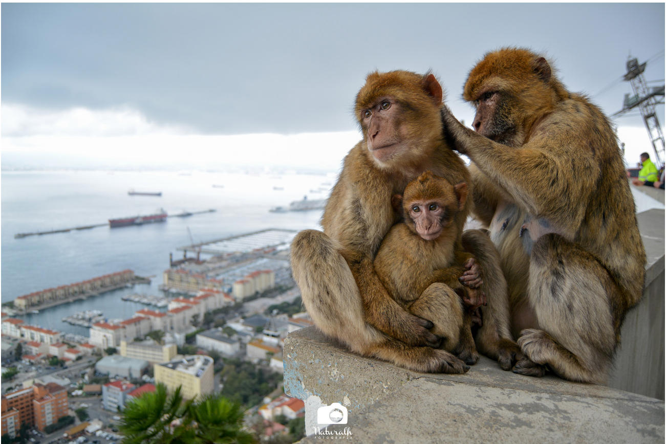
Imágenes de monos de Berbería de Gibraltar.