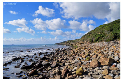
La costa del Estrecho de Gibraltar.