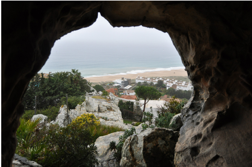
Cueva de las Orcas Atlanterra, Zahara de los Atunes.