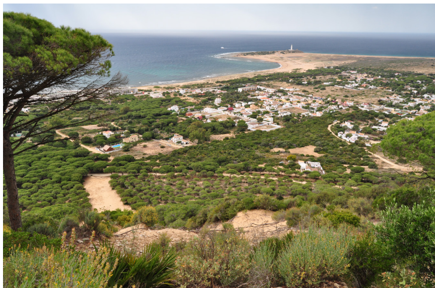
Caños de Meca y tómbolo de Trafalgar.