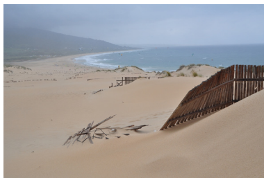
Punta Paloma, Tarifa.