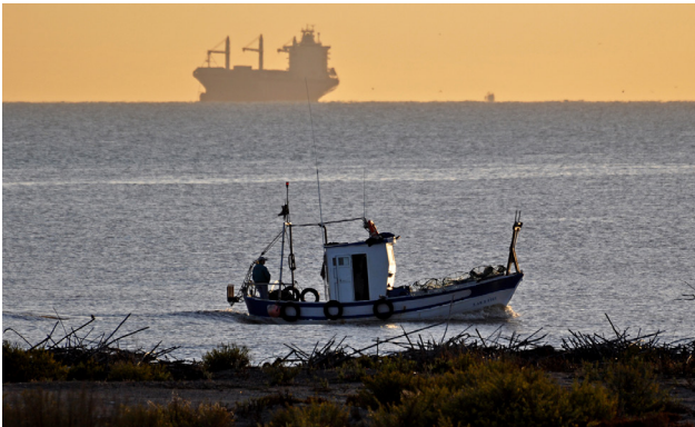
Compañeros del mar.