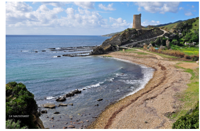
Panorámica de la playa de Guadalmesí, Tarifa.