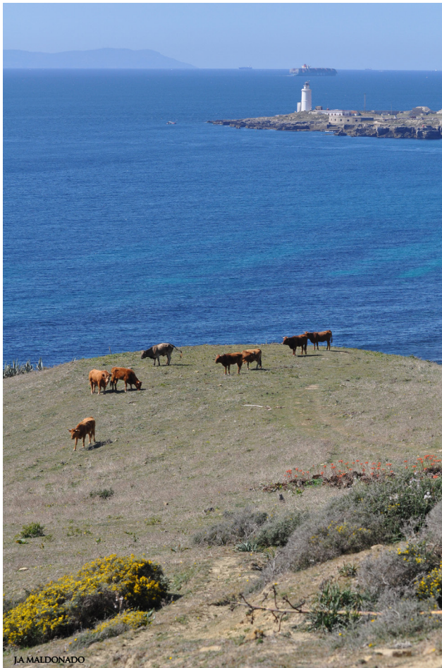
La Isla de Tarifa.