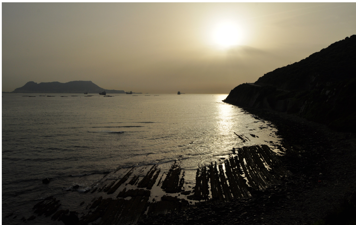
Bahía de Algeciras.

José Antonio Maldonado Moreno nace en 1987 en Alhaurín el Grande (Málaga) y desde pequeño vive rodeado de la naturaleza, circunstancia que lo lleva a formarse como Técnico de Medio Ambiente, para más tarde descubrir su otra pasión: la Fotografía. Autodidacta desde sus inicios, va descubriendo la naturaleza y admirando la vida en todas sus formas y manifestaciones, para poco a poco dejarse llevar por otros ámbitos fotográficos como el paisaje, la sociedad, los viajes, o la fotografía nocturna. Ha sido galardonado con: 2º Premio del Concurso Fotográfico GDR Huerta Guadalhorce 2012, 3º Premio del Concurso Fotográfico de Naturaleza Doñana 2013, Finalista del Concurso Nacional de Fotografía sobre el Lobo Ibérico 2014 (Ecologistas en Acción), 2º Premio del Concurso Fotográfico I Feria Internacional Ornitológica de Doñana "Doñana Birdfair" 2014 y accésit en el I Concurso Fotográfico Africa (Pacto por África) 2015 Sevilla. Ha colaborado en la Agencia Nature Age (Fotografía Natural), el diario ABC, la Revista Aramba (Asociación ambiental), revista Esfera Magazine , revista Keal Magazine y de la revista La Alcándara de la asociación AECCA (Asociación Española de Cetrería y Conservación de Aves Rapaces). Hoy en día combina su trabajo de guía de naturaleza por toda Andalucía con su nuevo proyecto fotográfico Naturalh Fotografía con el que pretende hacer de su pasión su oficio.).