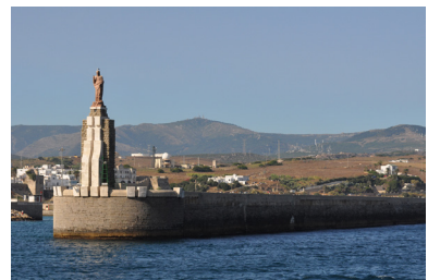
Tarifa desde el mar.