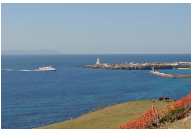
Puerto de la Isla de Tarifa.