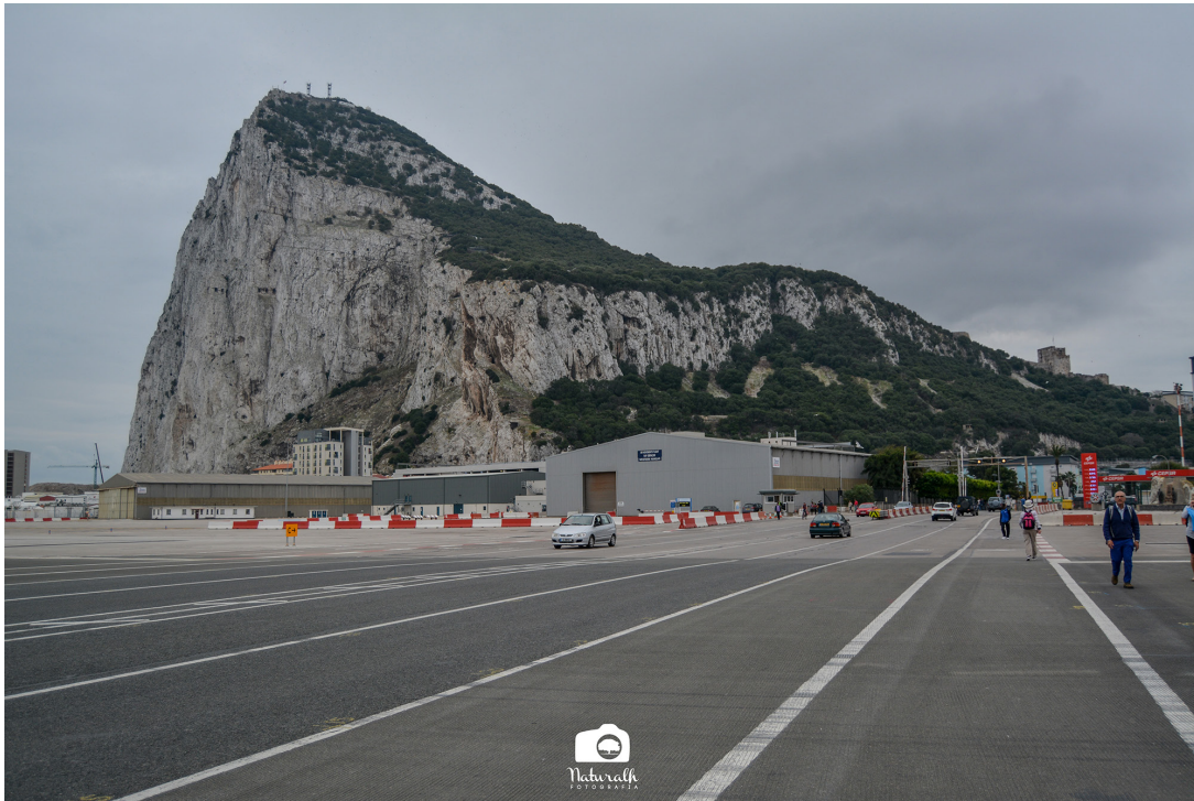
Peñón de Gibraltar desde la Línea de la Concepción.