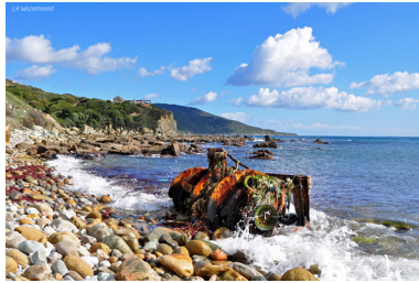
Restos en playa de Guadalmesí, Tarifa.