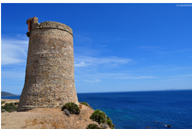
Torre Guadalmes, Tarifa.