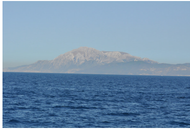
Costa de Marruecos.