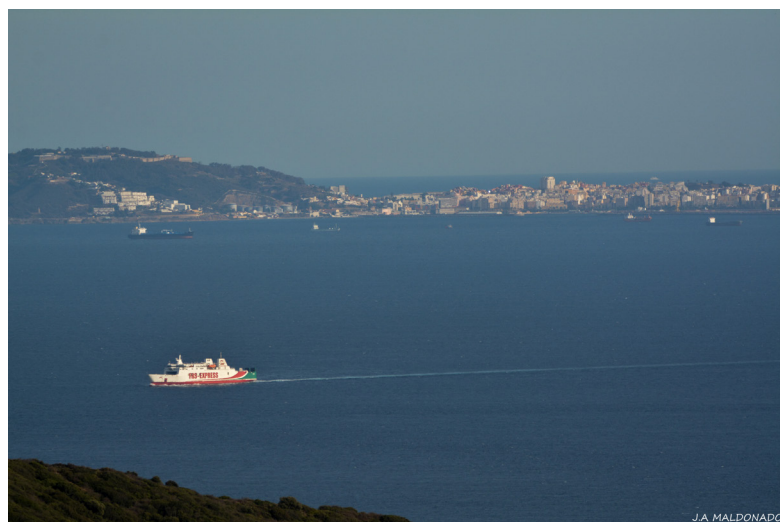
Estrecho de Gibraltar con Ceuta al fondo.