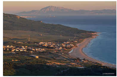
Vista del Estrecho de Gibraltar desde el Cerro del Moro, Tarifa.