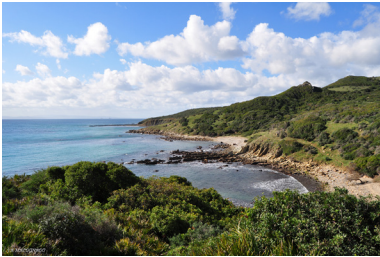
Costa de Tarifa.