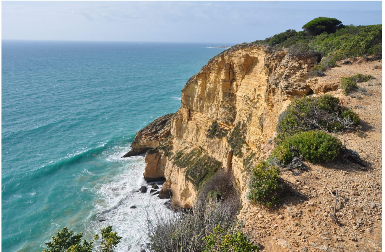
Imágenes de los acantilados de Barbate.