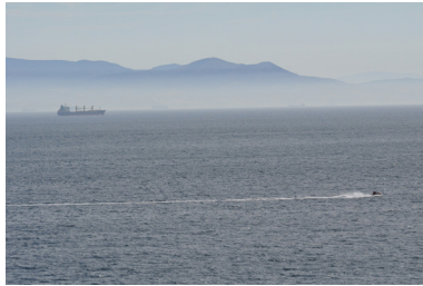
Costa de Tarifa con Marruecos al fondo.