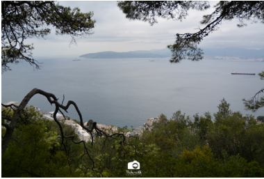
Bahía de Algeciras desde el Peñón.