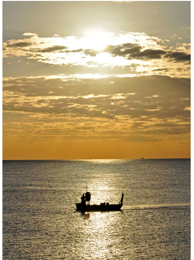
Camino a la luz.