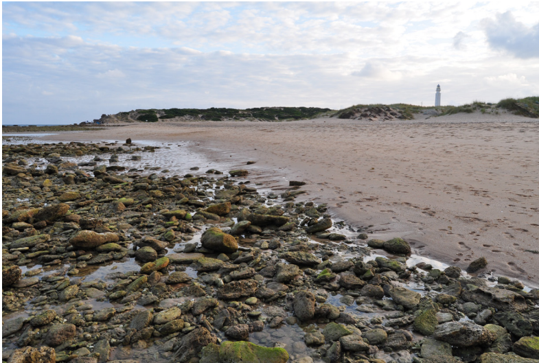
Panorámica de la Bahía de Trafalgar.