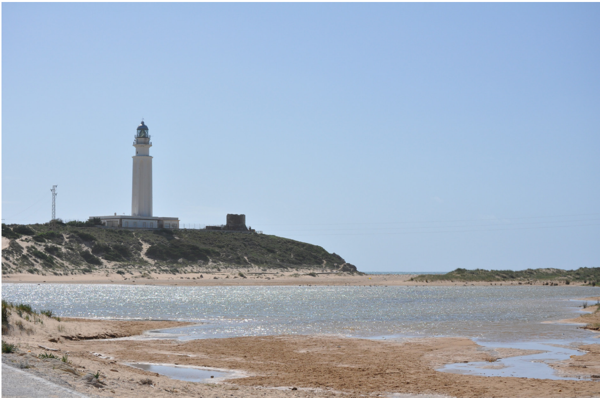
Imágenes de la bahía de Trafalgar.