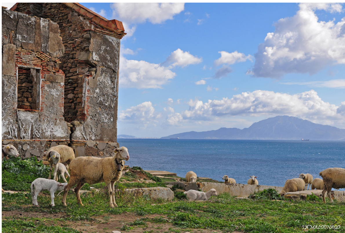
La costa de Tarifa con Marruecos al fondo.