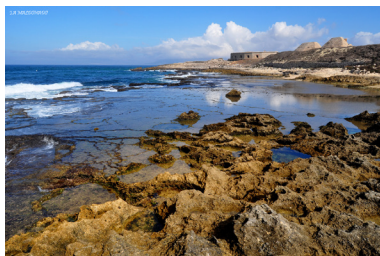
La Isla de Tarifa.