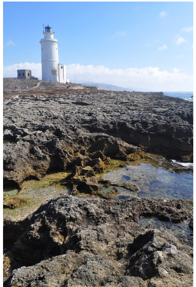
Faro de Tarifa.