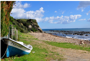
Playa de Guadalmesí, Tarifa.