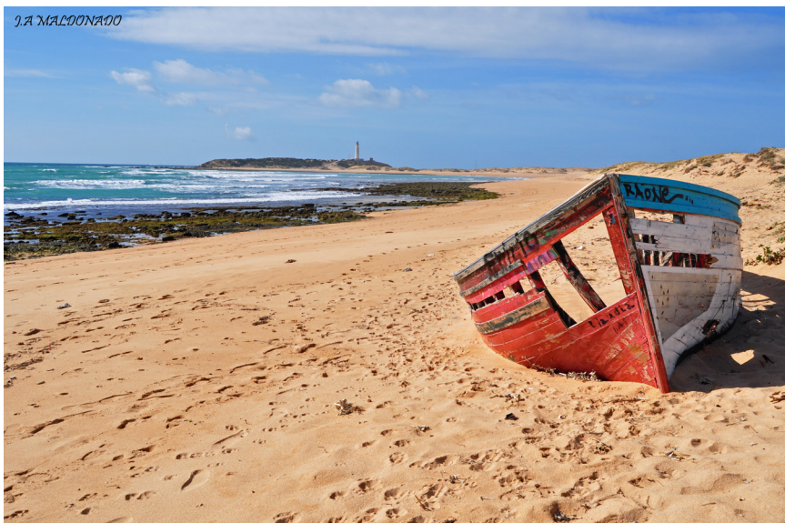
Embarcación varada en la Bahía de Trafalgar.