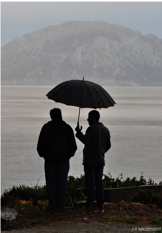
Vista desde Algeciras.