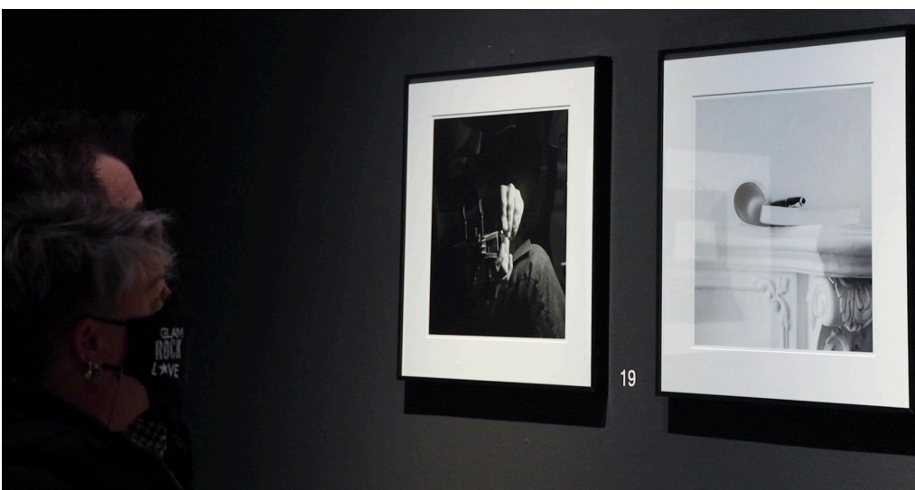
De izquierda a derecha, imágenes asociadas a los conceptos «experiencia y escribir».