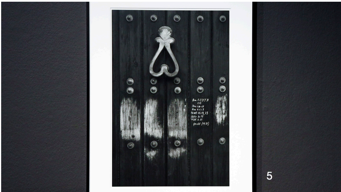
Detalle de la imagen asociada al concepto «iniciación».