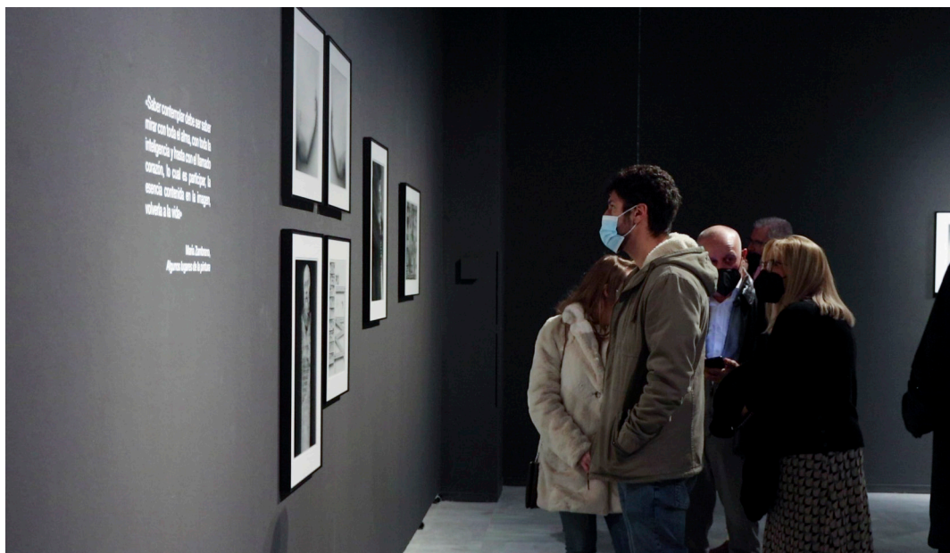
Visitantes viendo la exposición.