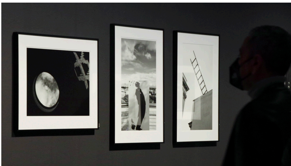
De izquierda a derecha, imágenes asociadas a los conceptos «divino, delirio y ensoñar».