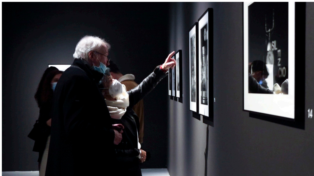
Visitantes recorriendo la exposición.