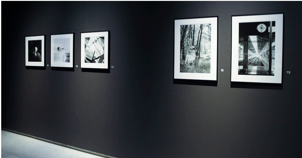
De izquierda a derecha, imágenes asociadas a los conceptos «experiencia, escribir, amistad, alma y tiempo».