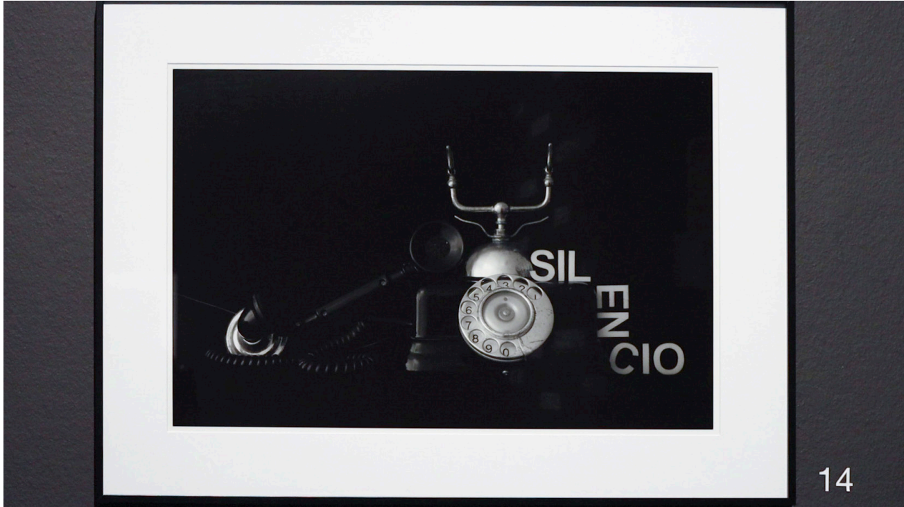
Imagen asociada al concepto «silencio».

que cubría las paredes de la sala. Así, dos de ellas estaban llenas de palabras como vida, belleza, soñar, corazón, exiliado, memoria, nacer, delirio, escribir, amistad, silencio, entre otras muchas más que se identificaban con cada fotografía de la exposición.