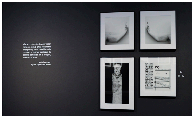
Imágenes superiores asociadas al concepto «arte» e imágenes inferiores, de izquierda a derecha, asociadas a los conceptos «filosofía y poesía».