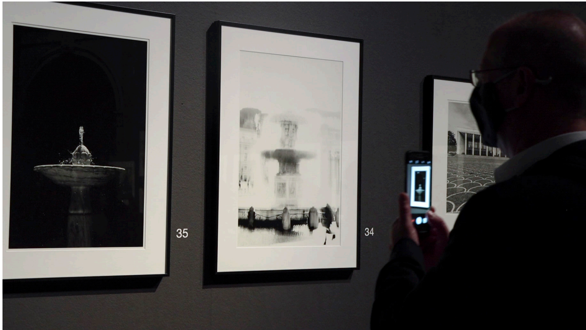
De izquierda a derecha, imágenes asociadas a los conceptos «vida, luz y democracia».