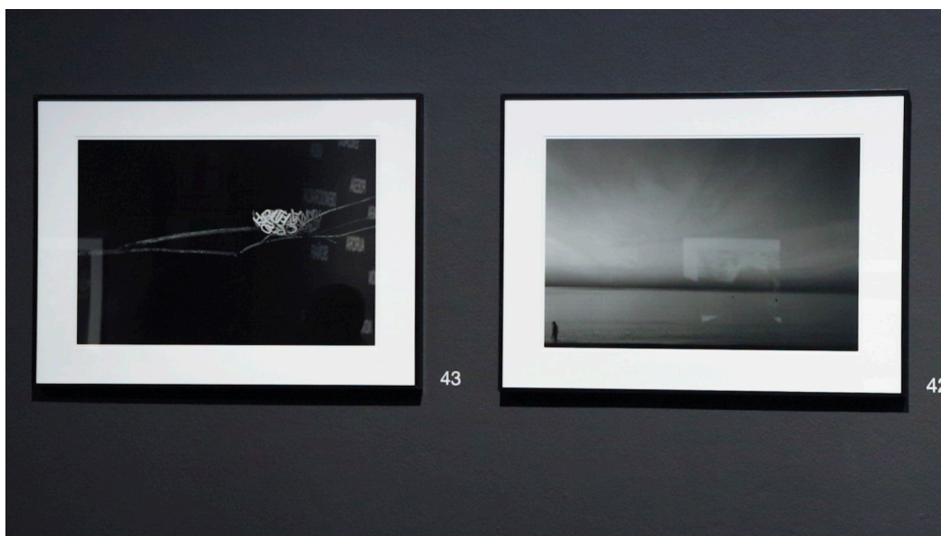
De izquierda a derecha, imágenes asociadas a los conceptos «nacer y aurora».

de María Zambrano con la que se define perfectamente el objetivo de esta exposición: «Porque solamente siendo a la vez pensamiento, imagen, ritmo y silencio parece que puede recuperar la palabra su inocencia perdida, y ser entonces pura acción, palabra creadora».