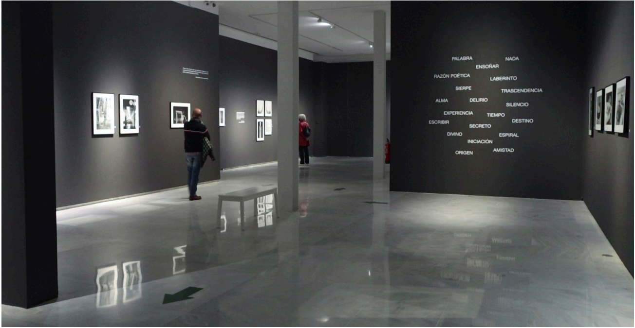
Vista general de la exposición María Zambrano. Mirar la palabra, pensar la imagen.

En el año en que se cumplió el treinta aniversario del fallecimiento de la pensadora, se abrió otra vía de acceso a la aportación del conocimiento de Zambrano a través de una muestra en la que se conjugaron palabra e imagen, las cuales fueron las protagonistas en el fondo de color oscuro