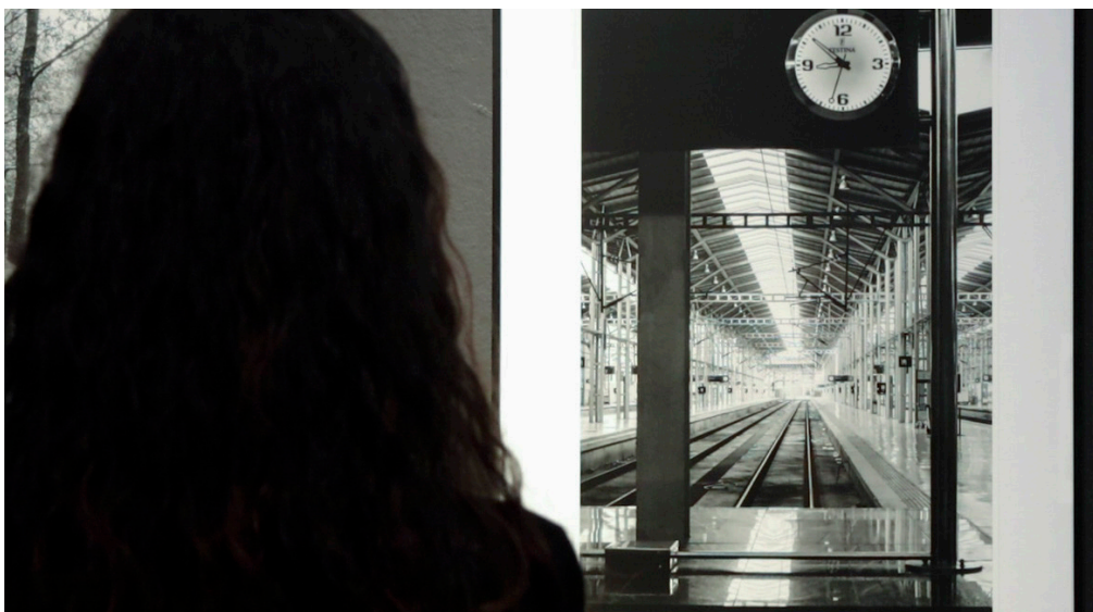
Detalle de la imagen asociada al concepto «tiempo».