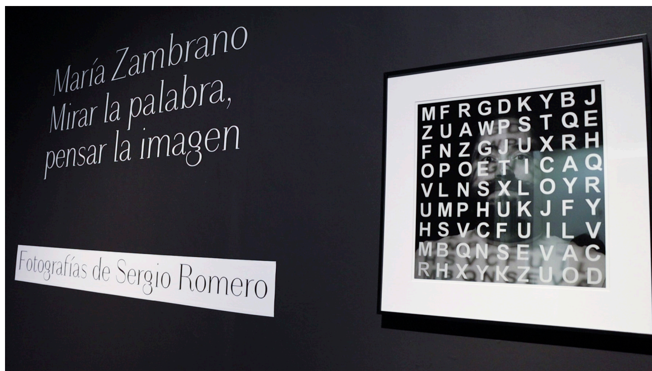
Entrada a la exposición María Zambrano. Mirar la palabra, pensar la imagen.