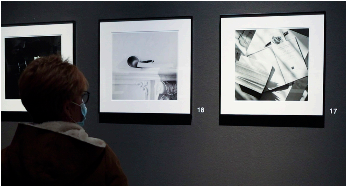
De izquierda a derecha, imágenes asociadas a los conceptos «escribir y amistad».