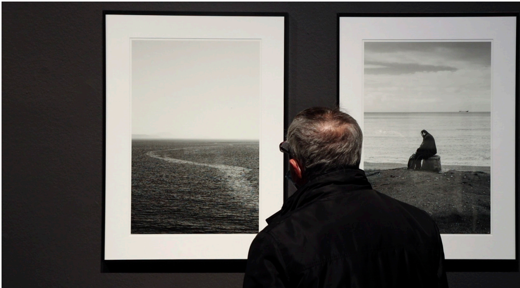
De izquierda a derecha, imágenes asociadas a los conceptos «horizonte y exiliado».