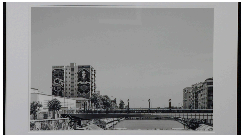
Detalle de la imagen asociada al concepto «puente».