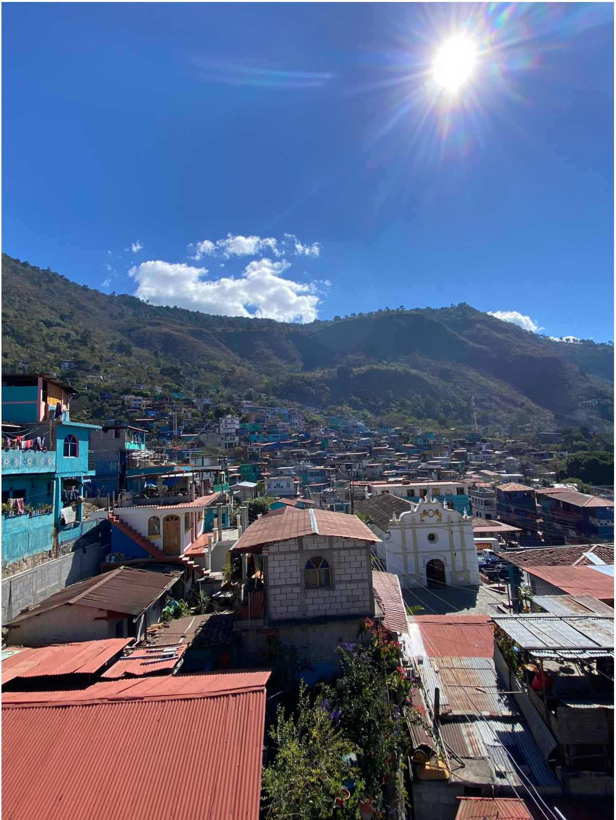
Santa Catarina Palopó se asienta en las orillas del lago Atitlán.