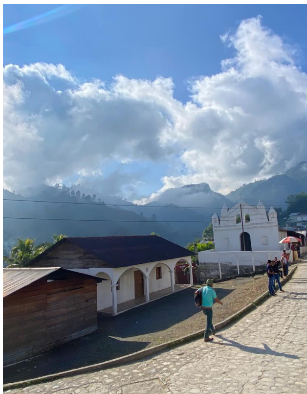
Una de las calles de Lanquín, en el departamento de Alta Verapaz.