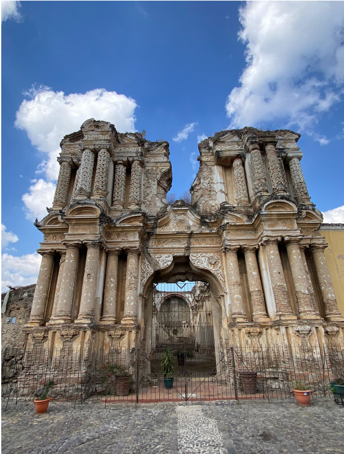
Ruinas de una iglesia en Antigua (Sacatepéquez). Esta ciudad rodeada de volcanes en su día fue la capital de Guatemala. Fue declarada patrimonio de la humanidad por la Unesco y es una de las ciudades coloniales más bonitas y mejor conservadas de América. Está llena de iglesias en ruinas, a causa de distintos terremotos. La llegaron a llamar «Arruinada Guatemala».