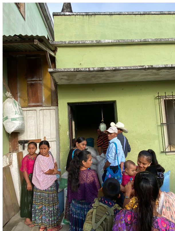
Personas esperando para comprar maíz en Lanquín (Alta Verapaz).