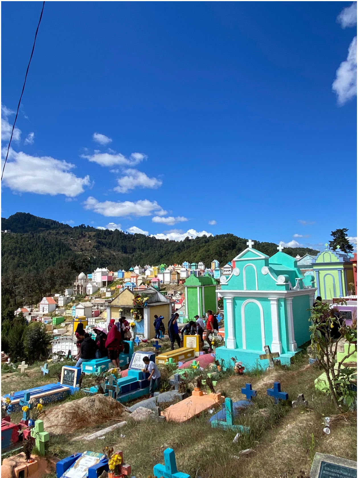
El cementerio de Chichicastenango (Quiché) es muy colorido y está lleno de vida. En él se puede ver a familias que pasan el día sobre las tumbas, carritos de helados, rituales de origen maya en los que se queman ofrendas...