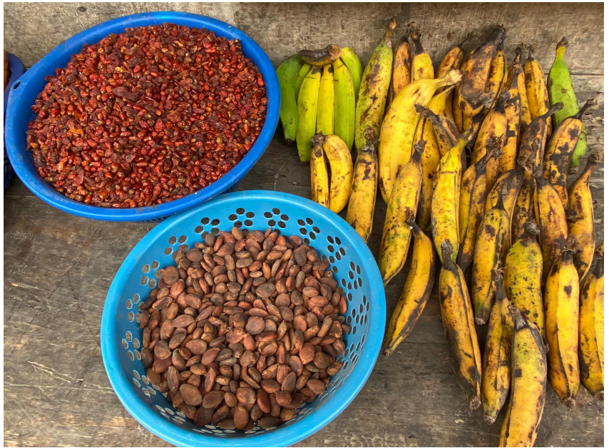
Fruta y cacao en Lanquín (Alta Verapaz).