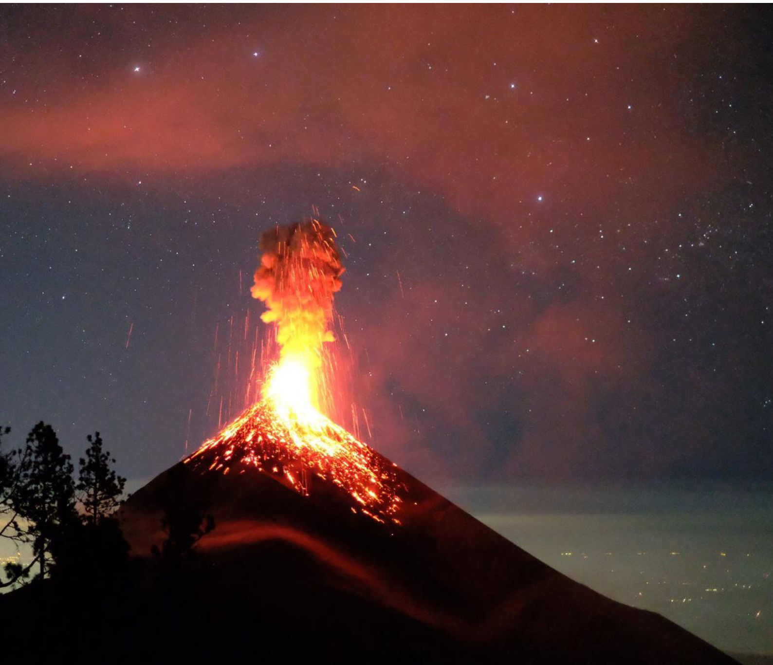
Erupción en el volcán de Fuego visto desde el campamento base en el volcán Acatenango. Este es uno de los volcanes más activos del planeta.