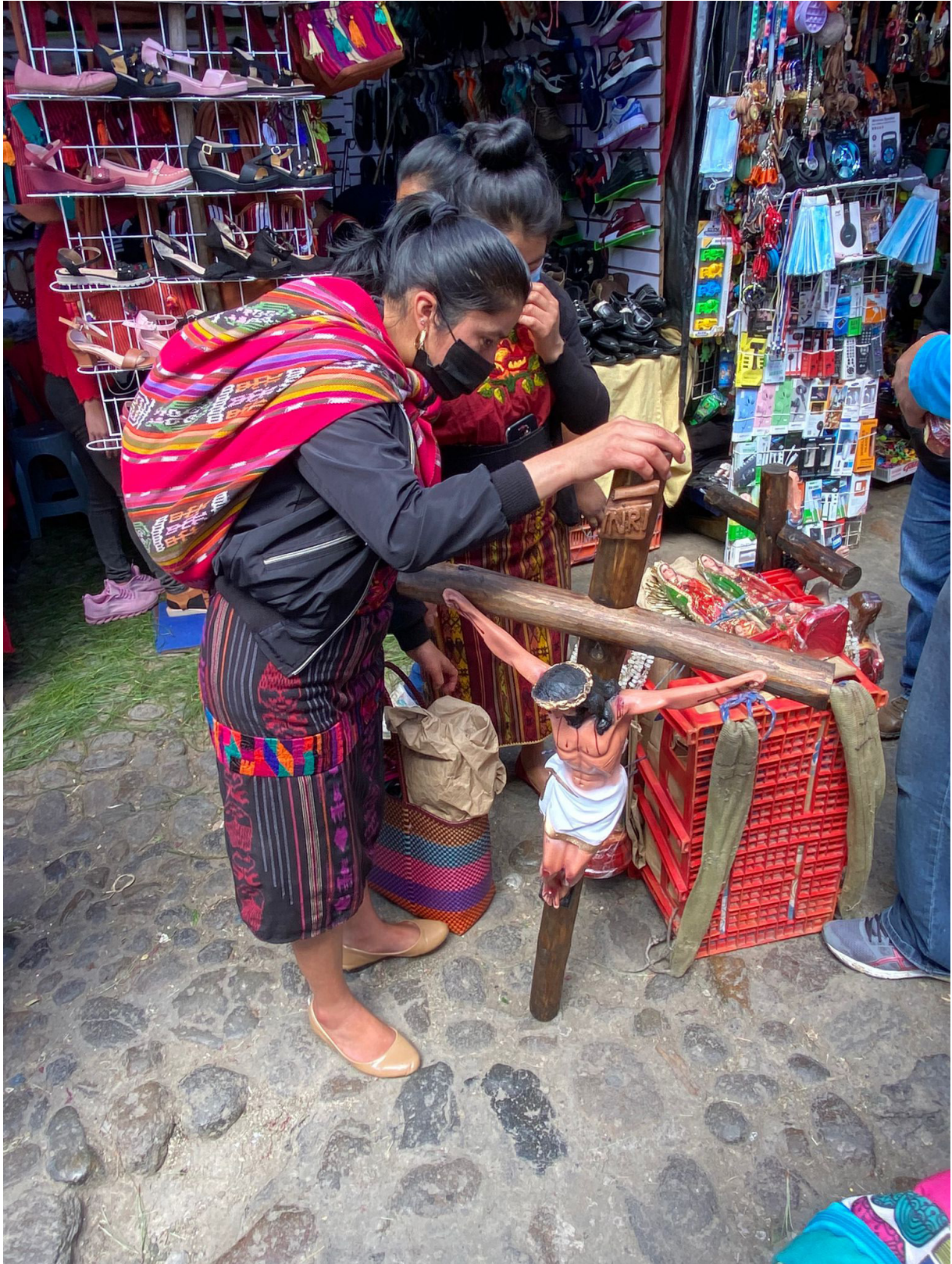
En el mercado de Chichicastenango (Quiché) puedes encontrar desde un crucifijo hasta una gallina viva. En la página de la derecha, un embarcadero en el lago Atitlán (arriba) y un grupo de mujeres en Santa Catarina Palopó (Sololá).