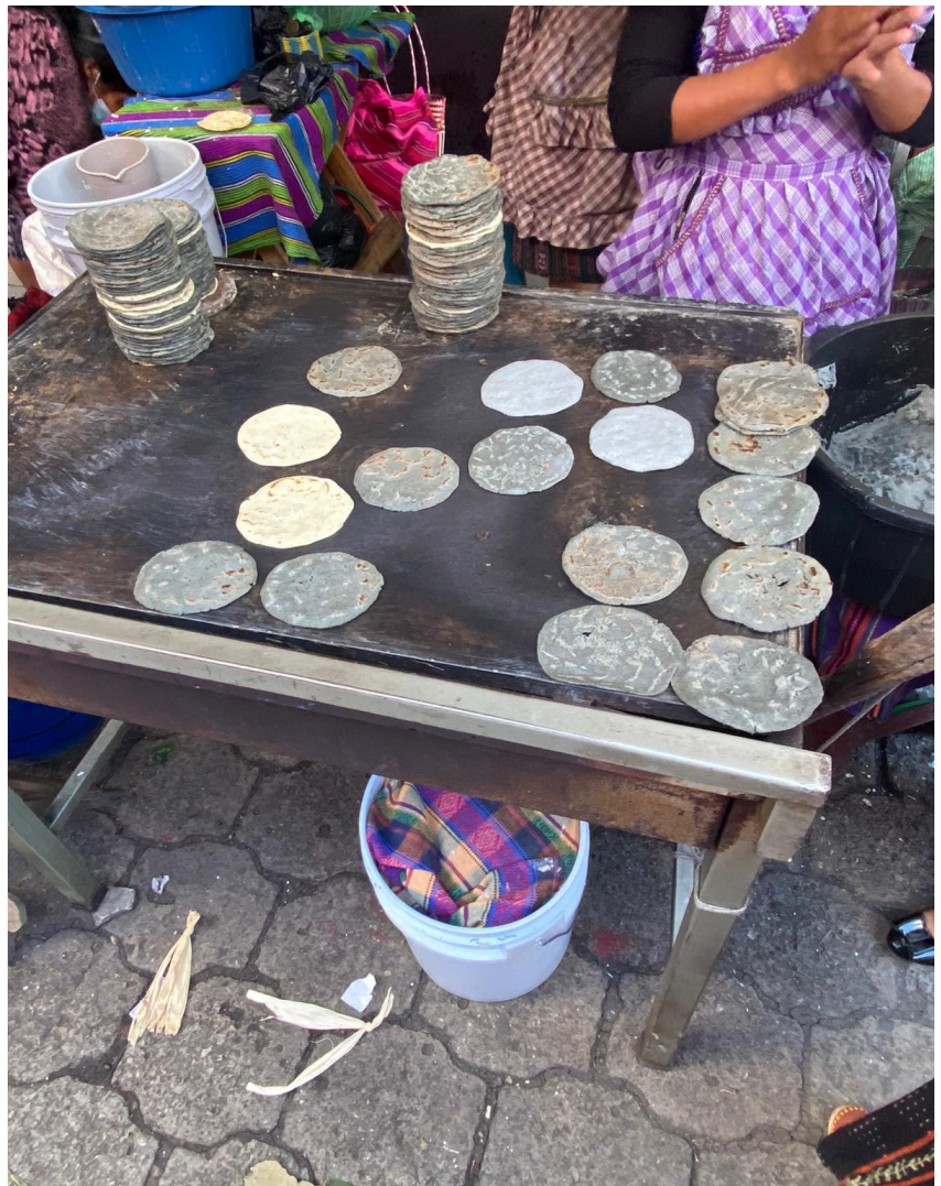
Tortillas de maíz negro en el mercado de Chichicastenango (Quiché).