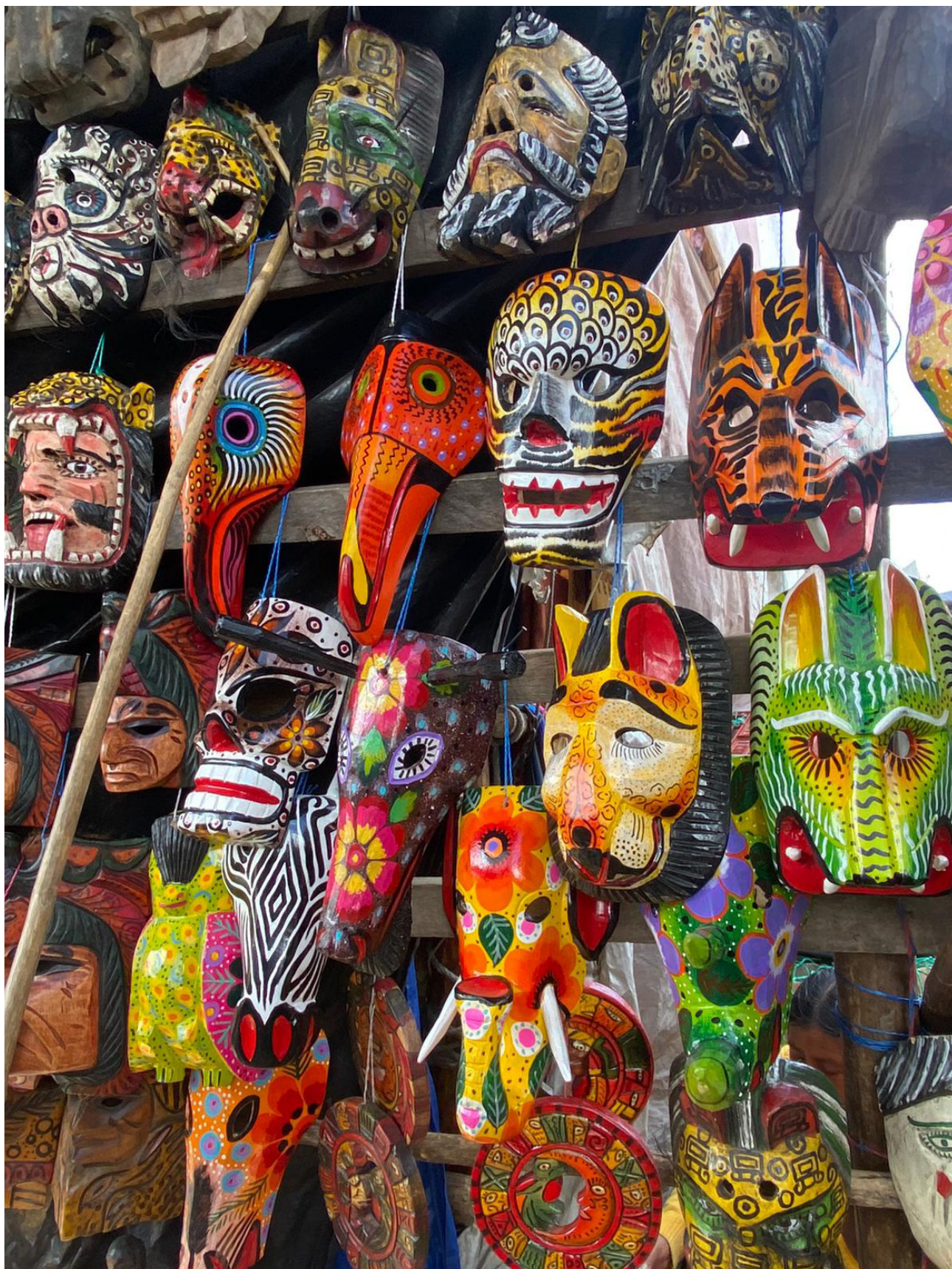
Máscaras tradicionales guatemaltecas. El danzante adquiere las habilidades y características de la figura que representa su máscara. En la doble página anterior, una colorida vista del mercado de Chichicastenango (Quiché).