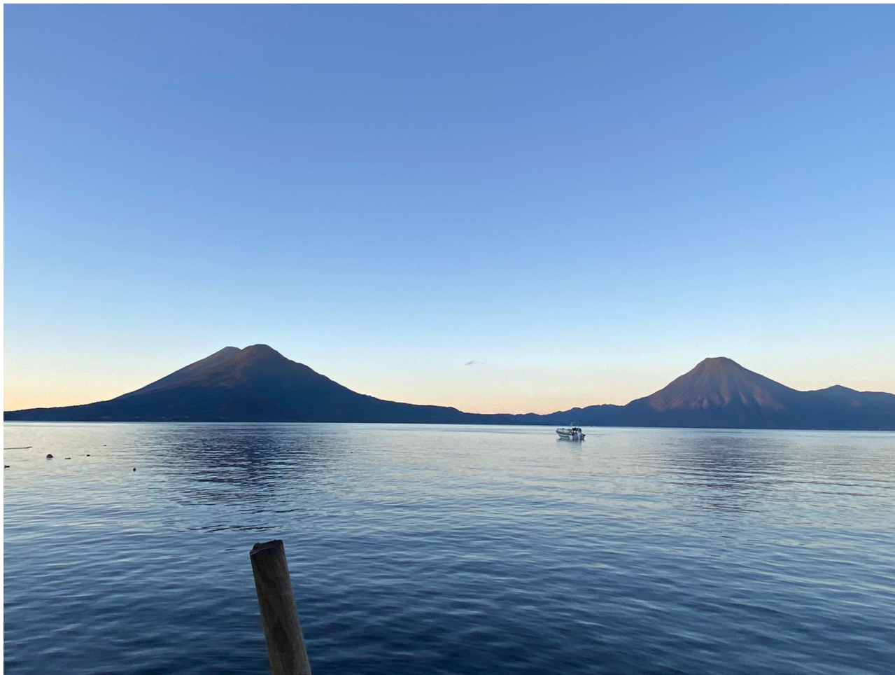
A las orillas del lago Atitlán, se alzan los volcanes Atitlán, San Pedro y Tolimán.