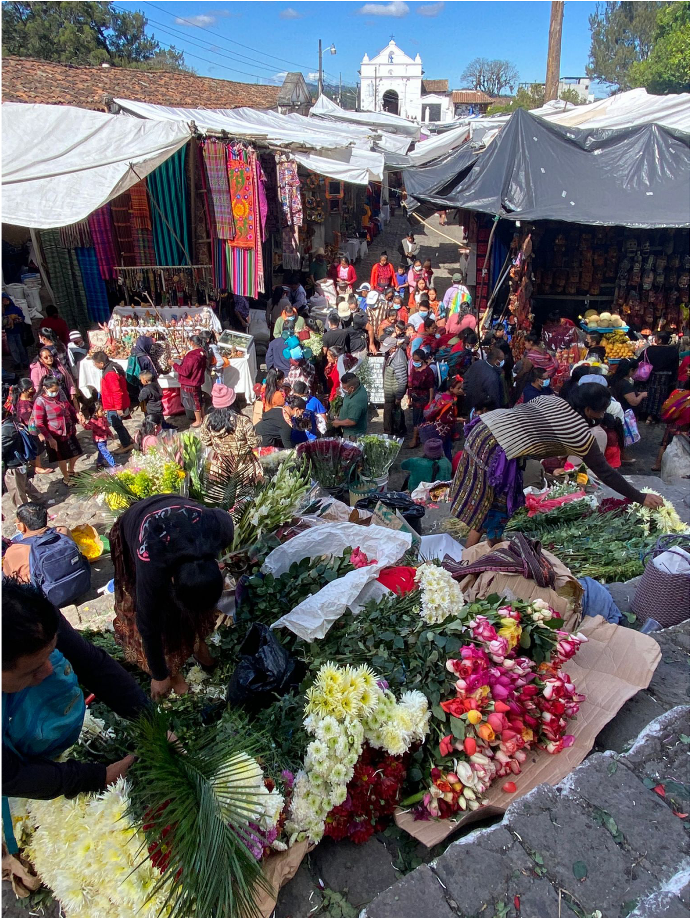
El mercado de Chichicastenango (Quiché) es uno de los mayores de América. En él se pueden encontrar desde flores para ofrendas, frutas y verduras hasta animales vivos u objetos de artesanía de distintas aldeas.