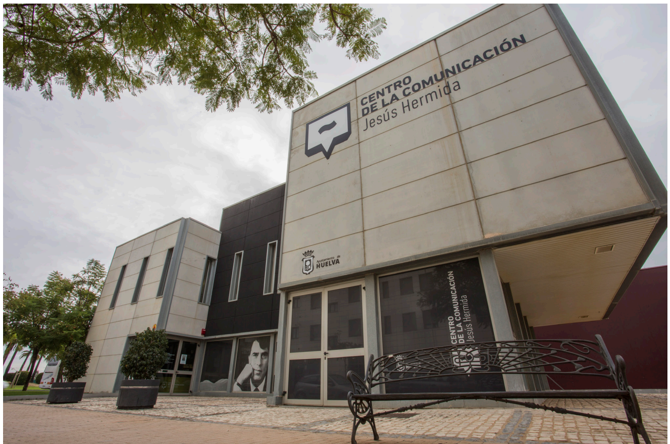
La Asociación de la Prensa y el Ayuntamiento de Huelva han unido esfuerzos para abrir el Centro de la Comunicación Jesús Hermida.

tigación necesario en una época en la que las redes imponen una nueva forma de entender la comunicación y las herramientas digitales dominan la forma de comunicarse poniendo a nuestra disposición infinitas fuentes de información, aunque, sin embargo, se constata una creciente confusión al distinguir entre qué son las herramientas de comunicación y los medios de comunicación, lo que provoca en el ciudadano un evidente aturdimiento en su capacidad para asimilar con sentido crítico los contenidos a los que tiene acceso.