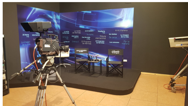
El set o estudio de televisión también rinde homenaje a Jesús Hermida.