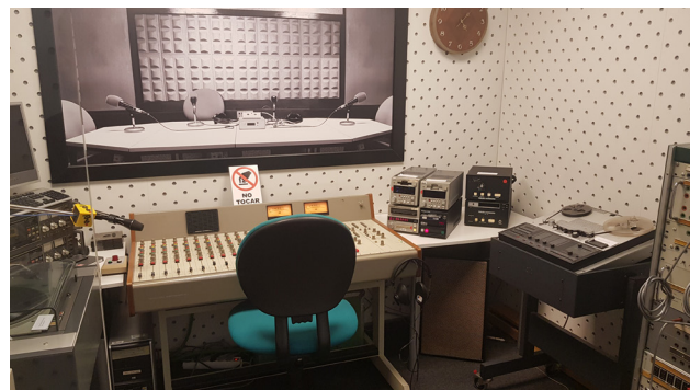
Estudio (o set) de radio analógico en el que se puede grabar unos minutos de audio y experimentar cómo se desarrollaban antes las emisiones.

El espacio dedicado a la radio muestra la evolución tecnológica que ha tenido este medio, en el que Huelva es pionera en nuestro país con la primera emisora con estudios de Radio Nacional de España, algunos de cuyos elementos se han podido rescatar y exponer. También se muestra un estudio analógico de radio, en el que los visitantes pueden sentir la experiencia de sentarse ante el control y grabar unos minutos.