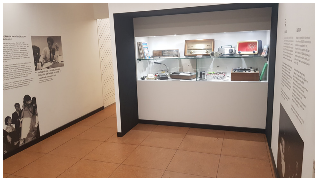
Una de las salas está dedicada a la evolución de la historia de la radio, a la que el periodista onubense Jesús Hermida estuvo tan ligado.

Con el lema «Conocer para comprender», el Centro de la Comunicación Jesús Hermida pretende ayudar a entender la evolución de los medios de