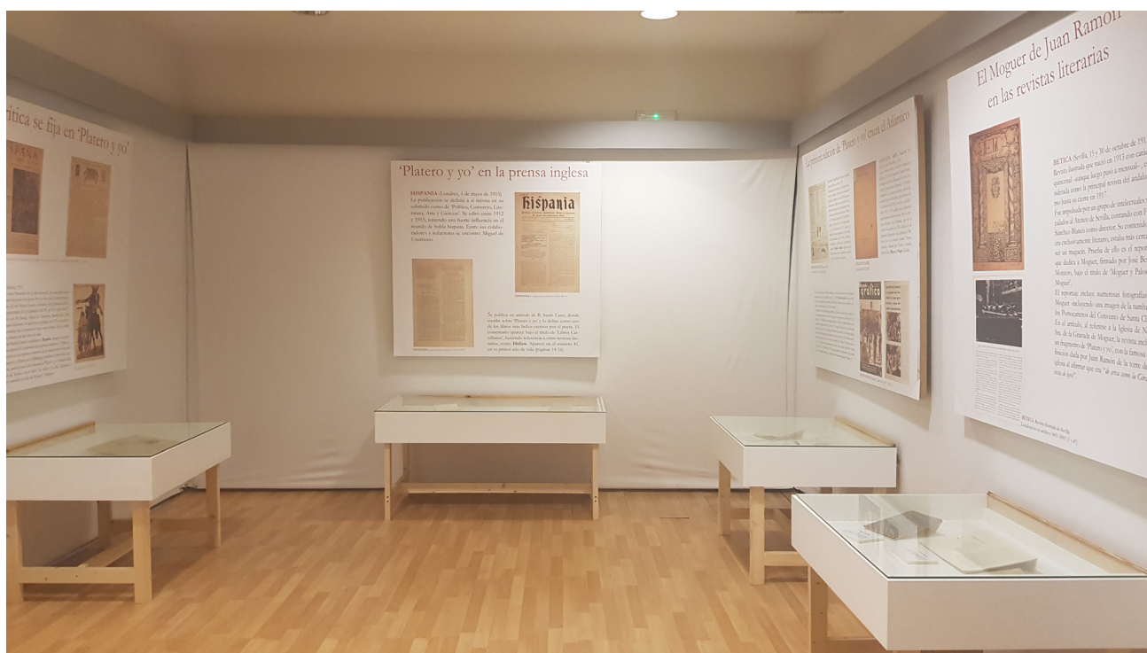
El Centro de la Comunicación Jesús Hermida acoge diversas exposiciones temporales.

En la transición hasta un set de televisión, dotado con todos los elementos necesarios para simular la grabación de un programa, se encuentra el espacio dedicado a Jesús Hermida y la Luna. En él hay objetos y documentos únicos relacionados con la aventura espacial y la retransmisión que el periodista realizó de la llegada del hombre a la Luna el 21 de julio de 1969. La grabación original se proyecta con la autorización de la NASA y TVE.