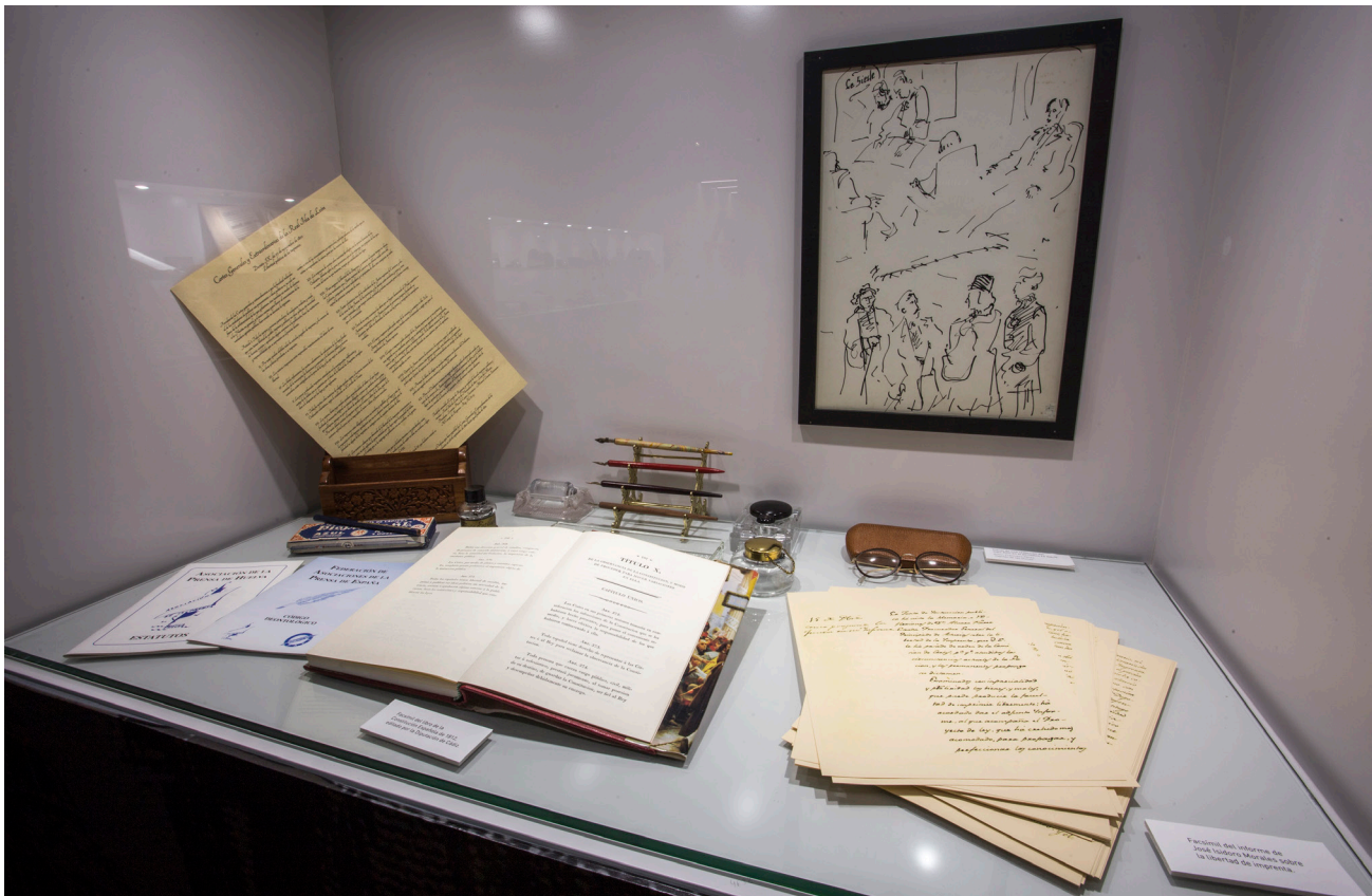
Un espacio del centro está dedicado a mostrar facsímiles de diversos documentos relacionados con el origen de la libertad de prensa en España y su inclusión en la Constitución de 1812.