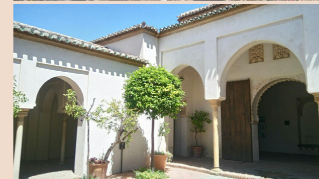
Vista exterior y un patio del Palacio de la Alcazaba.

– Calle de los Álamos , núm. 25. Entre 1740 y 1747, la familia pasó a residir en la calle de los Álamos con los mismos moradores. Tras la muerte de la abuela