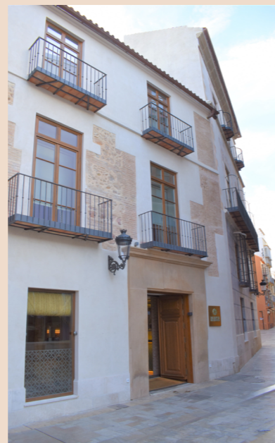
Calle de Granada, 59, antes (arriba,) y ahora (abajo).