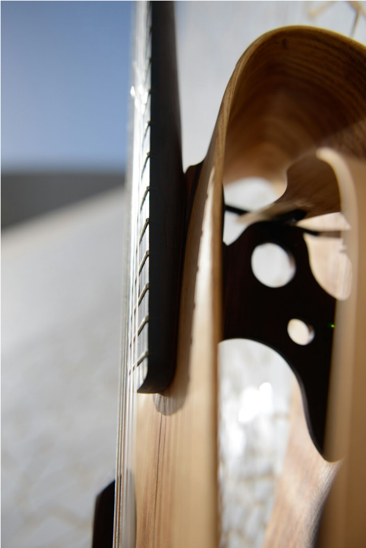
Gugg. La luz y el espacio como materiales de fabricación. (Foto: Estefanía Acosta Galván).