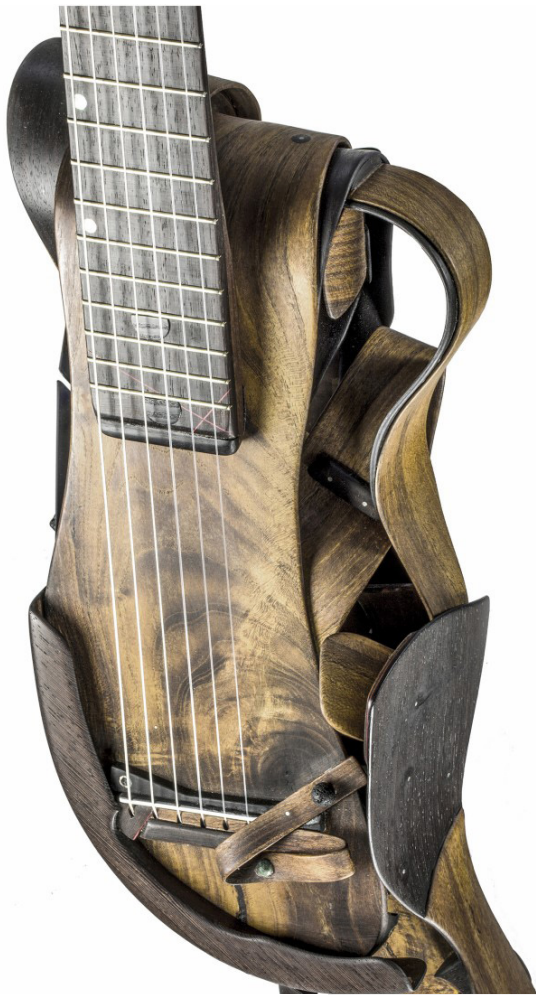
Aurhea. Ordenando el caos como vehículo hacia la emoción. (Foto: Jonatan Rodríguez).