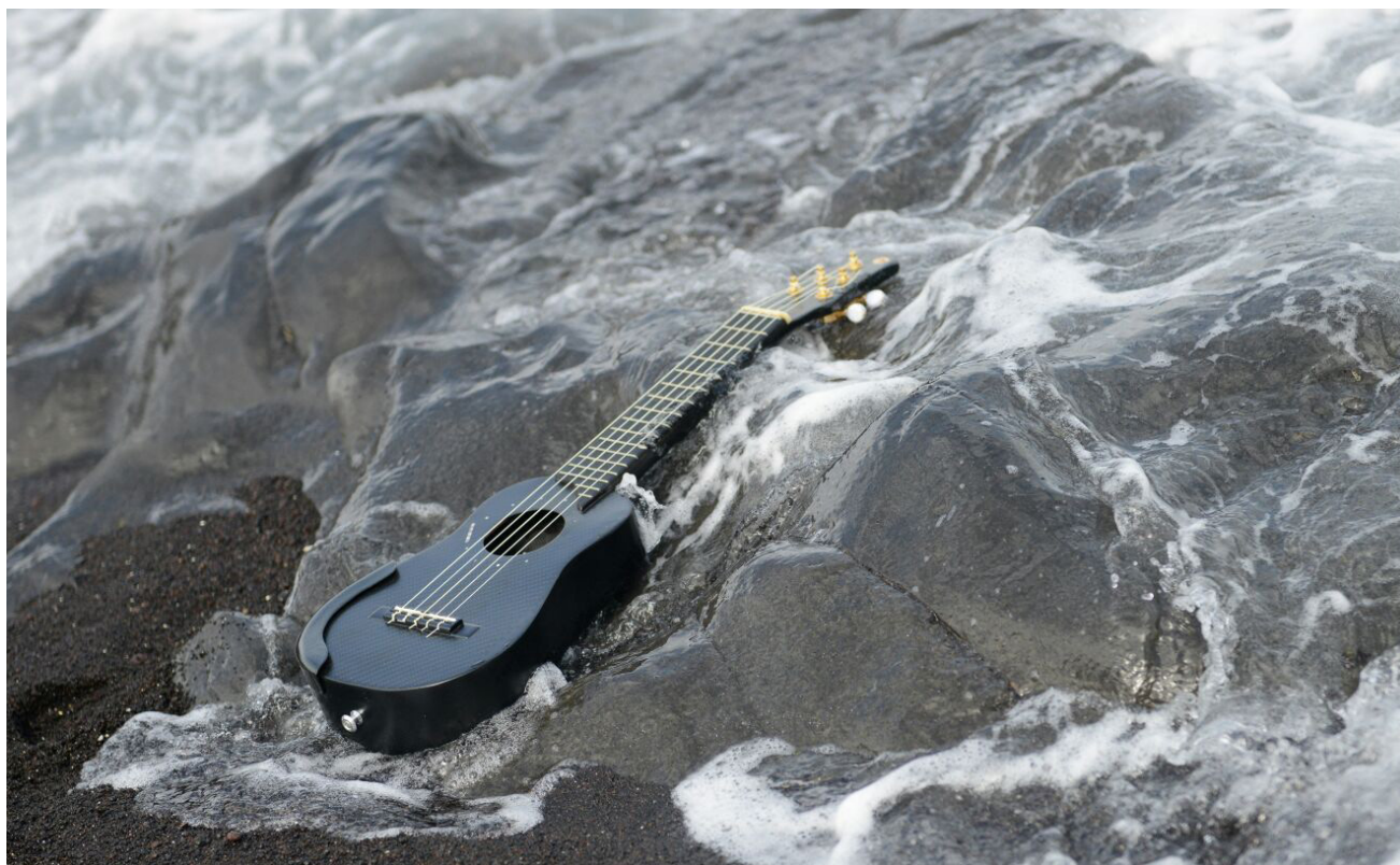
Timple de carbono. Hacia nuevos soportes acústicos.