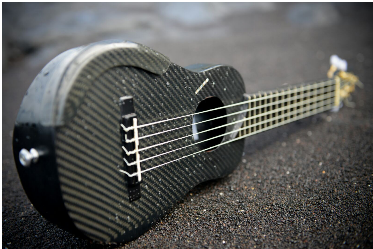
Timple de carbono. Huellas de basalto.