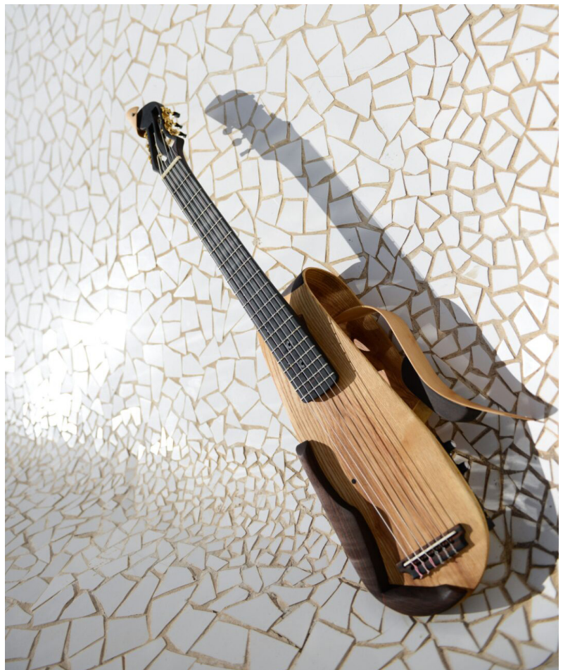
Gugg. Explorando nuevos límites en la guitarra.