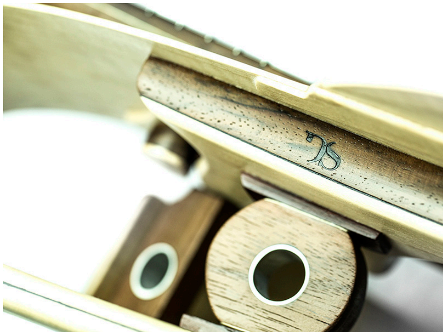
Ithaca. Los contrastes como recursos expresivos.