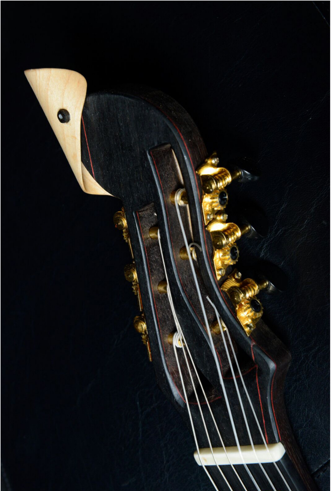
Gugg. De la forma a la función.