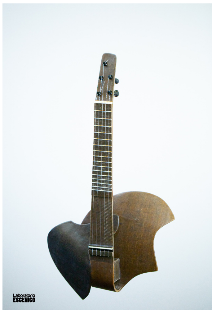
Timple de lino y papel. Explorando nuevos soportes.