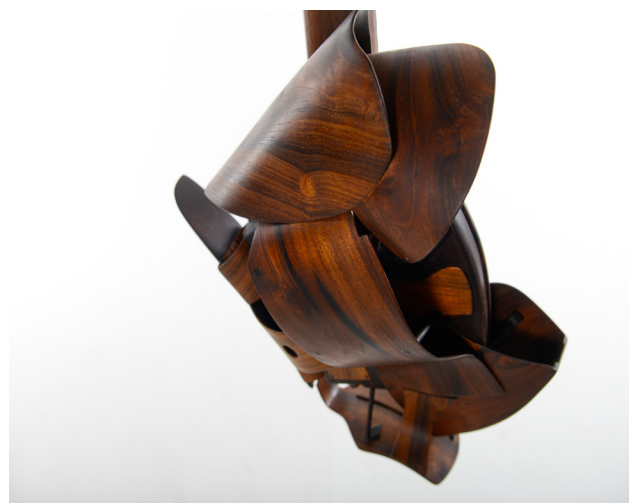
Lotto. Dando expresión a la madera.

El lenguaje queda específicamente impreso en el diseño, mientras la materia inerte se va acumulando y acercando al abismo del papel en blanco; carente de expresión y susceptible al devenir de la imaginación de David, ofreciendo resistencias al movimiento de su mano, al trazo de su lápiz. Comienzan a aparecer los primeros límites y se agolpan las preguntas –hacia dónde ir, cuál es el camino, cómo ir...–. Pero la presión crece y luego se estabiliza; la libertad va cambiando y se torna menos libre. Son las sensaciones las que derriban los límites y sucumben a las resistencias personales, egoicas; el punto de partida que marcará el camino y el ritmo de cada proyecto.