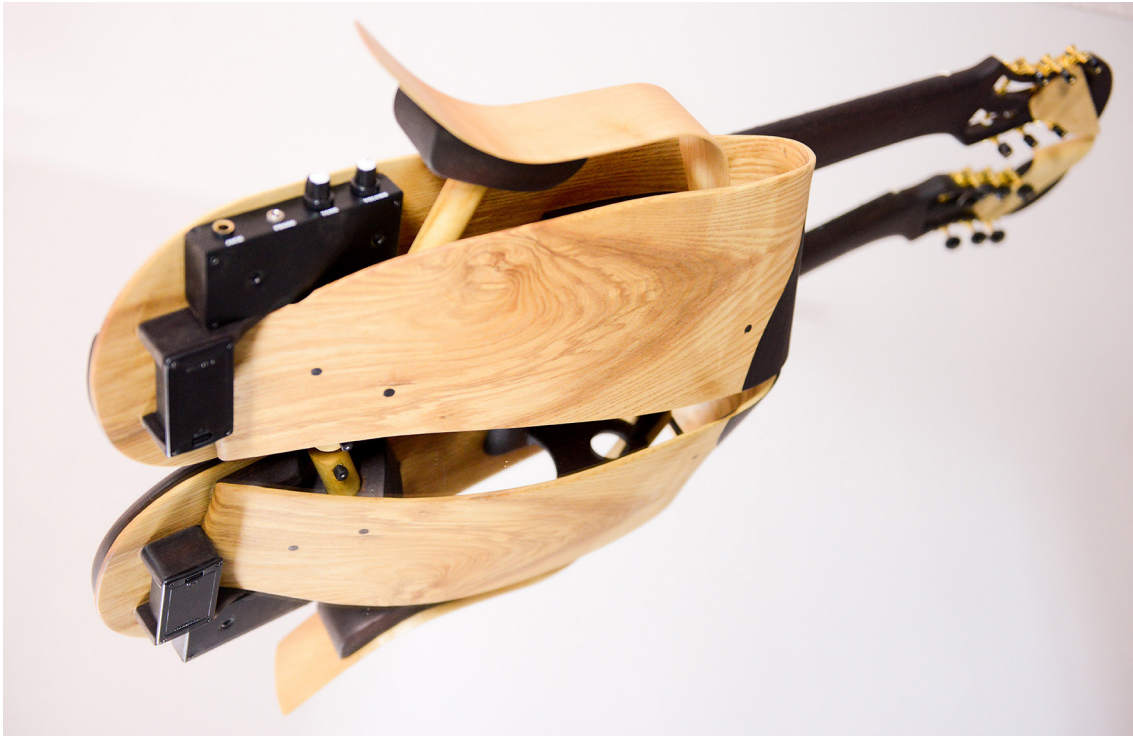
Gugg. Más allá de la experiencia acústica. (Foto: Estefanía Acosta Galván).