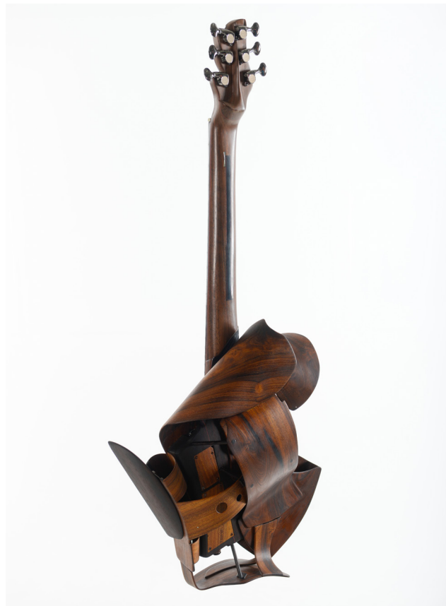
Lotto. Guitarra, cuerdas de nailon. Jugando con otros lenguajes plásticos.