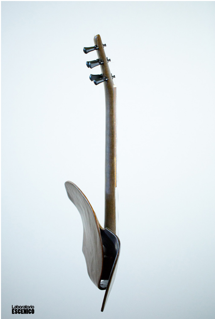
Timple de lino y papel. Más allá de la forma.

La artesanía de vanguardia en Canarias. El Timple