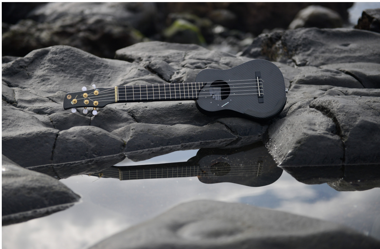
Timble de carbono. Ecos acústicos.

Su nómina artística puede leerse como un relato que narra la naturaleza oculta del impulso que da lugar a la creación flexible de cada uno de sus instrumentos; es la suma y resultado de voluntad, experiencia y el discurso que surge del camino transitado por ambos. El lutier crea a partir del primer impulso; lo plasma en el papel y se permite desatar su intuición en la puesta en práctica de una sospecha que se torna realidad.