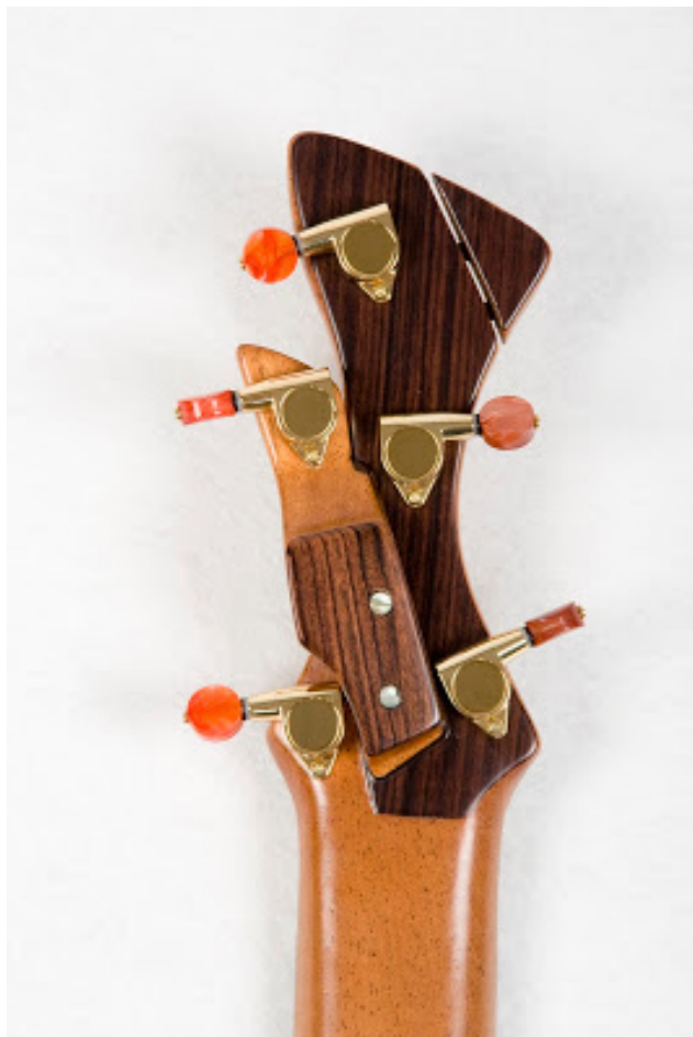
Timple electroacústico. Deconstruyendo la pala. (Foto: Estefanía Acosta Galván).

obra de David en la reinterpretación contextual de la época en la que le ha tocado vivir y desarrollar su oficio; ha aprendido a ser inmune y a crecer, insistiendo en su empeño de ser fiel al camino que ha elegido, insistiendo una y otra vez más. No esquiva el fracaso; lo encaja y lo atiende, agudizando la escucha activa como motor de cambio.