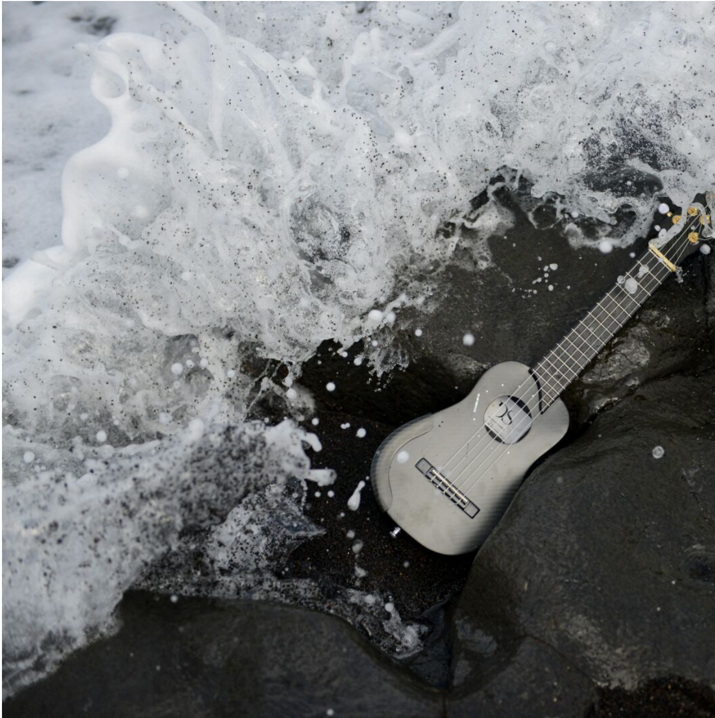
Timple de carbono. Siente la fuerza del soporte. (Foto: Estefanía Acosta Galván).