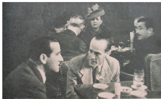
«De todas estas cosas hablábamos Belmonte y yo en Gayango, en aquella Feria de Sevilla que fue memorable por tantas cosas, y la principal de todas ellas, porque allí se consagró Manolete como un torero excepcional». (Fuente: El Ruedo de México , 6 de marzo de 1952, p. 3).