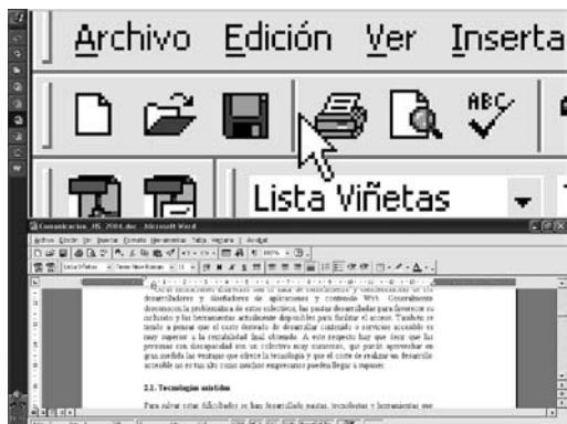
Fig. 1.— Ejemplo de ampliación de pantalla

pocos usuarios que previamente han entrenado al sistema. Uno de los programas más utilizados es Via Voice de IBM (IBM 2006).