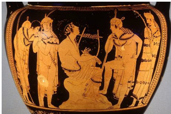
Orfeo entre los tracios. Ánfora ática de figuras rojas encontrada en Gela. Altes Museum, Berlín.

condición: que Orfeo no vuelva su vista atrás para mirar a su esposa durante todo el trayecto de regreso. Pero Orfeo estaba tan ansioso de contemplar a su amada, que no pudo evitar mirarla de soslayo, con lo que la condenó para siempre al inframundo. Más tarde, cuando Orfeo murió, su lira fue transportada al cielo y se convirtió en constelación, la Lira. Este mito, junto con el de Anfión, convierte a la música en una fuerza mágica capaz de modificar las leyes naturales, además de transmitir placer a los hombres e influir decisivamente en ellos.