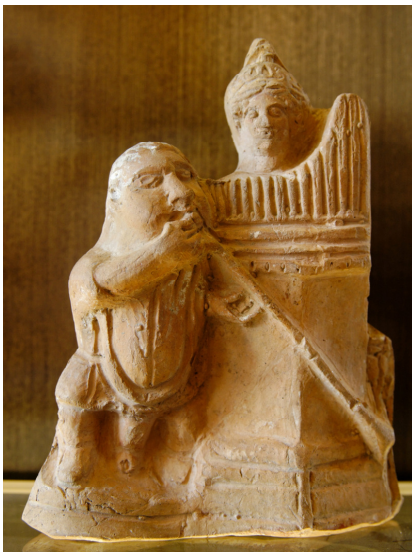
Músicos tocando una salpinge y una hidráulide. Terracota (s. I d.C.). Museo del Louvre, París.

principios pero también desequilibrarle e inclinarle a la desproporción y, por tanto, al mal. Así, desechaba los géneros cromático y enarmónico así como la música puramente instrumental, pues pensaba que actuaban de un modo desenfrenado sobre las emociones, poniéndolas fuera de control. Por tanto, elogiaba el género dorio, más equilibrado y mesurado. Y, por supuesto, la música extranjera entraba dentro de la primera consideración, orgiástica y perniciosa.