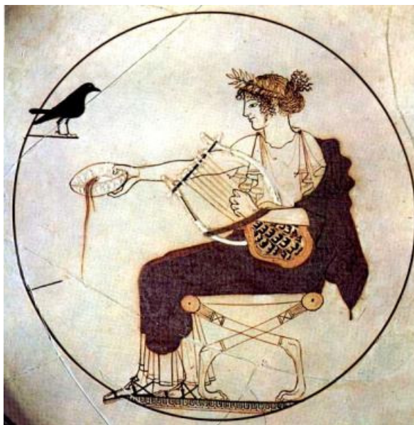
Apolo sentado con la lira en la mano, mientras celebra una libación. Cílice, Ca. 470 a. C. Museo Arqueológico de Delfos.

En este campo de la poesía coral cantada con acompañamiento musical surgió el ditirambo, considerado el precedente del drama o poesía dramática (tragedia, comedia y drama satírico). Estos coros, sin máscara, entonaban en círculo construcciones estróficas ( estrofas y sus respuestas o antístrofas ) repetidas en conjunto y con un lenguaje más bien artificial, acompañado de lira o, más frecuentemente, de aulós . Compositores de ditiram-