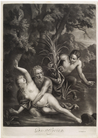
Pan y Siringa. Grabado de Isaac Beckett. National Portrait Gallery, Londres.

ban espíritus de la tierra y la fecundidad y hombres y mujeres danzantes en frenesí. En estos cortejos tienen su origen las representaciones teatrales. Por eso, Dioniso era el dios protector del teatro y durante los días de las fiestas en su honor se representaban en concurso tragedias y comedias. Pues bien, en esas procesiones de bailarines frenéticos en trance, en ese proceso de enajenación la música desempeñaba un papel fundamental, sobre todo la melodía del aulós .