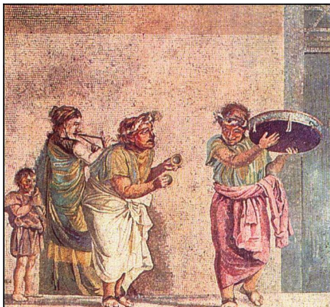
Mosaico romano con una escena de músicos callejeros tocando el diaulós, los címbalos y un tímpano. Villa del Cicerone, Pompeya.

compuestas conocidas por los griegos, octava más quinta (1:2:3) y dos octavas (1:2:4).