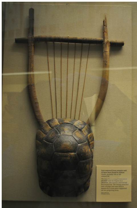
Quelis. British Museum.

Las primeras referencias son, inevitablemente, míticas. Existen en la mitología griega abundantes relatos sobre inventores de instrumentos, cantos y melodías. Es difícil discernir qué verdad histórica pueden encerrar dichos relatos, pero sí podemos sacar la conclusión de conjunto de que para la base musical griega fueron muy importantes las aportaciones