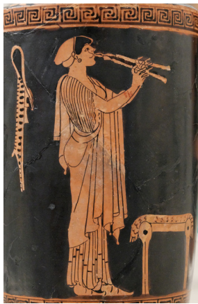
Mujer tocando el diaulós . Lécito ático de figura roja (c. 480 a. C.). Metropolitan Museum, Nueva York.

El drama estaba formado por danza, ejecutada por el coro, poesía, acentuada por sílabas, tanto recitada como cantada, y música, condicionada por el ritmo de la letra poética y por tanto basada en el número y duración de las sílabas, al igual que la métrica. Por tradición se consideraba como creador al poeta Tespis (s. VI a. C.), que dividió el coro en dos semicoros dialogantes y que introdujo el primer actor, que dialogaba con el corifeo. Con Esquilo (s. VI-V a. C.) encontramos ya el segundo actor, y el tercero con Sófocles (s. V a. C.). Éstos interpretaban varios papeles gracias a la caracterización de vestuario y máscara, que también servía de altavoz. El papel del coro, primero de doce miembros y luego quince en la tragedia, y veinticuatro en la comedia, fue perdiendo paulatinamente importancia frente a los actores: primeramente precedía y acompañaba la acción, comentándola y explicándola, siempre cantando, mientras el corifeo le daba la réplica recitando; luego, terminó convirtiéndose en un simple separador de escenas mientras los actores se cambiaban.