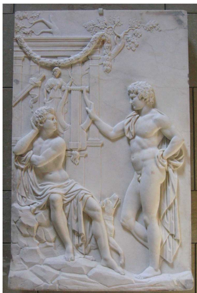
Anfión y Zeto. Bajorrelieve. Palazzo Spada. Roma.

En un tercer mito, Anfión, hijo de Zeus y Antíope, recibe de Apolo en su nacimiento el regalo de una lira , con la que adquiere tal maestría que, cuando levanta las murallas de Tebas con su hermano gemelo Zeto, mientras éste arrastraba las piedras con su gran fuerza, Anfión las transportaba haciéndolas flotar con la poderosa magia de su música.