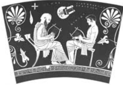
Lino enseñando a Ificles a tañer la lira.

averigua quién fue el ladrón, se queja ante Zeus. El Padre de los dioses, en consecuencia, ordena a Hermes que devuelva el ganado robado. Como, evidentemente, esto no era posible, Hermes le ofrece en pago la recién creada quelis , que Apolo acepta complacido, pues ya había oído los agradables sonidos que Hermes había logrado extraer de ella.