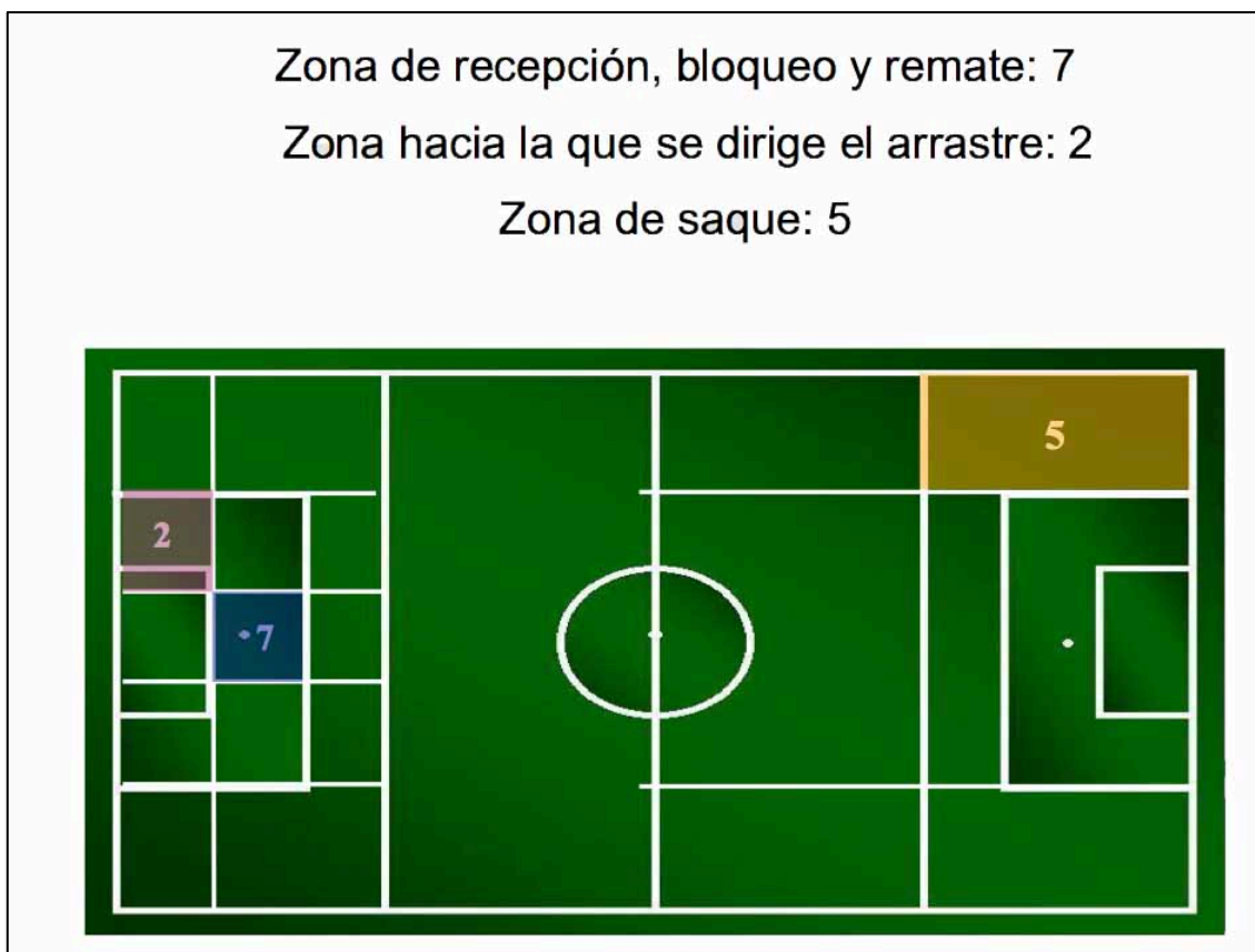
Gráfico 1. Zonas de división del campo para realizar los análisis.

En el gráfico 1 aparece el análisis de frecuencia de cada una de las zonas de división del campo