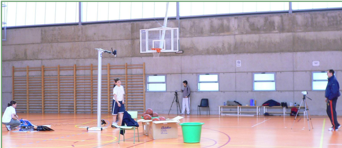
Figura 1. Posición de las tres cámaras con las que se filmaron los tiros libres.

Todos los jugadores participantes en el estudio realizaron diez lanzamientos en cada una de las situaciones descritas en la tabla 1. Se filmaron un total de seiscientos treinta tiros, setenta tiros por cada uno de los nueve participantes estudiados.