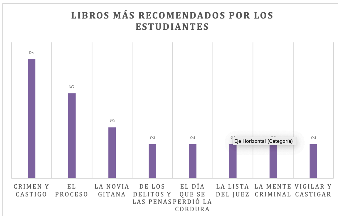
GRÁFICO 2. Libros más recomendados por los estudiantes