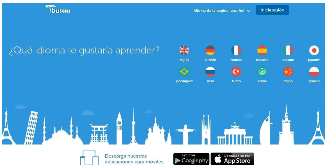
Imágen 3. Página inicial de Busuu: https://www.busuu.com/es/

En la primera página encontramos las diferentes lenguas que pueden ser objeto de estudio: inglés, alemán, francés, español, italiano, japonés, portugués, ruso, turco, árabe, chino y polaco. Once lenguas en total, que aparecen con su correspondiente bandera y junto a imágenes donde se observa la silueta de los monumentos más emblemáticos que representa al país que pertenece cada lengua. Ilustraciones, banderas y monumentos, añadirán un eslabón más a la cadena de aprendizaje, aunando el estudio de la lengua con aspectos culturales básicos.