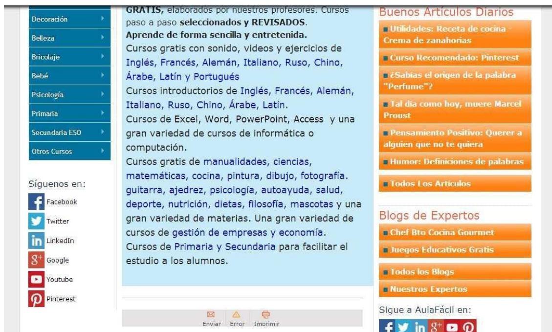
Imagen 2. Página principal de AulaFacil: http://www.aulafacil.com/

diferenciadas por el ámbito o la materia que se quiera estudiar. Además, se ofrece información general a modo introductorio para cada modalidad, de entre la variedad de propuestas que sugiere este soporte como: artículos diarios, certificados, sección para enviar trabajos, blogs de expertos, anuncios de otros cursos y foros de colaboración.