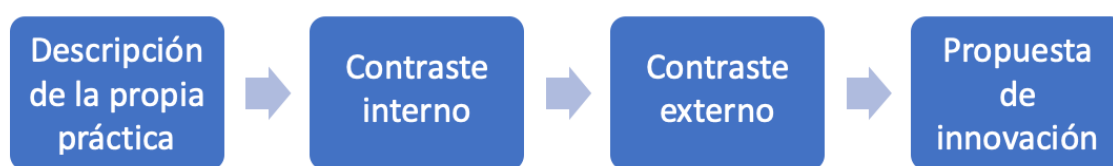
Ilustración 2: Fases del núcleo interdisciplinar

La tarea en el núcleo interdisciplinar se desarrolló en cuatro fases: la descripción de la propia práctica, el contraste interno, el contraste externo y la propuesta de innovación.