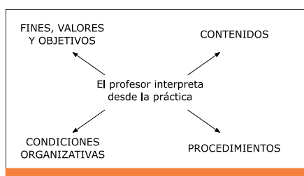
Ilustración 2. Modelo humanista (Rodríguez, 1997)