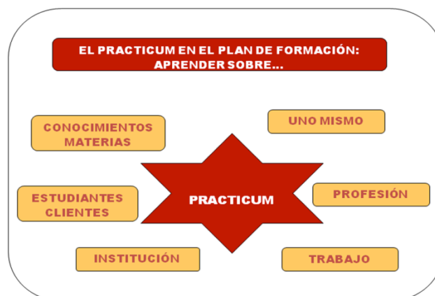
Ilustración 2, Aprendizajes del prácticum. Elaboración

Se dice que todo aprendizaje se produce como un proceso, esto es, algo que sucede en el tiempo, que posee una duración y que está constituido por un conjunto de fases secuenciadas que te conducen, o eso pretenden, al resultado final. La configuración en fases de los planes de prácticas es una condición bastante bien conocida. Todo Practicum precisa de una fase de preparación (normalmente en el propio centro universitario), una fase de desarrollo y una fase posterior de revisión de lo realizado (el plan-do-review de las pedagogías basadas en la experiencia). Cada una de dichas fases, y sobre todo la fase de desarrollo del Practicum, puede estar organizada internamente acogiendo otras subfases que mejoren su funcionalidad dentro del Plan. Muradas y Porta (2007) 5 insisten en la importancia de una fase de preparación que oriente el trabajo a realizar por los estudiantes a través de consignas que los lleven a reflexionar sobre la experiencia que van a vivir. Ellas han podido demostrar que la calidad de esa reflexión está fuertemente vinculada y depende de la forma en que se conciba y desarrolle la fase de preparación del Practicum. Otro tanto podríamos decir de la capacidad de impacto sobre el Practicum que poseen tanto los modelos de supervisión habilitados (las visitas a los centros por parte