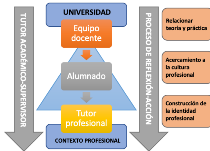
Figura 2. Agentes participantes en el modelo de prácticas de la UNED y proceso de aprendizaje del alumnado.

Nota. Adaptado de “Competencias tutoriales de los/as responsables de prácticas profesionales en contextos de enseñanza a distancia” (p. 183), por A. M. Martín-Cuadrado et al., 2020, Prisma Social: revista de ciencias sociales , (28).