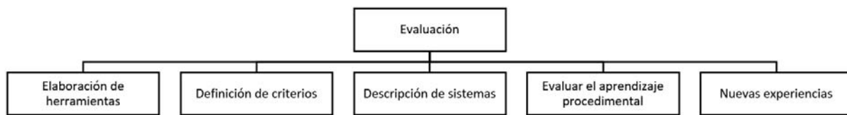
Figura 3. Ejes temáticos de las propuestas.

Para finalizar es importante destacar los resultados obtenidos en algunas de estas investigaciones ponen de manifiesto que existen ciertas diferencias entre las actividades que desarrolla el alumnado durante su estancia práctica y la concepción previa de las mismas (Lasa, 2009). El diseño del prácticum exige coordinación, colaboración y concreción, por lo que apostar por espacios como el Symposium, que invitan a colaboración y a la reflexión es un factor fundamental para la mejora. Por último, resaltar que este trabajo analiza una pequeña parte de la producción realizada en torno a las Ciencias de la Salud y esta puede ser una pequeña limitación, pero que a su vez abre el campo a futuras investigaciones en las investigaciones recogidas en otros simposios.