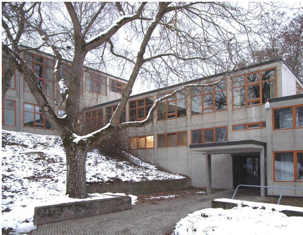
Figura 2. Edificio de la HfG Ulm, diseñado por Max Bill y terminado en 1955.