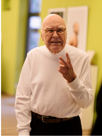
Figura 1. Gui Bonsiepe.

GB: En 1966, me contactaron de la Organización Internacional del Trabajo, desde la sede que tiene la OIT en Ginebra para integrarme como asesor en el campo del diseño. Mi primer destino fue Argentina, en el CIDI -Centro de Investigación del Diseño Industrial, perteneciente al Instituto Nacional de Tecnología Industrial. Allí impartí un curso de diseño y tecnología de embalajes. Una vez incorporado a la base de datos del organismo, como experto, surgieron otras propuestas. Así fue que en 1967 recibí una oferta para ir a Chile; esto coincidió con el cierre de la Escuela de Ulm. Además, mi primera mujer, que ya falleció, era argentina y le entusiasmaba la idea de volver a Latinoamérica.