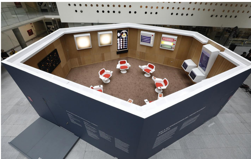
Figura 4. Cybersyn (Cybernetic Synergy). Red de teletipos entre fábricas. Chile, 1973.

«Cuando presentamos el prototipo de la sala cibernética los ingenieros y científicos se sorprendieron, no esperaban este resultado, pero lo aprobaron»..