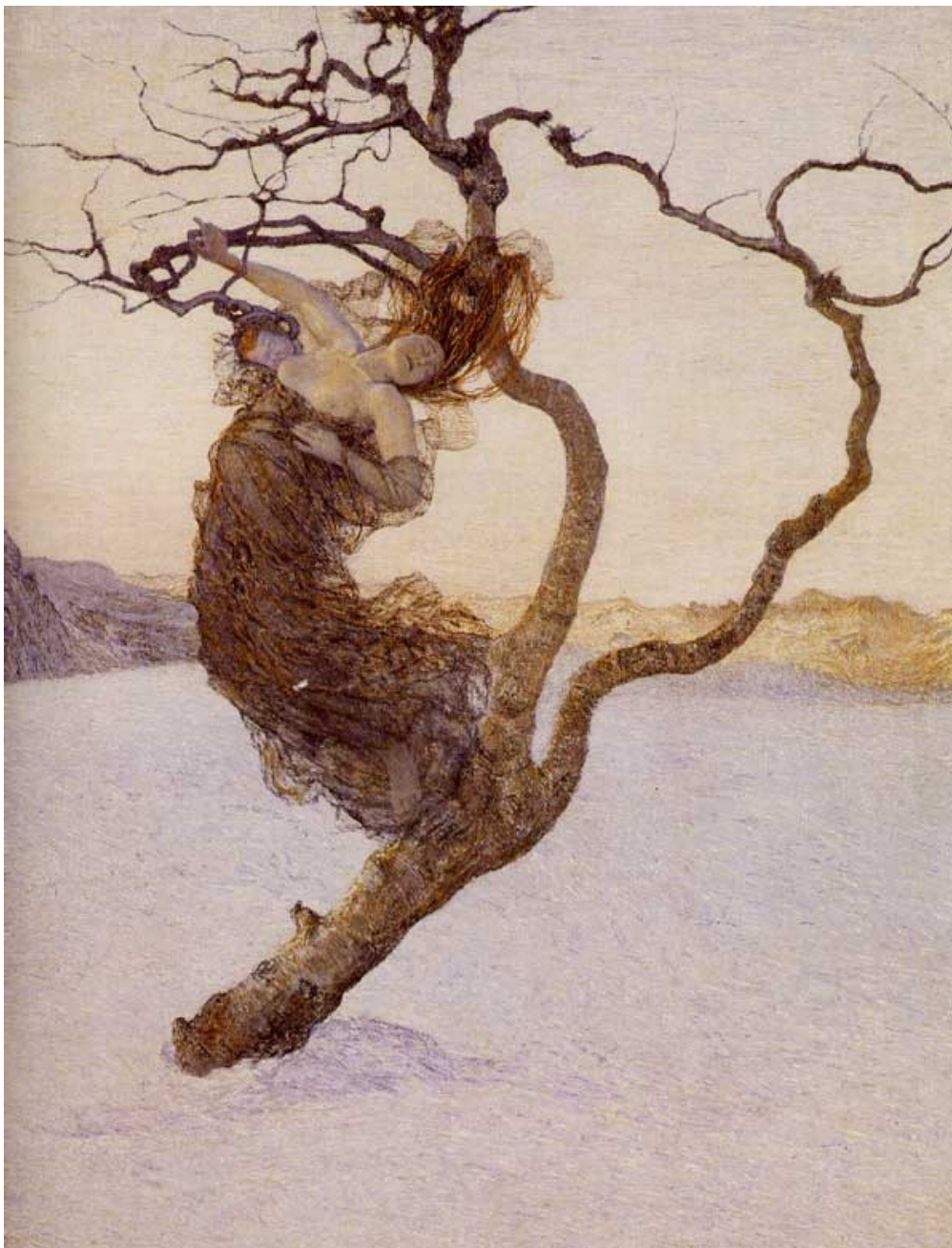
G. Segantini, Las malas madres, 1896-97 (82x97 cm.). Kunsthaus, Zurich