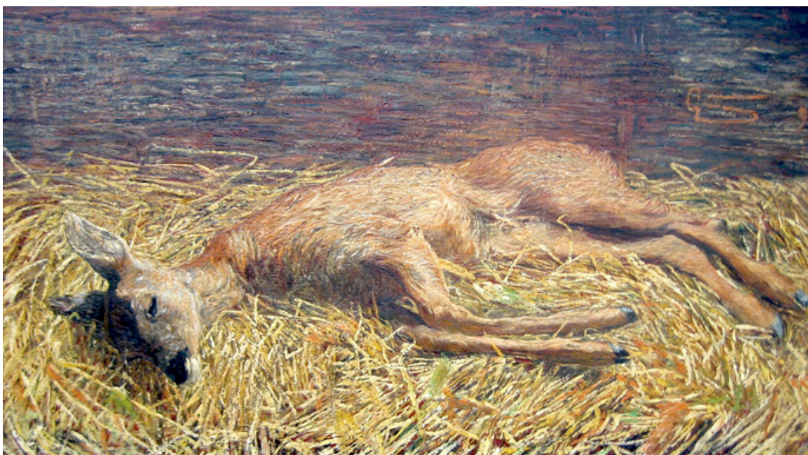
G. Segantini, Ciervo muerto, 1892 (55,5x96.5 cm.) Segantini Museum, St. Moritz

Pero en estos años de vida inmerso en plena naturaleza es donde desarrolla una fuerte inquietud hacia cuestiones estéticas, que al mismo tiempo plantea de manera gráfica. En este sentido mantiene una relación con diferentes intelectuales de la época y podría definirse su idea del arte como el medio capaz de permitir al hombre la posibilidad de alcanzar la grandeza de los sentimientos universales. Es entonces cuando se dedica a escribir una serie de interesantes artículos, como "Sentimiento y naturaleza" ó el que le publica la revista de la Secesión vienesa, Ver Sacrum , en sintonía con las ideas de William Morris y el Arts & Crafts, sobre la finalidad social del arte. Al mismo tiempo que es despreciado en la exposición del Castello Sforzesco la revista oficial de la Secesión de Berlín, Pan, le dedica un número monográfico y la Secesión de Munich, poco después organiza una exposición de su obra. Entre las influencias de la época destaca una autoidentificación esencial con Walt Whitman, en su pensamiento cósmico y su apasionado amor a la naturaleza.