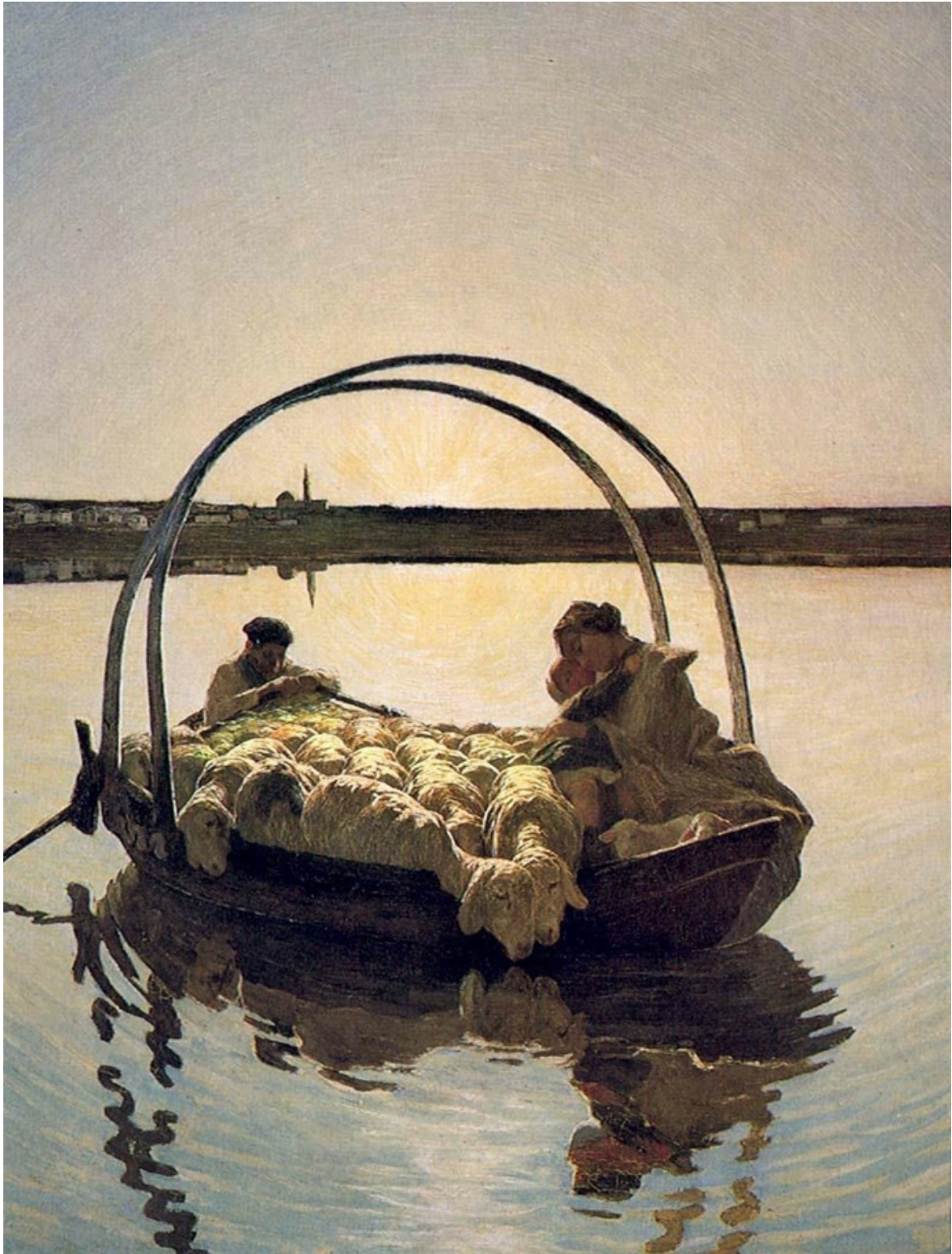
G. Segantini, Ave María, 1886. Colección particular