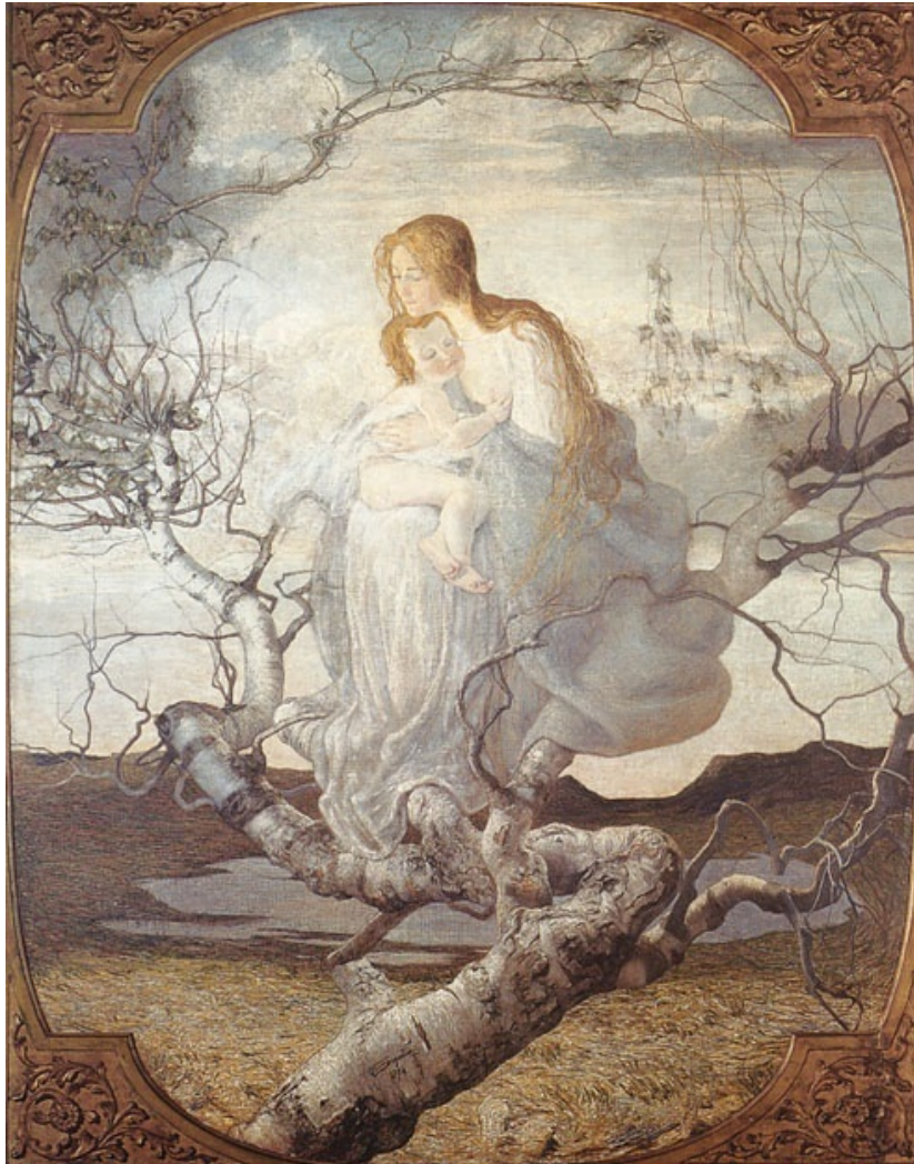
G. Segantini, El ángel de la vida, 1894 (276x212 cm.). Galleria d'Arte Moderna. Milán