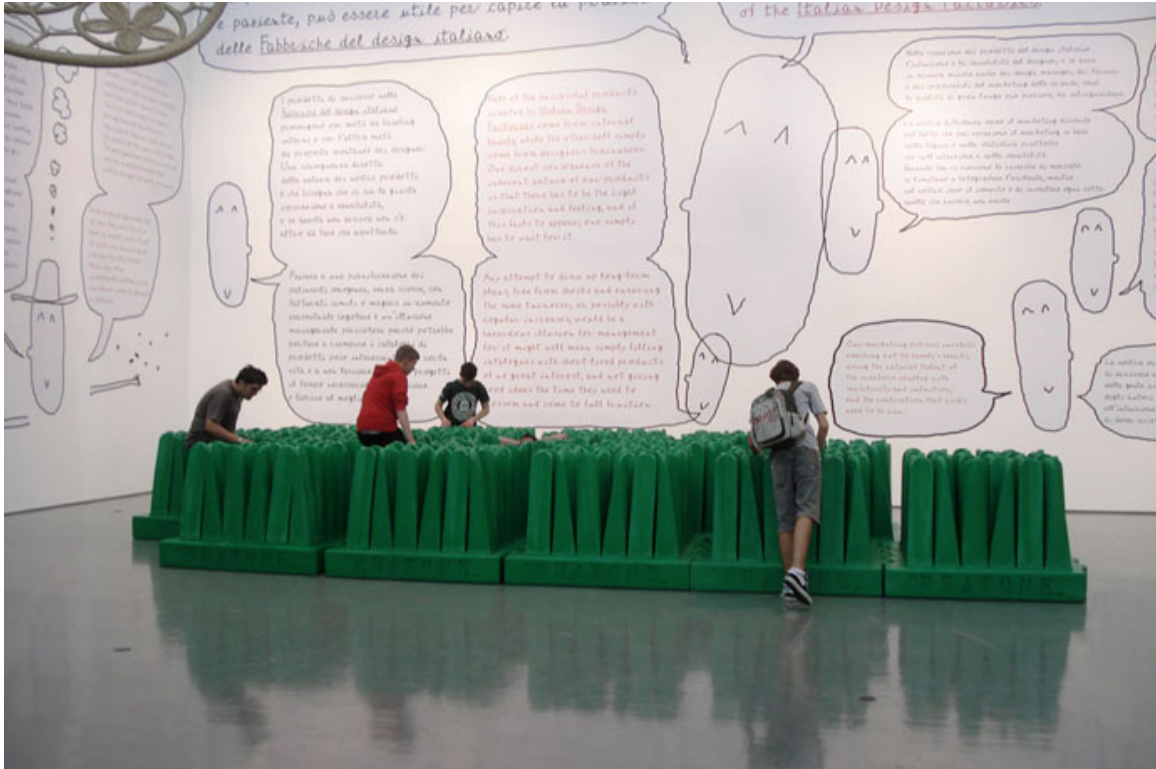
Gráfica de acceso, y piezas de la muestra Le fabbriche dei sogni . Triennale Design Museum

A continuación, además de una breve reseña y crítica sobre la nueva edición del dinámico Design Museum italiano, se recogen referencias y documentación gráfica 2 de una serie de muestras celebradas en el mismo ámbito, en lo que son las salas contratadas por diversas entidades, empresas y diseñadores para mostrar sus proyectos, y entre los que seleccionamos los más destacados.