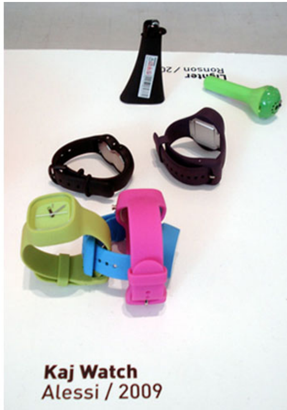
Kaj Watch Alessi / 2009