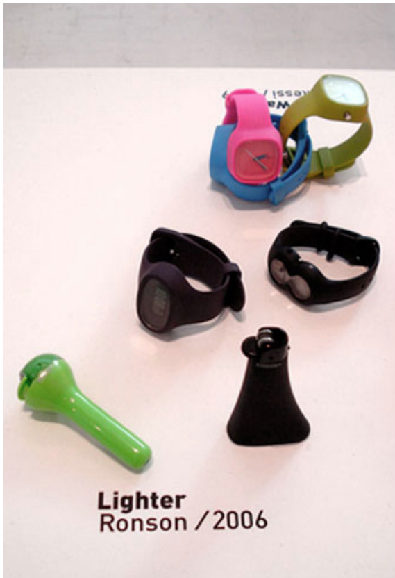
Lighter Ronson / 2006