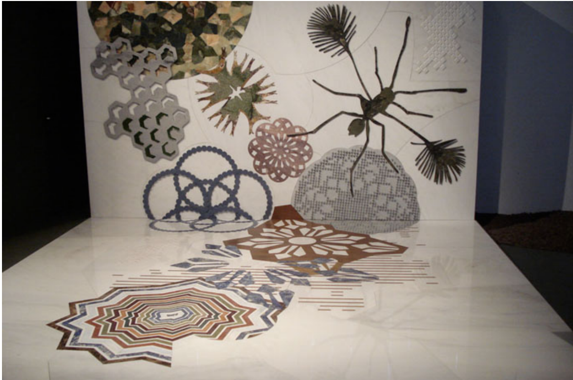
Macrosterias , Patricia Urquiola para Budri

Una serie de tres exposiciones de empresas destacadas en la fabricación y suministro de materiales de revestimiento de la más alta calidad exponen sus productos en las salas de La Triennale , de manera consecutiva y en una sucesión de sorpresas muy gratificantes hasta el nivel de verdaderas obras de arte. Comenzamos este recorrido con una verdadera sala de museo, en que se nos presentan sobre pedestal una serie de piezas revestidas de unas pequeñas y costosas teselas chapadas en oro y plata. La sala siguiente muestra interesantes modelos de moquetas encajados en superficies poligonales que desconectan su intrincado diseño del resto.