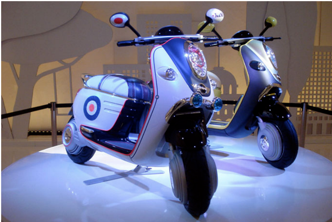
Presentación de la moto MINI