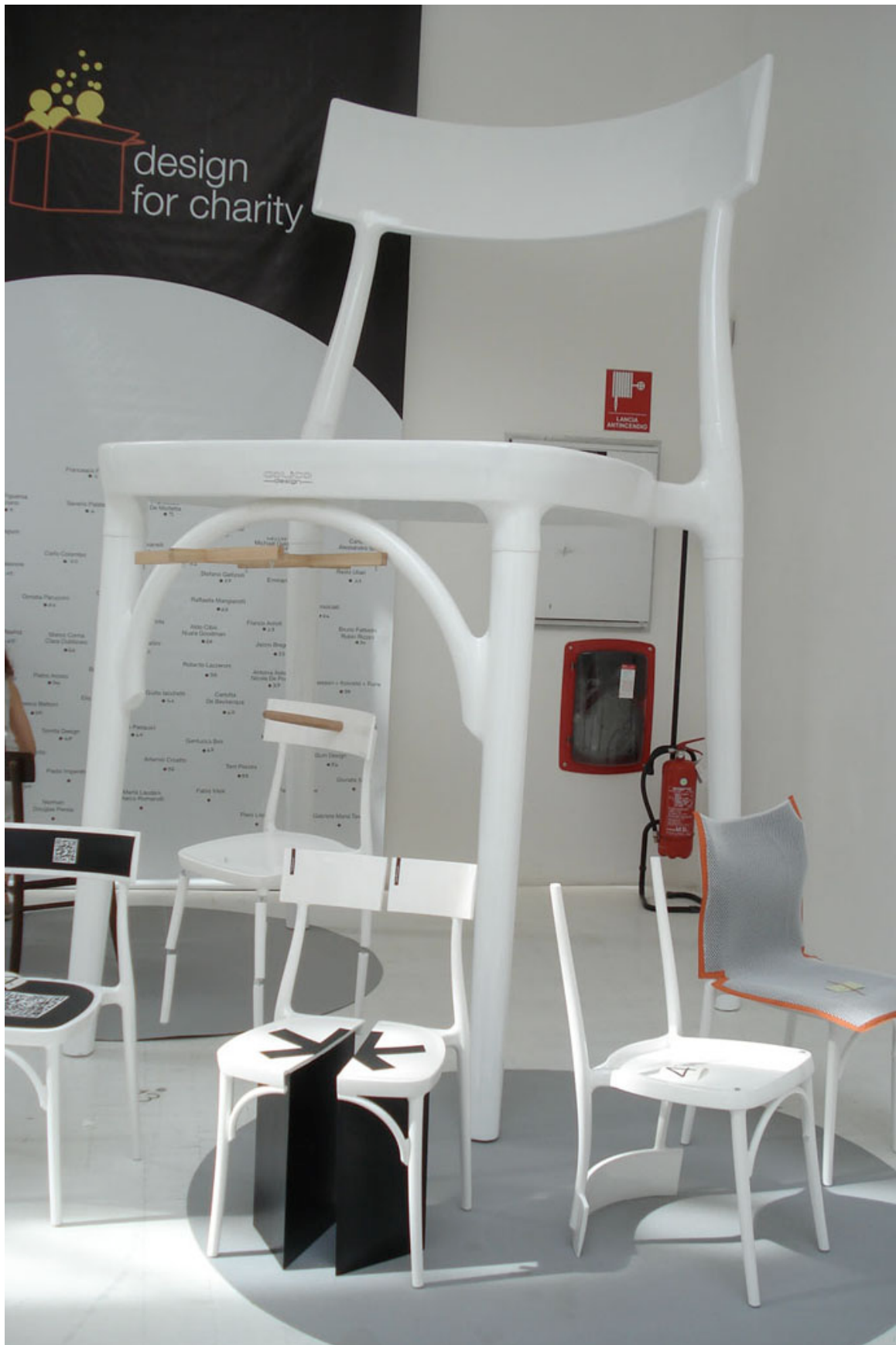
Interpretación de una silla, a cargo de una selección de diseñadores Design for Charity