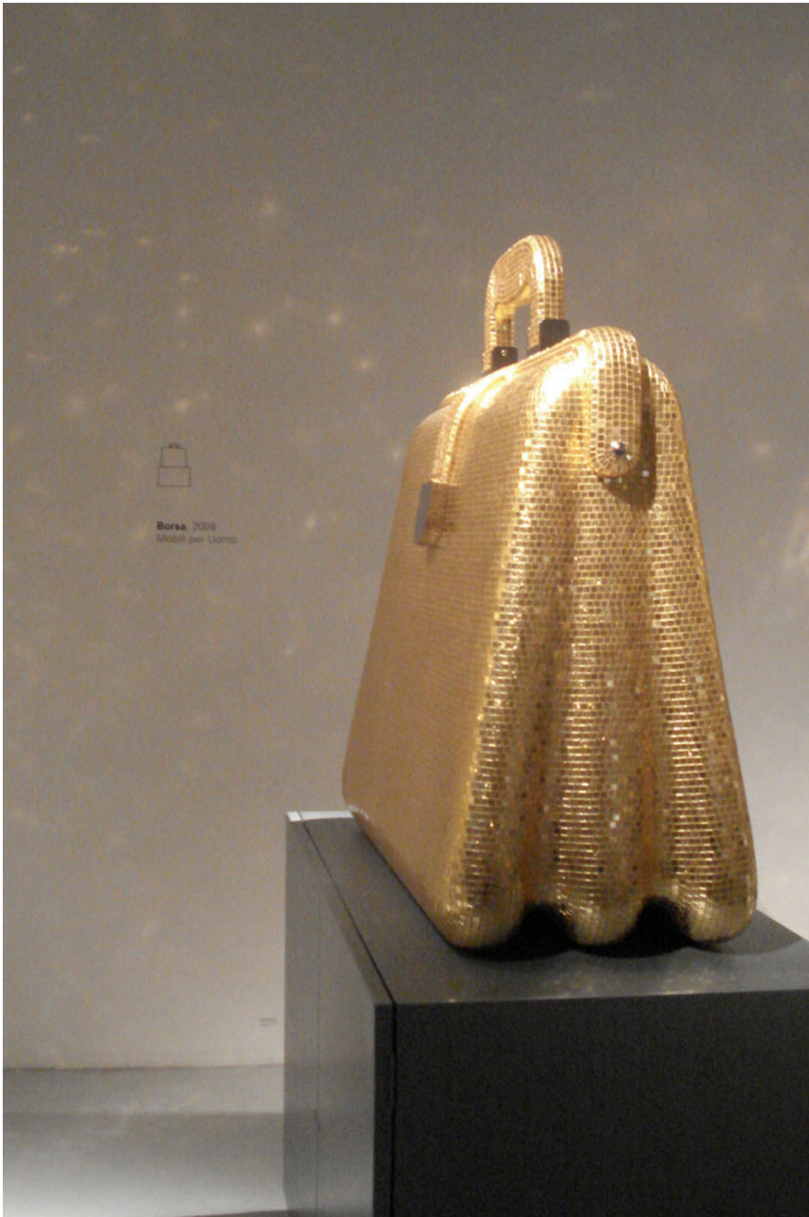
Borsa , acabado en tesela de oro 2008