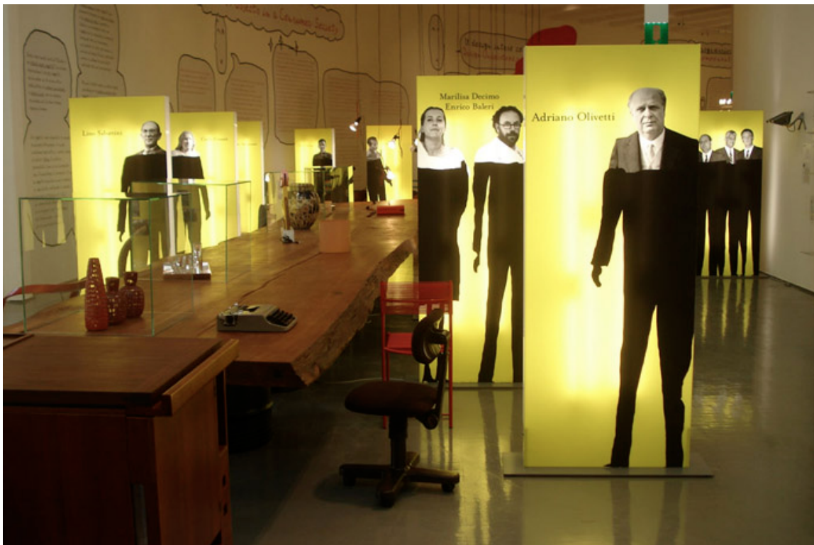
Un ángulo de la muestra Le fabbriche dei sogni . Triennale Design Museum