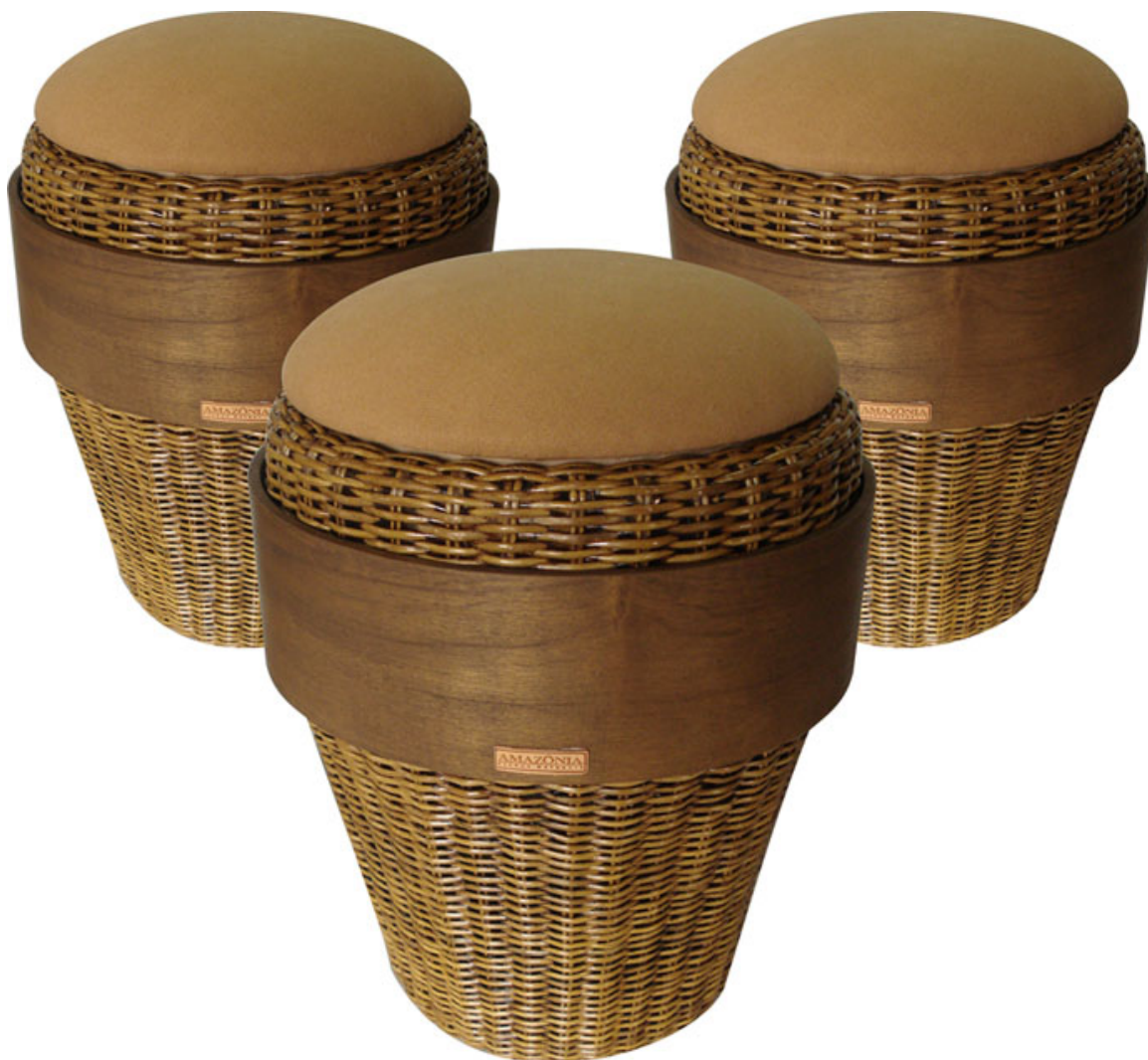
Yanomami . Sergio J. Matos

Taburete YANOMAMI . Tiene una fuerte conexión con las costumbres y la cultura indígenas. Su concepto ha sido desarrollado mediante el estudio de las pinturas de rostro indígena, una faja roja sobre los ojos, que es peculiar en el pueblo durante las celebraciones. Los materiales utilizados en la producción toman en consideración la idea de un producto sostenible. La estructura está hecha de apuí bejuco extraído en la región de Pará. Su extracción es beneficiosa para la naturaleza. Esta enredadera crece alrededor del árbol y finalmente lo estrangula cuando llega a un mayor desarrollo. El contorno es de mimbre acabado en barniz a base de agua. El anillo está hecho de MDF cubierto de madera. La tela es de algodón de colores, un tejido desarrollado por Embrapa-PB que ya trae el color.