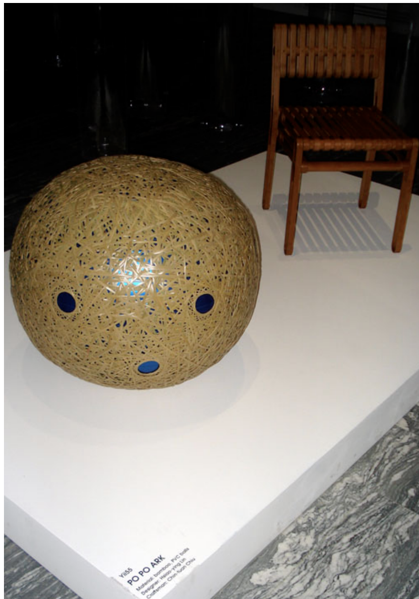
Po Po Ark , tiras de bambú sobre esfera de PVC. Diseño de Hsiao-yong Lin & manufactura de Chin-tuan Chiu