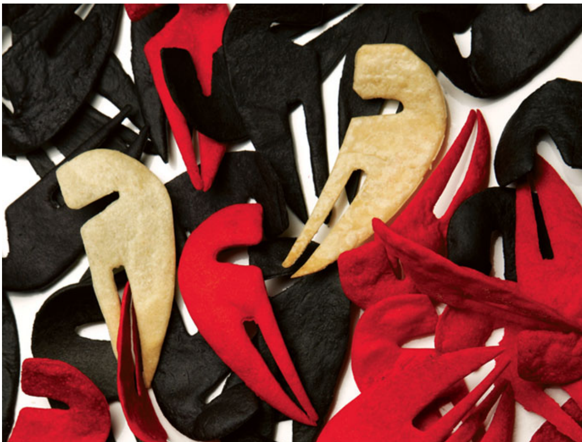
Teneo , útil de mesa comestible y complemento en la presentación de platos. Rodolfo Agrella