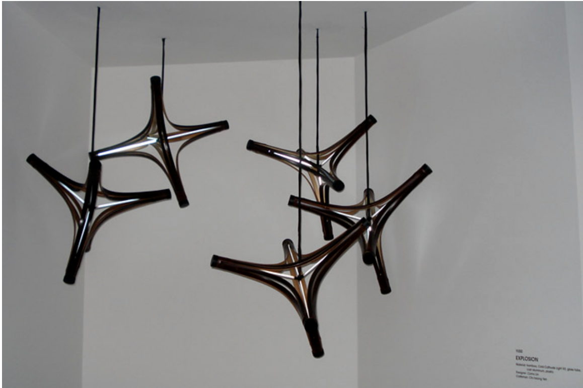
Explosion , luminaria de bambú y luz catódica. Diseño de Camo Lin & manufactura de Chi-hsiang Yeh