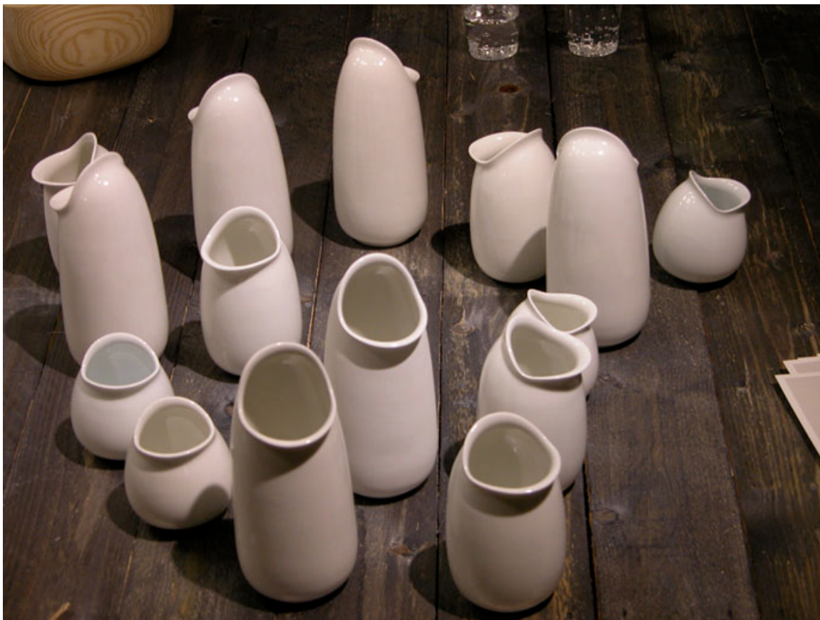
Feed me! Vesa Kattelus