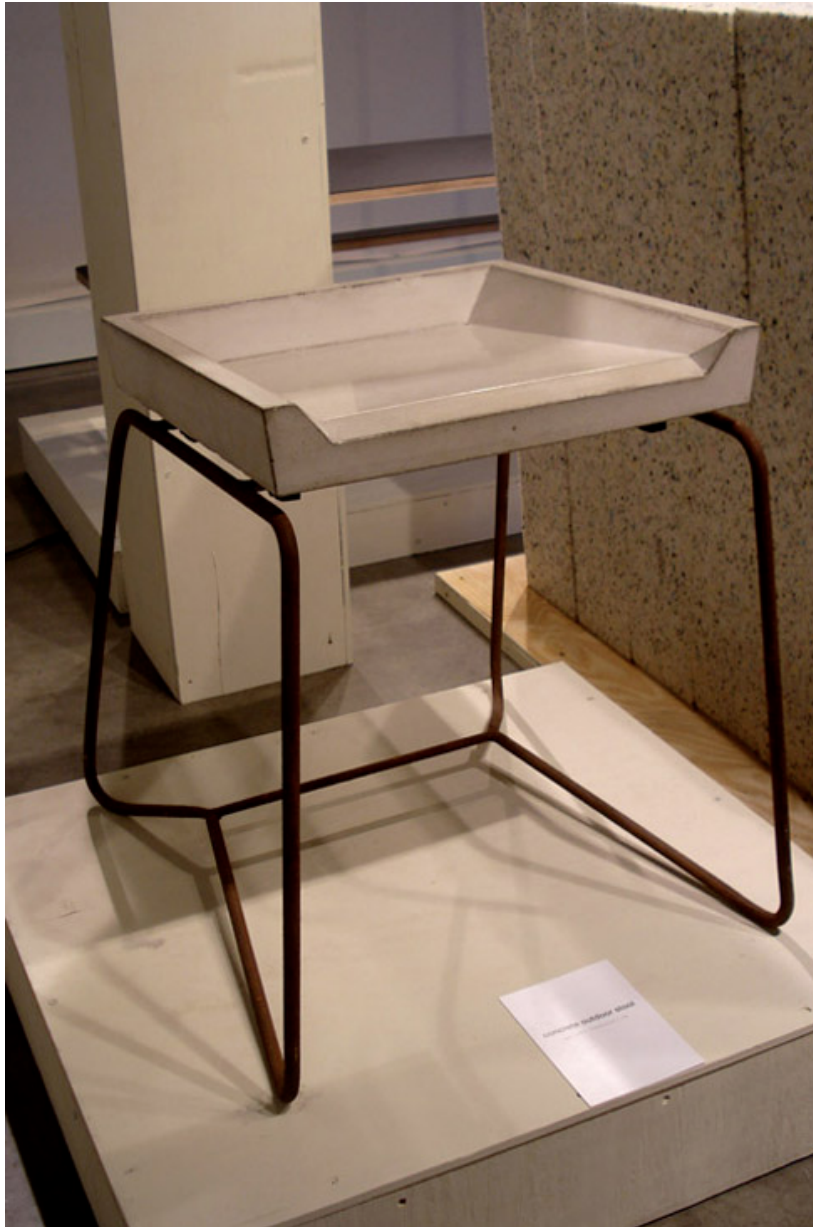
Stephan Shulz. Asiento para exterior de la Concrete Collection