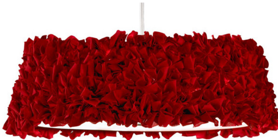
Miuu. Diseño de Arturo Álvarez 2011