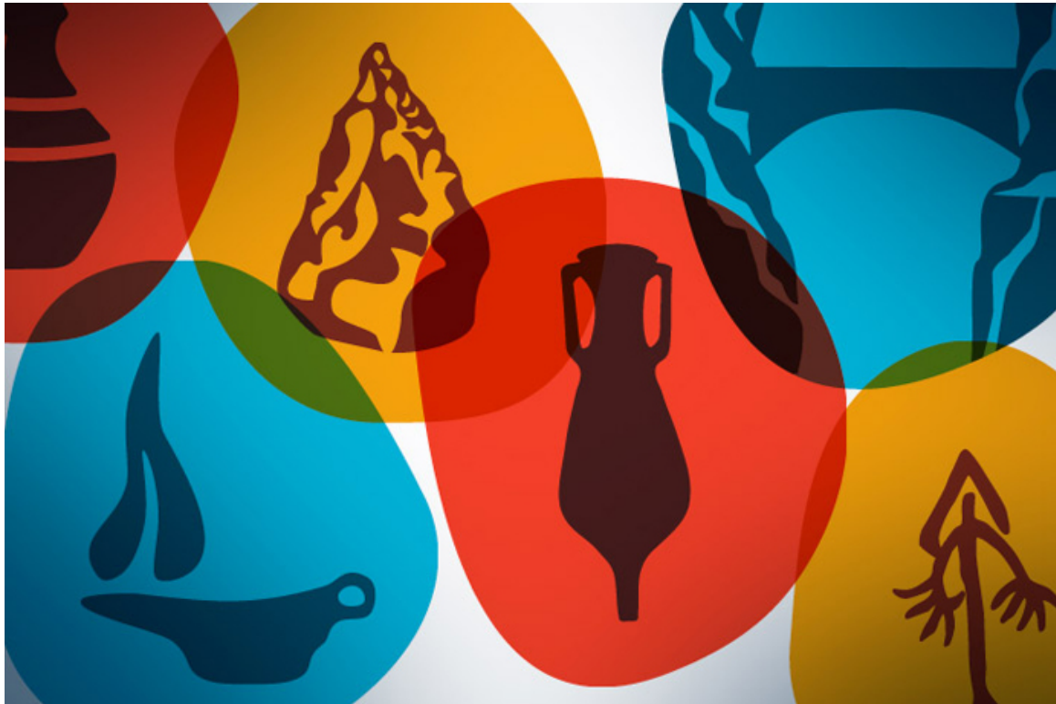
Presentación general de la iconografía a comentar.