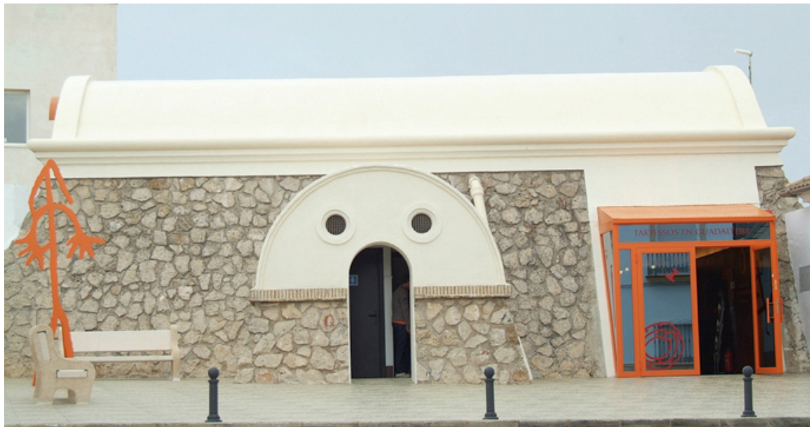
Exterior del edificio de la ruta a visitar con materialización de la simbología para ser reconocidos desde el exterior.

No siempre el diseño arquitectónico de una construcción corresponde al uso que ésta tendrá posteriormente. Esta es la causa principal de que se haya reflejado con pinturas, el caso de intentar transmitir la evocación de grabados o colocar elementos significativos en la entrada de los centros de interpretación, para así ser localizados rápidamente desde fuera a distancia desde el coche, teniendo una altura de más de tres metros. Se han respetado los colores de cada una de las rutas.