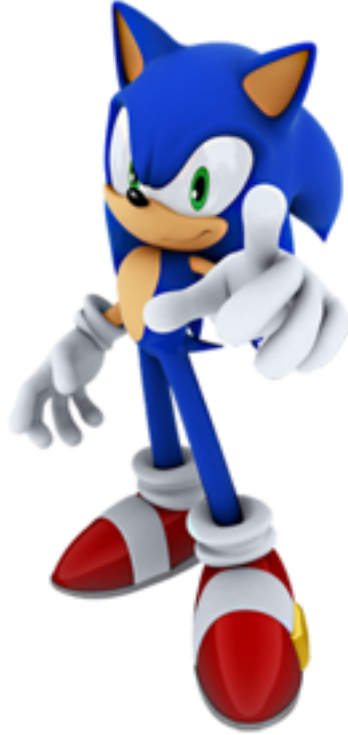
Naoto Ohshima. Sonic The Hedgehog . 1990