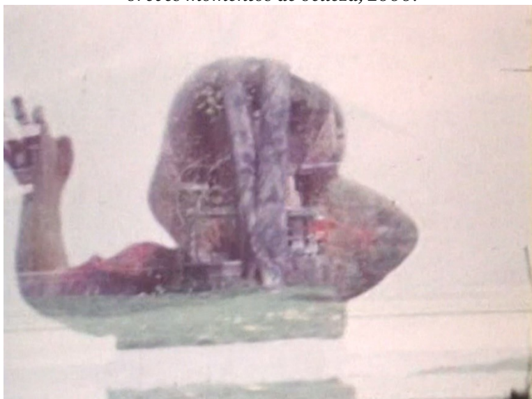
F6. Sobreimpresión del niño en el espejo. Fotograma de En el camino, de cuando en cuando, vislumbré breves momentos de belleza , 2000.