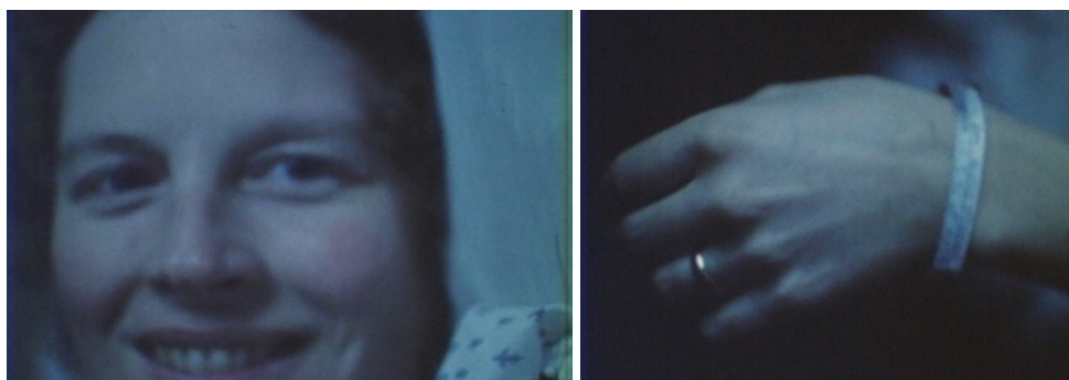
F4. Primer plano de la mujer de Mekas. Fotograma de En el camino, de cuando en cuando, vislumbré breves momentos de belleza , 2000.

intenta evocar con recursos como esa sobreimpresión, los cabeceos de la cámara o los cortes de escena manuales.