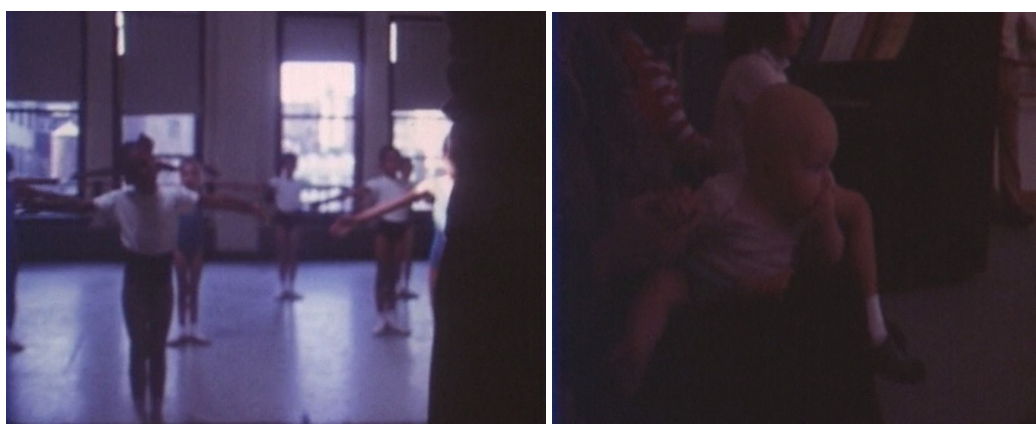
F1. Clase de Ballet. Fotograma de En el camino, de cuando en cuando, vislumbré breves momentos de belleza, 2000 .

de las jóvenes bailarinas en un plano estático con un punto de vista que casi podría ser definido como subjetivo, un componente voyeurístico en Mekas que permite a la audiencia ahondar en una memoria concreta y reflexionar sobre una vida ajena (F1). Un zoom in se dirige hacia una de las bailarinas y el espectador observa la danza durante unos cuantos segundos, una imagen rutinaria que después de un corte salta a un plano medio de un bebé observando atentamente la representación para el que la danza es una escena fascinante más que rutinaria (F2).