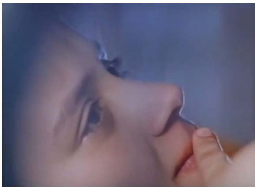
F7. Primer plano de una madre dando a luz. Fotograma de Vida , 1993

privilegiados por el director a través del montaje. La duración como corte móvil del tiempo surge cuando Mekas es capaz de expresarla en términos que trascienden los mecanismos cinematográficos. La superación de la elipsis, de las estructuras temporales y espaciales, constituye una forma de mostrar la transformación acontecida entre corte y corte con la menor injerencia posible.