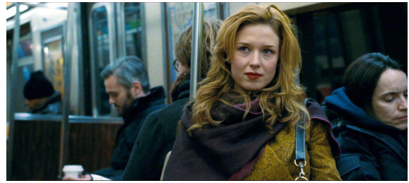
F4. Escena final ( Shame )

De esta manera lo que se nos cuenta en ambos filmes es un fragmento breve, pero crítico, de la vida de sus personajes principales delimitado por el intervalo temporal entre esos dos momentos (preliminar y postliminar). La circularidad del relato, junto con la deliberada falta de contexto biográfico y psicológico de los protagonistas, contribuye a dotar de mayor ambigüedad el desenlace de la propuesta dramática. En este sentido, la reflexión de Laura E. Tanner acerca de la novela de Ellis se puede hacer extensiva naturalmente a su versión cinematográfica: “The novel’s lack of closure, characterization and plot makes it archetypically postmodern” 21 . Pero igualmente se puede aplicar al relato que nos propone Shame .