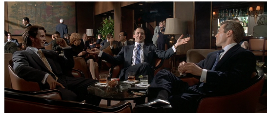
F2. Escena final ( Amer. Psycho )

Por su parte, Shame comienza y acaba con escenas simétricas de muda seducción en un vagón de metro (F3 y F4) 20 . Que en ambas escenas se trate del improbable encuentro con la misma mujer anónima en una ciudad de ocho millones de habitantes enfatiza la dirección circular de la composición narrativa. Este escenario subterráneo del metro neoyorkino asoma en otros pasajes de la película como leitmotiv de reminiscencia infernal, por lo que por su recurrencia y función significativa sería el equivalente en Shame de los exclusivos locales de moda que figuran en American Psycho .