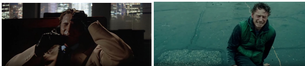
F7. Desolación de Bateman ( Amer. Psycho ) F8. Desolación de Sullivan ( Shame )

f) El primer plano del desquiciamiento psicológico de Bateman, tirado en el suelo de su oficina, halla su perfecto paralelo en uno de los planos finales de Shame , que muestra la devastación emocional de Sullivan, derrumbado en el muelle del río Hudson (F7 y F8).