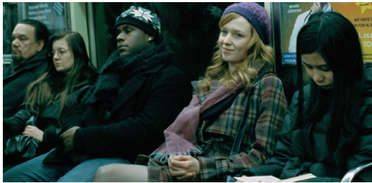
F3. Escena inicial ( Shame )