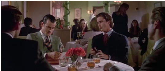
F1. Escena inicial ( Amer. Psycho )

American Psycho , la película, comienza y acaba con sendas escenas de inane conversación entre colegas yuppies 18 ambientadas en uno de los locales elitistas de Manhattan que son su codiciado objeto de deseo a lo largo del metraje (F1 y F2). Estos hiperlujosos restaurantes y clubs, hábitat natural de esta casta de cachorros privilegiados, funcionan como símbolo diferenciador y excluyente de su estatus social y económico vinculado al triunfo del sistema capitalista neoliberal de la década de los ochenta amparado por los teóricos de la Escuela de Chicago 19 .