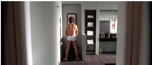
F5. Bateman en el baño ( Amer. Psycho )

a) El paseo de Brandon desnudo por su apartamento en el arranque de Shame es una reescritura literal (acaso con deliberada función programática) de la secuencia también inicial de American Psycho . Ambas escenas acaban con un encuadre idéntico: un plano figura con la imagen del protagonista al fondo, de espaldas, mientras orina en el baño con la puerta abierta, índice del grado de comfortable independencia y autosuficiencia en la que se hallan instalados (F5 y F6).