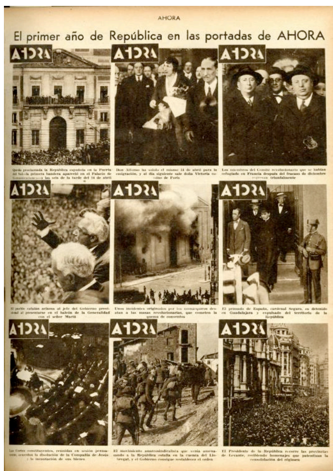
F2. Resumen de las portadas, 10 de abril de 1932.