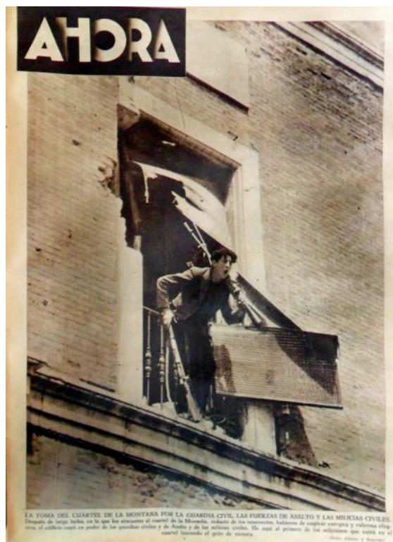
F4. Portada, 21 de julio de 1936.

Montaña, realizadas en su mayoría por Albero y Segovia, más Yusti y Marina (F4). Las fotos del día 22, 17 de ellas de Albero y Segovia, son extraordinarias por su calidad, riqueza informativa y cercanía, sobre los frentes de la sierra de Madrid, Guadalajara y Toledo.