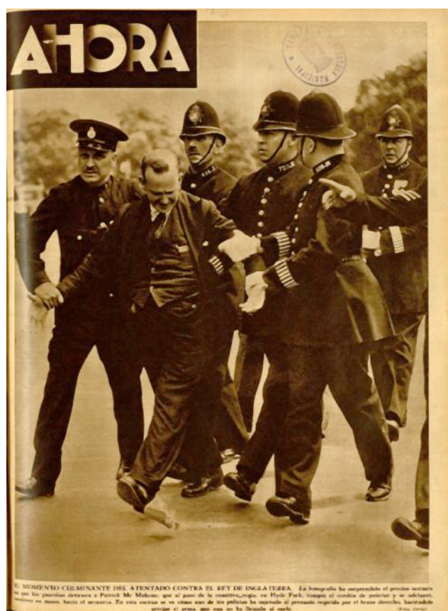
F3. Portada, 18 de julio de 1936.