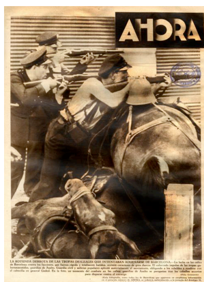
F7. Portada, 29 de julio de 1936.