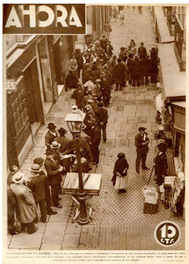
F1. Portada, 16 de abril de 1931.

Mena (Oviedo), Arenas y Mateo (Murcia), Pacheco (Vigo), Blanco (La Coruña), Carte (San Sebastián), Iglesias (Cádiz), Muro (Logroño) y Samot (Santander). Por tan extensa relación se observa la intensa actividad para cubrir la información política. La de extranjero se encargó a las agencias Trampus y Keystone (F1).