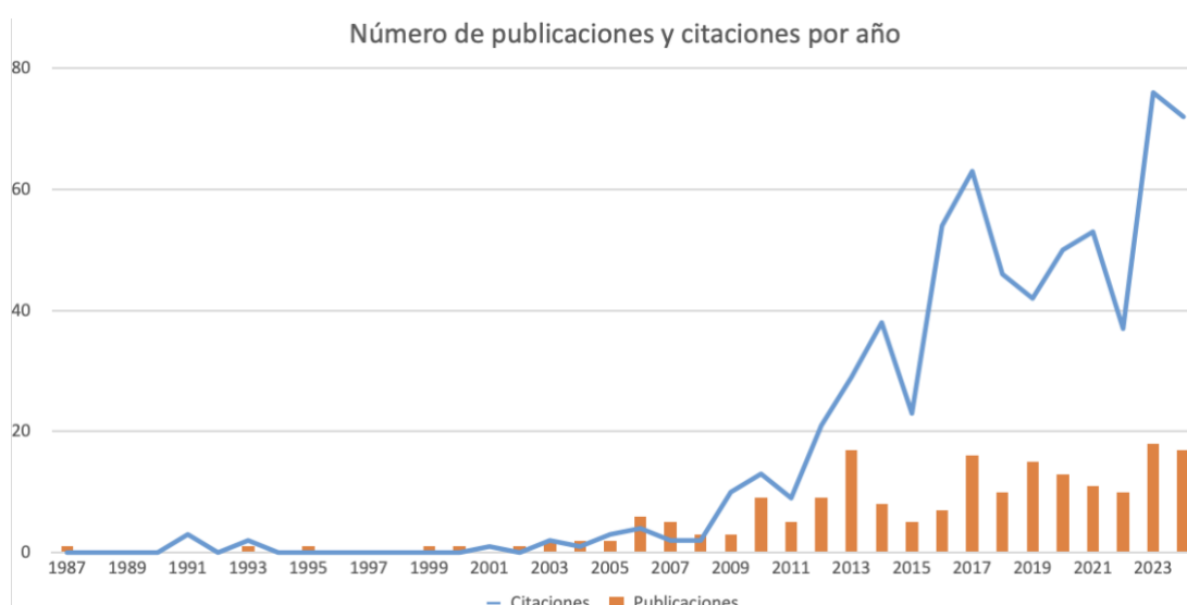
F8. Evolución de las citas entre 1987-2024 (relación documentos y citación). Fuente: Elaboración propia (Scopus).