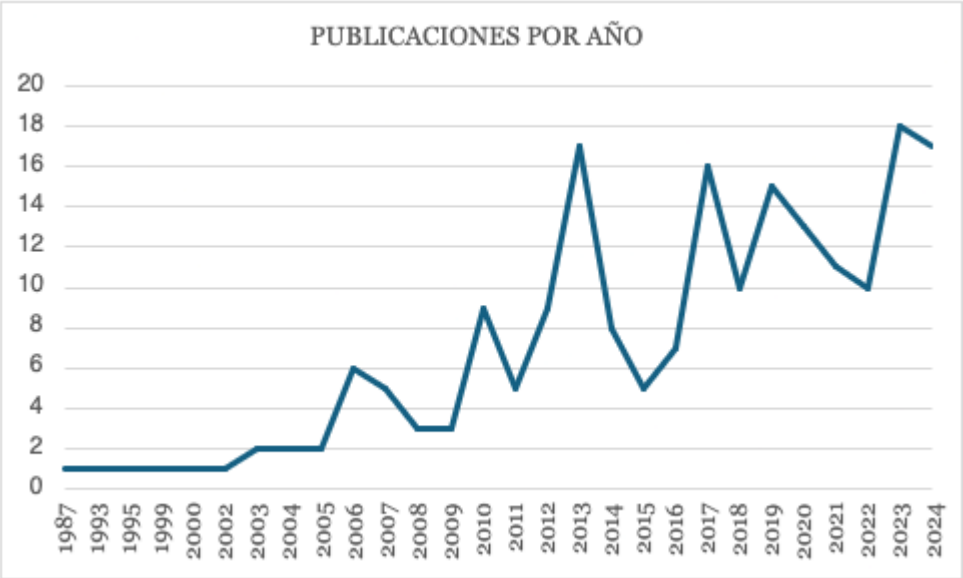
F3. Número de publicaciones por año.

por los hermanos Almodóvar, apostó por diversificar la producción y produjeron una serie de ficción para televisión (Zurian, 2017): Mujeres (2006).