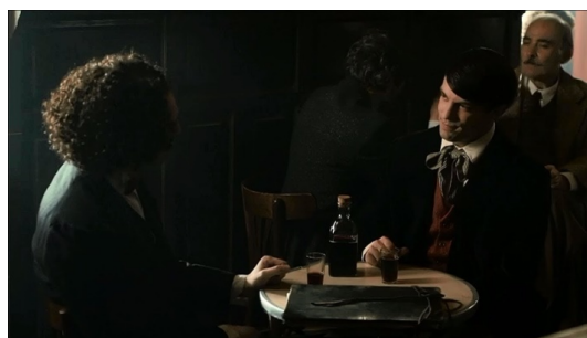
Fotogramas de la Serie El Ministerio del Tiempo. Encuentro de Diego Velázquez con Pablo Picasso (Temporada 1) y Francisco de Goya (Temporada 3).