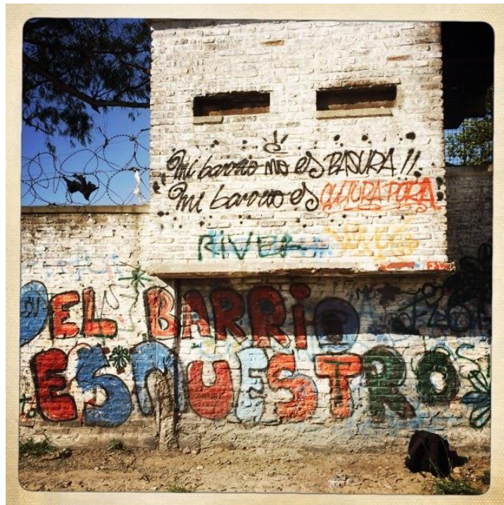
1. Imagen del mural durante la jornada “Mi barrio no es basura”.

Otro de los itinerarios en el marco de la Biblioteca, es el ciclo anual de graffitis «Mi barrio no es basura» que justamente busca visibilizar un reclamo vinculado a la contaminación y violencia ambiental que día a día atraviesan los/as carcoverños/as; así como, las formas complejas de vincularse con la basura, ya que para muchos de ellos es un medio de supervivencia y de trabajo [1] mientras que, para otros, remite a la contaminación y afección corporal que produce. Esta jornada de pintada es colectiva y, previo y durante la pintada, se van conversando aquellas cosas que se quieren hacer (qué pintar, en dónde, con qué colores); todo esto implica una reflexividad que se ejerce en la práctica. En efecto, estas experiencias locales constituyen una «arena» o «arenas culturales», es decir, lugares de confluencia, desmarcamiento y también de diálogo y disputa. Como una suerte de intersticio entre lo que deja huella y lo que se borra.