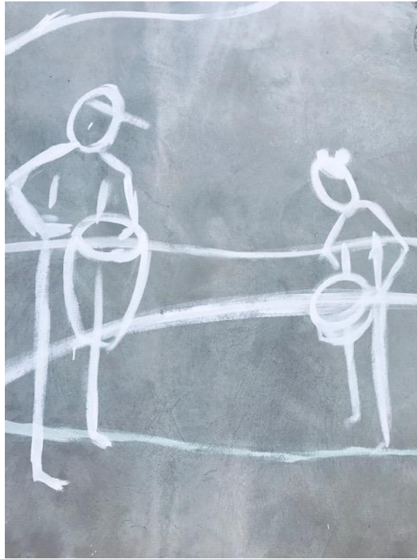
3. Boceto en la pared. La musicalidad colectiva.