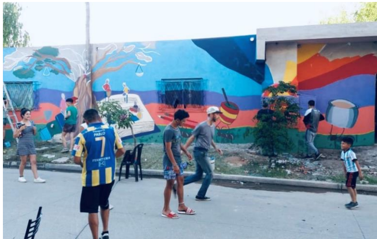
4. Imagen del devenir del evento.