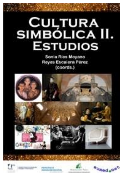
[Fig. 2]: Portada del Libro Cultura simbólica II. Estudios . 2017

Siete de estos trabajos fueron publicados en un nuevo libro titulado Cultura simbólica II. Estudios (2017) con una nueva “Presentación” del doctor Sánchez-Lafuente [2].