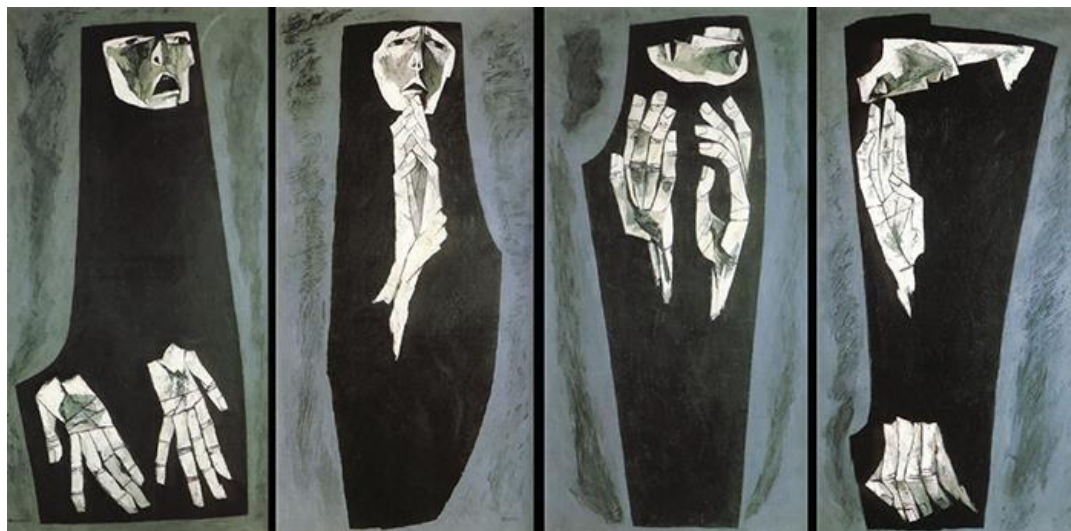
5. Oswaldo Guayasamín, Mujeres llorando IV-VII , serie La edad de la ira , 1963-1965. Óleo sobre lienzo. 145 x 75cm. cada uno.