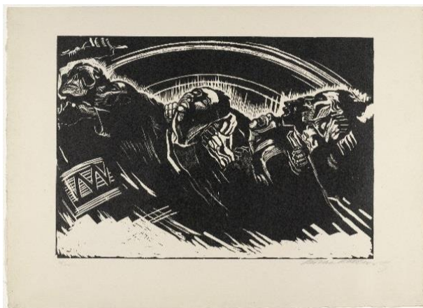
4. Käthe Kollwitz, Die Freiwilligen (Los voluntarios), estampa #2 de la serie Krieg (Guerra), publicada en 1923. Xilografía, 47.5 x 65.4 cm.

a combatir al ritmo del tambor de la muerte, mientras un grupo de mujeres intenta desesperadamente evitar que emprendan ese viaje quizás sin retorno (Bassie, 2006: 124).