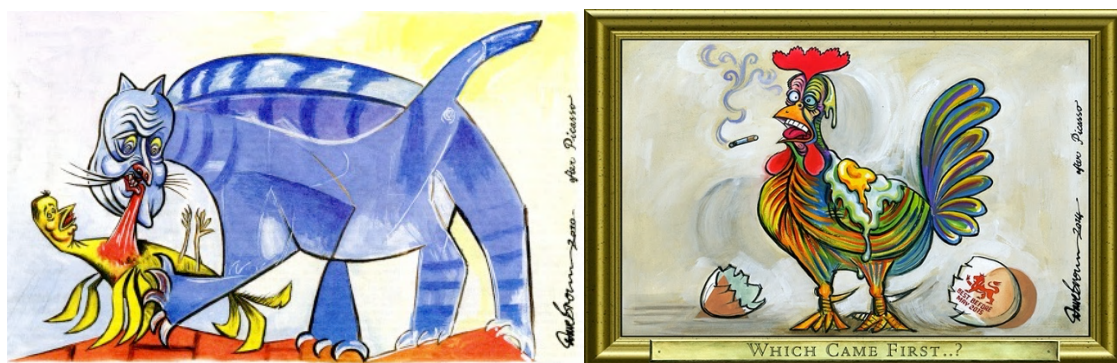
Fig. 4: 4a. Dave Brown, «Cat Seeking Consensus with a Bird». The Independent , 22 de mayo de 2010. Fotografía: British Cartoon Archive; 4b. Dave Brown, «Which came First...?», The Independent , 3 de mayo de 2014. Fotografía: cedida por D. Brown © Sucesión Pablo Picasso, VEGAP, Madrid, 2023

La primera de ellas es «Cat Seeking Consensus with a Bird», publicada en The Independent el 22 de mayo de 2010. Se sirve Brown de Gato devorando un pájaro (1939) 11 , en el que el felino sostiene entre sus fauces un ave herida, «tema que me obsesionó, no sé por qué», reconocerá más tarde Picasso. Se convierte en un símbolo del conflicto y la violencia de la guerra, reflejo de su actitud hacia la Guerra Civil y premonición del horror de la Segunda Guerra Mundial; como significa el pintor malagueño: «No pinté la guerra, porque no soy el tipo de artista que dibuja lo que ve, como los fotógrafos. Pero, sin duda, la guerra está presente en los cuadros que pinté en ese momento» (Rosenblum, 1998, pp. 51-52). Tal realidad no pasará desapercibida a Rafael Alberti en su poemario Los 8 nombres de Picasso (1966-1970): «Un gato enmascarado hinca la garra a un pájaro y lo come» (López Martínez, 2020, p. 112).