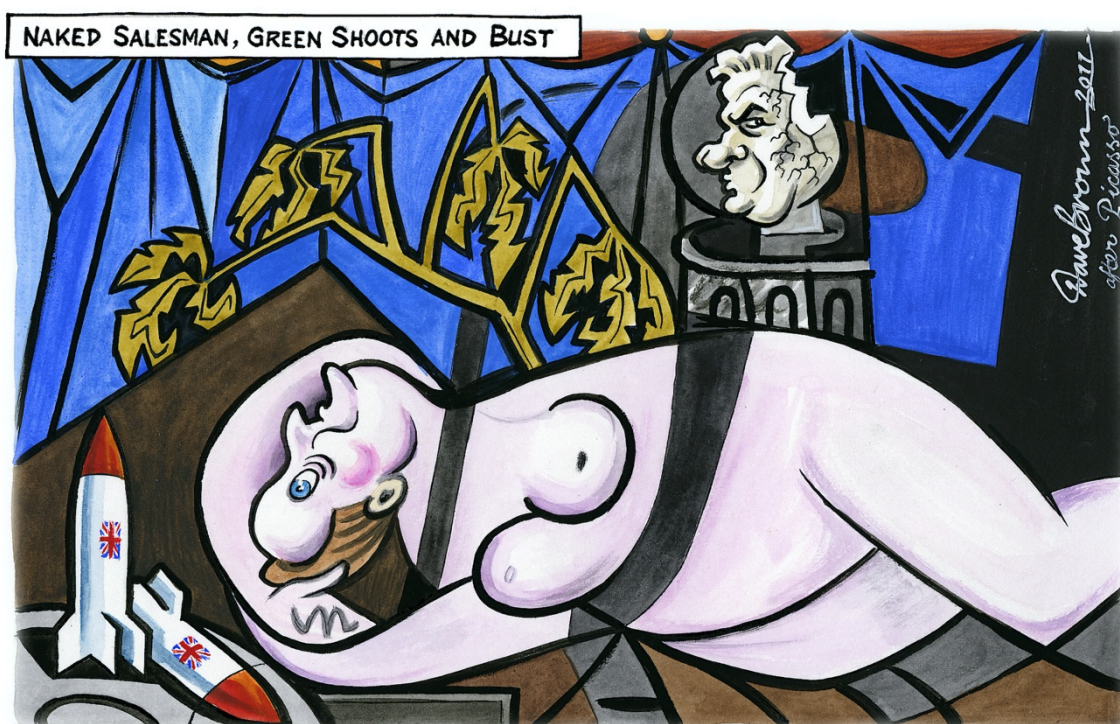
Fig. 3: Dave Brown, «Naked Salesman, Green Shoots and Bust». The Independent , 8 de marzo de 2011. Fotografía: cedida por D. Brown © Sucesión Pablo Picasso, VEGAP, Madrid, 2023

Una nueva referencia picassiana aparece en la caricatura «Naked Salesman, Green Shoots and Bust» [Fig. 3], publicada en The Independent el 8 de marzo de 2011, para la que Dave Brown se sirvió de Desnudo, hojas verdes y busto (1932) 10 . Esta obra forma parte de una serie de retratos en los que Picasso representó a su musa y amante Marie-Thérèse Walter en 1932, año calificado de extraordinario en sus biografías, con un deslumbrante conjunto de desnudos y bodegones de rica gama cromática que exploran su extraordinaria creatividad en el período de entreguerras. Protagoniza la composición el cuerpo desnudo de Marie-Thérèse, en posición reclinada y con los brazos tras la cabeza, acompañada de una planta de filodendro y de un busto escultórico (Cowling, 2016, pp. 132-134; Clark, 2018). La obra, conocida como el «Picasso perdido» porque tan solo se exhibió en una ocasión en 1961, se convirtió en 2010 en la más cara de la historia vendida en una subasta (Press Release Christie's, 4 de mayo de 2010).