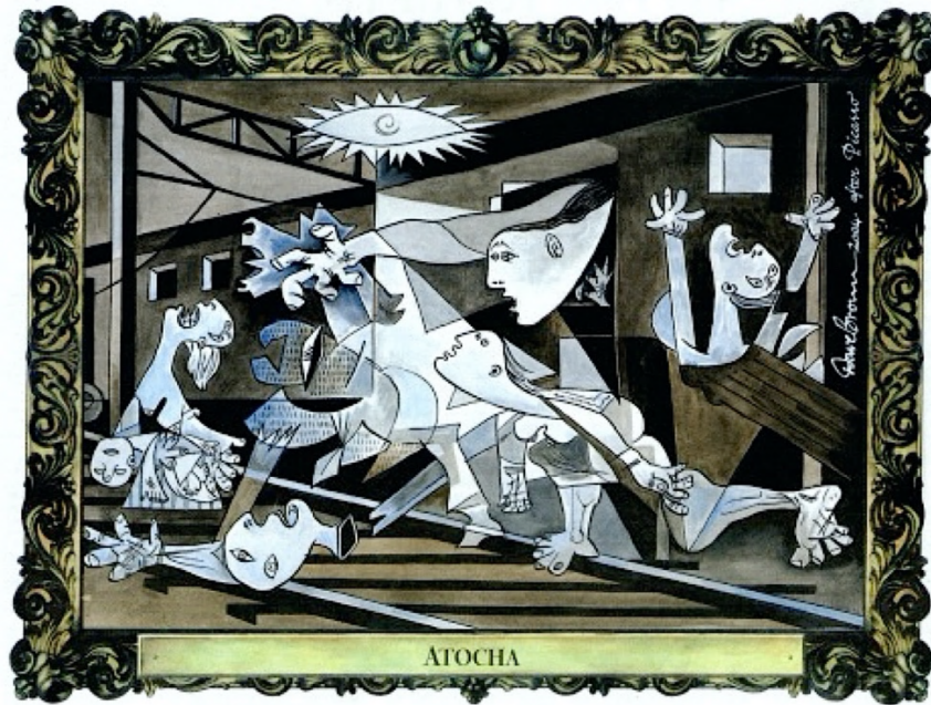
Fig. 5: Dave Brown, «Atocha». The Independent , 13 de marzo de 2004. Fotografía: British Cartoon Archive © Sucesión Pablo Picasso, VEGAP, Madrid, 2023

Un planteamiento similar adopta Dave Brown en «Barcelona», caricatura publicada el 18 de agosto de 2017 en The Independent [Fig. 6], condenando el atentado perpetrado por una célula yihadista el día anterior en el paseo de La Rambla de Barcelona —al que siguió otro atentado en Cambrils—, que provocó 15 muertos y 131 heridos. Una furgoneta blanca recorrió 530 metros de la zona central del paseo barcelonés, causando un atropello masivo. Esa misma tarde, el Estado Islámico reivindicó la autoría de los ataques, justificados por «los llamamientos a golpear a los países de la coalición», en referencia a la alianza internacional que luchaba contra ese grupo yihadista en Iraq y Siria (Bourekba, 2018; Igualada Tolosa, 2018).