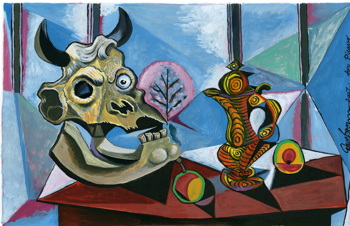
Fig. 2: Dave Brown, «Nature mort». The Independent , 11 de agosto de 2007. Fotografía: cedida por D. Brown © Sucesión Pablo Picasso, VEGAP, Madrid, 2023

las cabezas de toro hacen acto de presencia en las naturalezas muertas plasmadas con colores sombríos, como reflejo del ánimo del pintor que se deja entrever a través de sus vanitas , de larga tradición en la pintura española. La obra expresa su desesperación por medio del cráneo de toro cubierto de carne en descomposición como símbolo de la brutalidad. En medio del horror y la angustia, un árbol en flor brota a la luz de la luna, sugiriendo la esperanza del renacer de la democracia en España (Boggs, Léal & Bernadac, 1992, pp. 258-259; Bozal Chamorro, 2014, pp. 167 y 170-171; Robinson, 2020, pp. 218-219).