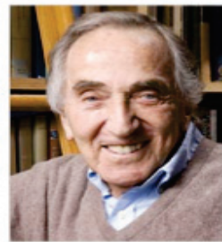
Leslie Orgel (1927-2007)