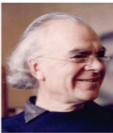
Peter Mitchell (1920-1992)

cosas rara vez son del todo blancas o del todo negras. Afortunadamente, lo que cuenta es la ciencia y no los científicos, y de la primera se dice que es auto-correctiva, aunque a veces realizar la corrección lleve décadas.