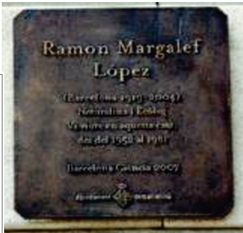
Figura 7: Placa municipal en recuerdo de Ramón Margalef colocada en enero de 2008 en la fachada de la que fue su casa en Ronda del Guinardó 31 (Barcelona).