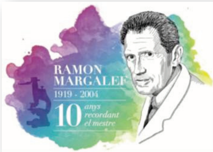
Figura 9: Cartel de los actos de homenaje a Ramón Margalef por las Universidades de Barcelona y Girona en el décimo aniversario de su fallecimiento.