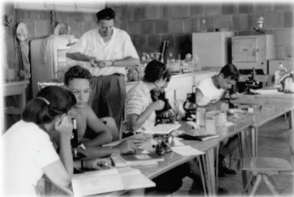
Figura 5: Ramón Margalef dando clases de prácticas (reproducido de F. Peters. Limnology and Oceanography Bulletin 19(1): 2-15, 2010)