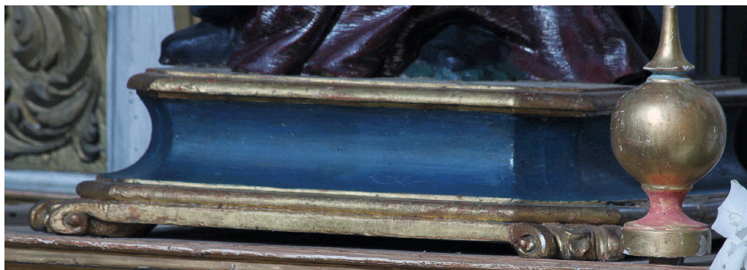
6. Luis Salvador Carmona (atribución), Nuestra Señora de los Dolores , 1730 (detalle de la peana). Escorial, iglesia parroquial

Cristo en expiración ladea ligeramente la cabeza a la izquierda y mira hacia lo alto, con una expresión más implorante que dramática [8]. La boca entreabierta deja ver la lengua y los dientes de pasta. La mirada es intensa, de súplica, con los ojos de cristal (reimplantados en 1964 los de la talla escoriallega) y las cejas ligeramente arqueadas. El rostro está demacrado, con las mejillas hundidas, los pómulos resaltados, las cuencas oculares muy apuradas para enfatizar los ojos y