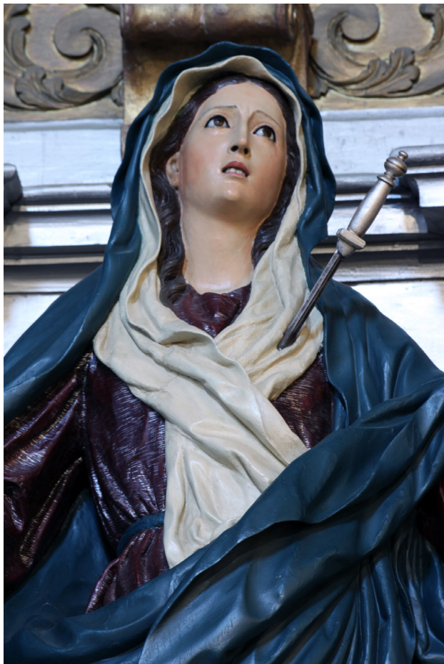
5. Luis Salvador Carmona (atribución), Nuestra Señora de los Dolores , 1730 (detalle del rostro). Escorial, iglesia parroquial

contrario. La Virgen apoya sobre una peana [6] que repite el modelo que el artista tomó de su maestro y empleó sobre todo en su primera etapa: una base ochavada que asienta sobre cuatro volutas y se compone de una ancha escocia en tono azul liso y dos toros estrechos y dorados. Es idéntica