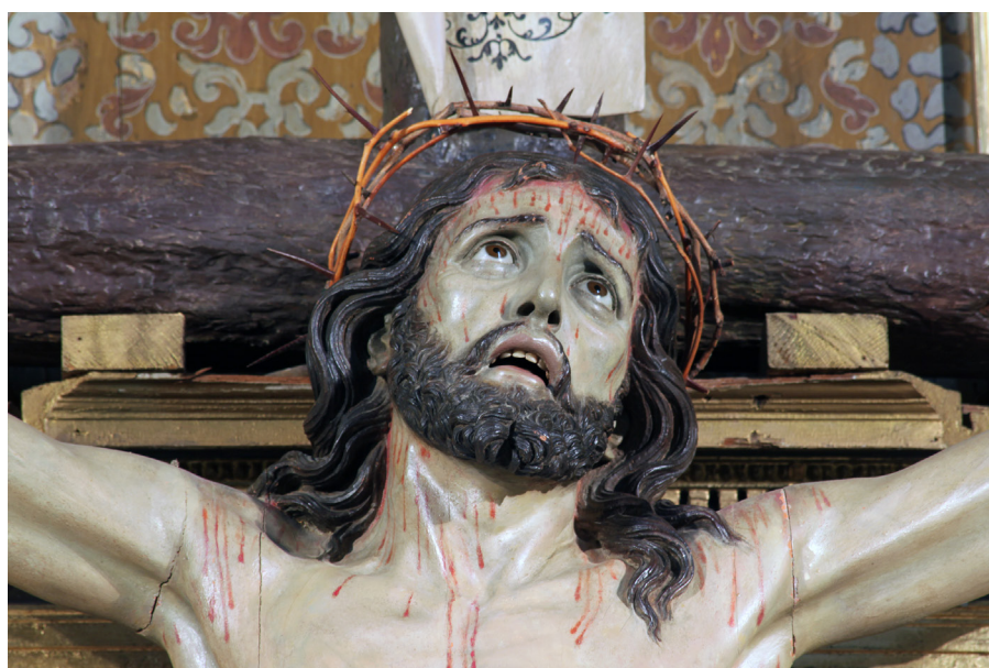
8. Luis Salvador Carmona (atribuido), Cristo del Desamparo , 1732 (detalle del rostro). Escorial, iglesia parroquial

mada a base de cuidados mechones ondulados, trabajados en vertical, y suavemente partida en el extremo del mentón; los bigotes van caídos, como es habitual en Carmona. La cara así tratada recuerda inevitablemente las efigies del Cristo del Perdón que hará para La Granja (1751), Atienza (1753) y Nava del Rey (1755), o los Nazarenos de El Real de San Vicente (c.1755) y La Bañeza (c.1755-1760).