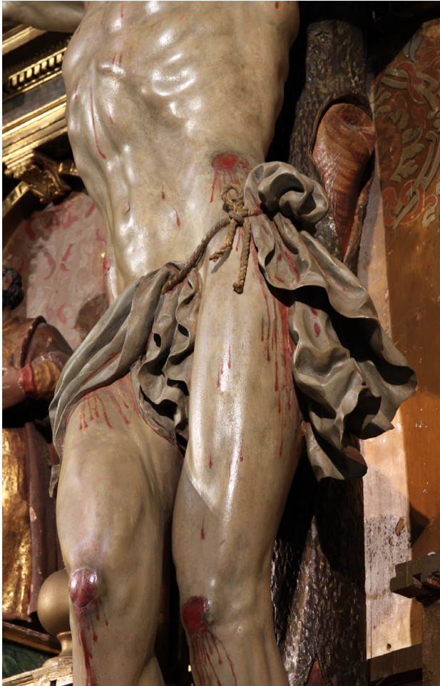
9. Luis Salvador Carmona (atribuido), Cristo del Desamparo , 1732 (detalle del perizoma). Escorial, iglesia parroquial

La postura del cuerpo es idéntica en ambos Crucificados. El desplazamiento de la cadera hacia el lado izquierdo rompe la vertical y es fruto de la respuesta natural del cuerpo a la fórmula empleada para colocar las piernas, con la izquierda situada bajo la derecha y el pie de aquella formando una suave curva que se irá acentuando a medida que avance su producción, fruto de ir sujetos ambos pies con un solo clavo. De forma consecuente a esta posición, y de estar suspendido de la cruz, el cuerpo se inclina para arquearse por el costado izquierdo y dibujar una suave línea serpentina de inevitable recuerdo miguelangelesco, que se acentúa con el canon alargado de las figuras y se hace más evidente en Escorial; de ahí que el arco torácico esté muy marcado, con el recto abdominal tenso y trabajado a la perfección, más mór-