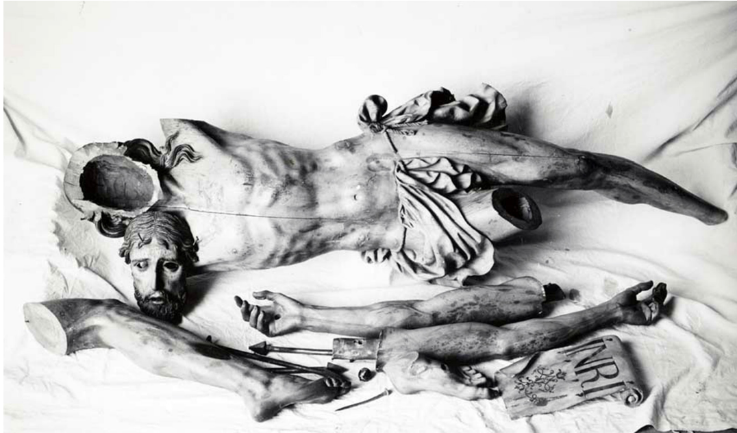
10. Fotografía del Cristo de Escorial desmontado, previa a la restauración de 1964. Fototeca IPCE, sign. BM 32/10

se estandarizó un modelo que se proyectó hasta el siglo XVIII (Estella, 1984: cat. n.ºs 62, 72, 86; 40 o 163) y que remitía, en última instancia, al conocido dibujo de Miguel Ángel para el Cristo de Vittoria Colonna (British Museum, 1538-1541), del que Vasari sustanció la novedad que suponía representarlo vivo y a cuya difusión contribuyeron el grabado de Giulio Bonasone y los dibujos donde se copió.