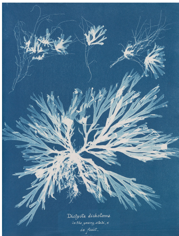
7. Anna Atkins, Dictyota dichotoma , 1849-1850