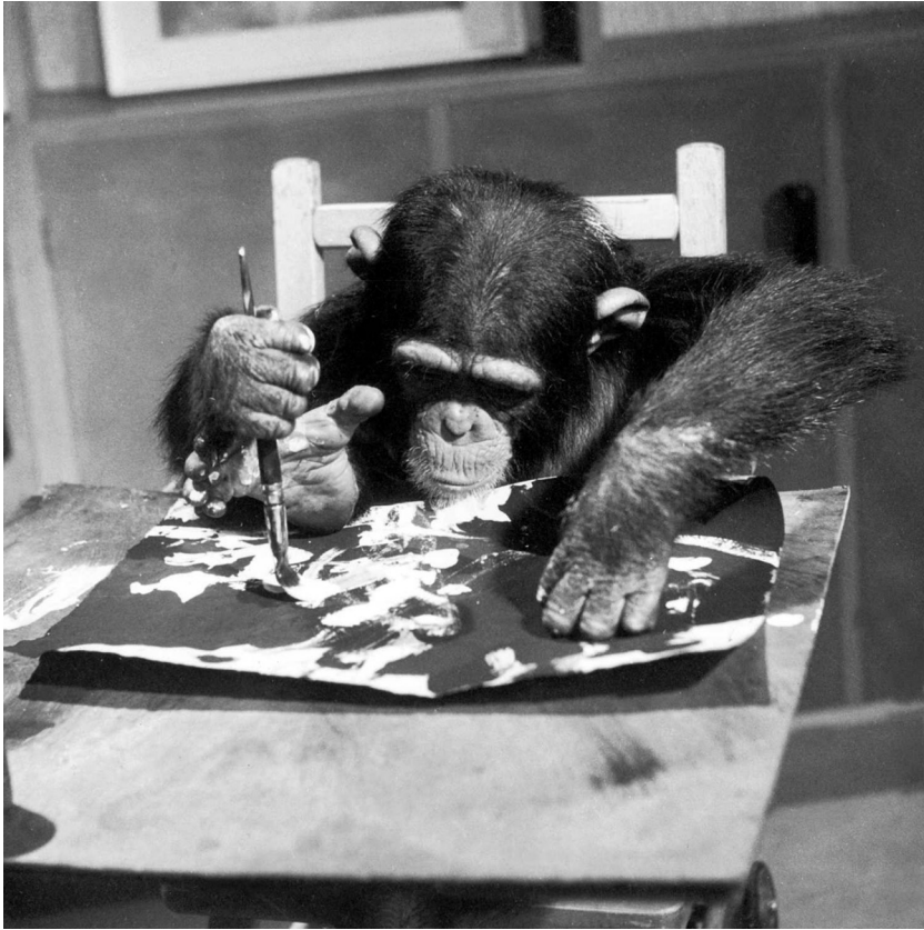
6. Congo, el chimpancé pintor

Boletín de Arte, n.º 40, 2019, pp. 219-229, ISSN: 0211-8483, e-ISSN: 2695-415X, DOI: http://dx.doi.org/10.24310/Bol_Arte.2019.v0i40.5776