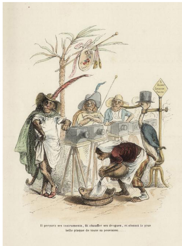
5. Grandville, Topaz, el mono retratista, Public and private life of animals , 1877

El relato de Topaz está lleno de tópicos coloniales y actúa como un marco retórico en el que el animal es un reflejo simbólico del encuentro entre la metrópoli y la otredad colonial (Denenholz, 2017: 181-200). Por un lado, destila un aire colonialista desde el momento en que el mono es vendido y trasladado a Francia donde intenta ser educado para abandonar su estado salvaje original, una historia que recoge el tópico del buen salvaje que intenta ser civilizado. Allí, la educación se basa en el aprendizaje como artista y la mención a Juan de Pareja, el esclavo de Velázquez, no es anecdótica pues se trata de un individuo morisco que aprendió el oficio con Velázquez y consiguió dedicarse a la práctica de la pintura. La comparación no es trivial pues implica una distinción de clase por la que un esclavo puede alcanzar la condición de pintor por medio del aprendizaje por lo que se plantea una situación que es especular con la del mono Topaz, pues nos habla de un animal que alcanza la condición de artista. Esta historia encierra una moraleja sobre las aspiraciones sociopolíticas de las clases medias y bajas de la sociedad decimonónica que anhelaban un ascenso en su consideración social que queda expresado por medio de una fábula con animales (Ritvo, 1987: 21-30) y, de modo concreto, con un mono que aspira a ser artista que, además, viene de las colonias. El fatal destino de Topaz, sin embargo, advierte sobre la imposibilidad de tales pretensiones y refuerza