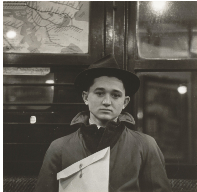
9. Walker Evans, Subway portraits , 1938-1941