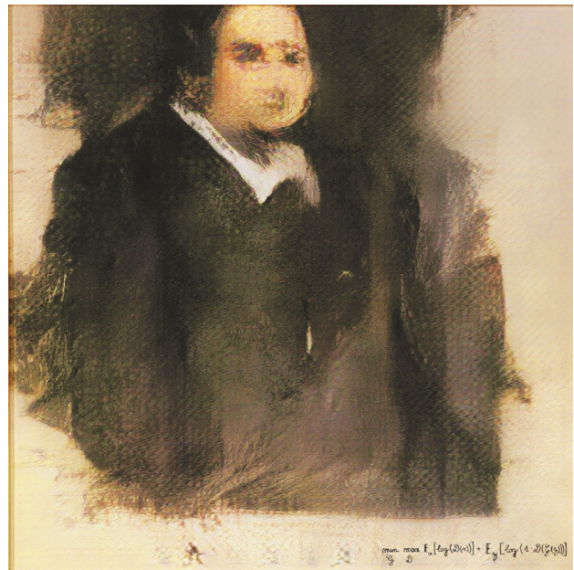
10. GAN, Retrato de Edmond de Belamy , 2018