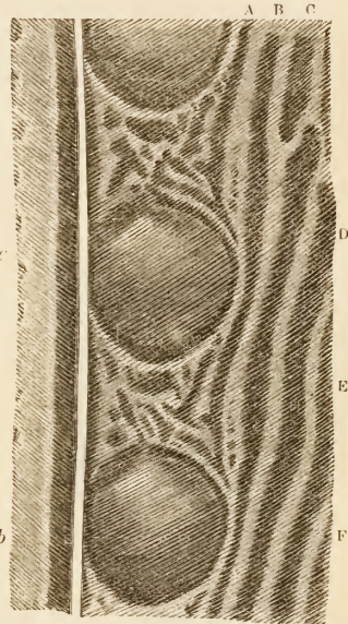
Fig. 57. Part of secondary wing-feather of Argus pheasant, shewing two perfect ocelli, a and b . A , B , C , D , &c., are dark stripes running obliquely down, each to an ocellus.

little breaks have an important meaning. The ring is always much thickened, with the edges ill-defined towards the left-hand upper corner, the feather being held erect, in the position in which it is here drawn. Beneath this thickened part there is on the surface of the ball an oblique almost pure-white mark, which shades off downwards into a pale-lead hue, and this into yellowish and brown tints, which insensibly become