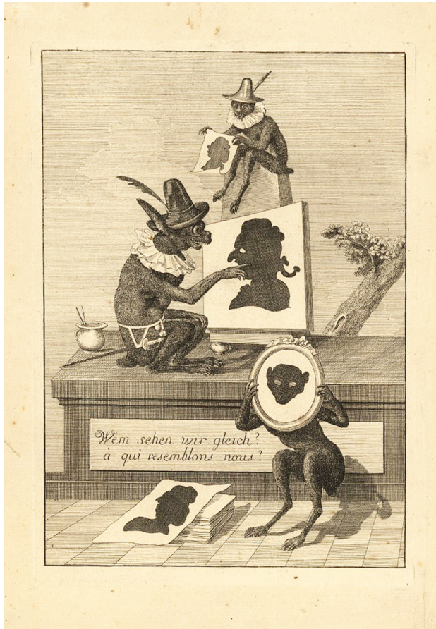
3. Anónimo, Wem sehen wir gleich? / A qui resemblons nous? , finales del siglo XVIII