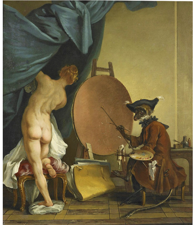
2. Jean-Baptiste Deshayes, El mono pintor , ca. 1745

El selfie de Naruto es un eslabón más de la tradición cultural y visual que ha representado al mono como artista o como hacedor de imágenes por medio de la práctica de la pintura o de la escultura. El mono ha sido, desde la antigüedad clásica, un emblema de la imitación y, por consiguiente, de los pintores o escultores que con su oficio se esmeraban por imitar a la naturaleza (Janson, 1976). El adagio ars simia naturae condensaba las valoraciones que filósofos de la antigüedad, Padres de la Iglesia y humanistas italianos realizaron sobre la imitación de la naturaleza, una comparación que comienza a visibilizarse en imágenes a partir del siglo XV y a ser motivo de especulación en la teoría humanista de la pintura. El principal talento que se esperaba del pintor era que fuese, literalmente «el mono de la naturaleza» (Lee, 1982: 24). Antes de las