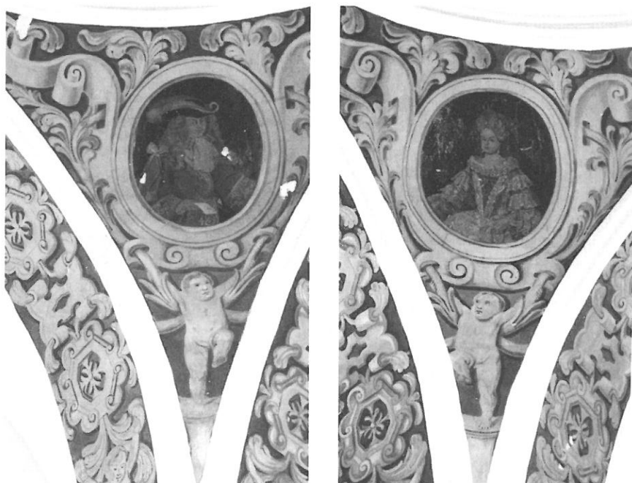
3. Pechinas de la cúpula de la ermita de Nuestra Señora de los Remedios. Retratos del Rey Felipe V y de la Reina María Luisa Gabriela de Saboya. Anónimo de principios del siglo XVIII.

dinastía y al nuevo monarca. La proclamación de la Virgen de los Remedios como patrona apenas dos días después, eliminó todas las posibles suspicacias, al convertir a su ermita en el principal templo urbano a nivel devocional y sacralizar así los actos de bienvenida a Felipe V, cuyo retrato y el de su esposa fueron colocados en las pechinas de su cúpula (Fig. 3) 43 .