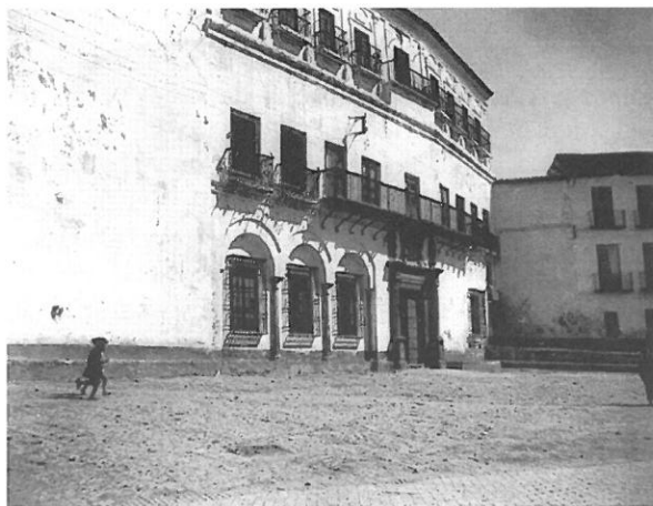
1. Plaza mayor de la ciudad de Vélez-Málaga y fachada de las Casas Capitulares.

individualmente de su adscripción a la vileza de los oficios mecánicos 33 , aunque a cambio de ello ofrecieran, como de hecho hicieron, contribuir con mayor volumen a la decoración de calles y plazas.