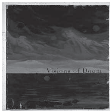
1. Kunstabücher (Libros de arte) . 2006. Óleo sobre lienzo, 250 x 276 cm. Colección particular. Madrid.