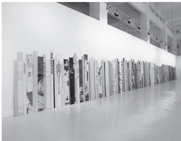
4. Kunstbüche (A-Z) 2004 - 2007 (Libros de arte A-Z). Óleo sobre lienzo 285 x 276 cm.

puesta del espectador para luego ir poco a poco desembocando en un manifiesto deseo de entender las numerosas cuestiones que crecen dentro y alrededor del mundo del arte; sino ¿por qué tenemos la ligera impresión de que en los nombres seleccionados faltan o sobran algunos? Es una buena pregunta para comenzar.